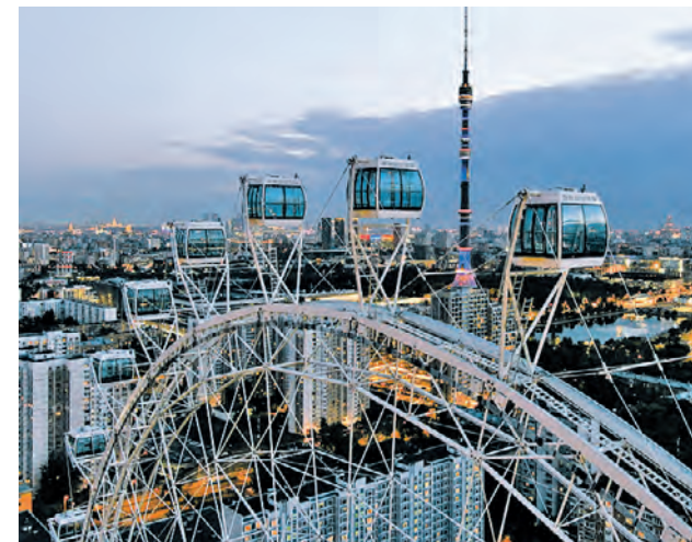
29 августа 2022 года. Вид на Останкинскую телебашню и колесо обозрения «Солнце Москвы» на ВДНХ

Подготовил Никита Бессарабов vecher@vm.ru