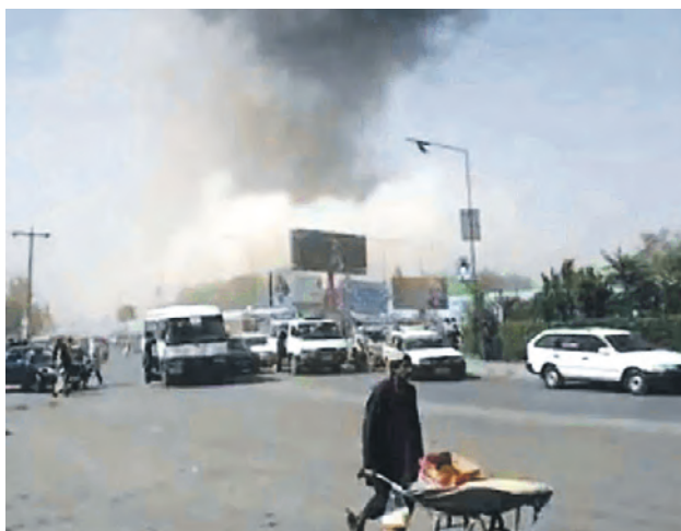
5 сентября 2022 года. Взрыв около посольства в Кабуле произошел в 10:50