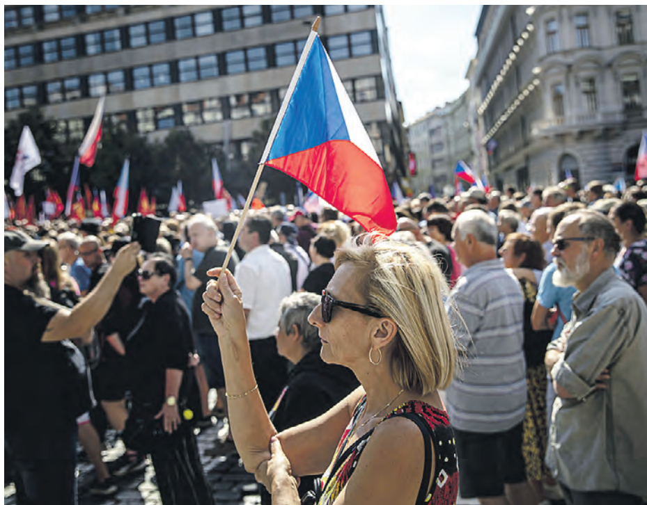
3 сентября 2022 года. Люди размахивают национальными флагами в знак протеста против чешского правительства на Вацлавской площади в Праге

Эти выходные для европейских политиков выдалась жаркими: прошли масштабные митинги. Главное требование демонстрантов — отменить антироссийские санкции, чтобы снизить цены на газ, электричество и продукты. Волна пошла из Праги, где в субботу, по разным данным, собрались от 70 до 100 тысяч разгневанных горожан. Демонстранты потребовали от правительства Петра Фиалы уйти в отставку, а также обеспечить поставки газа по низким ценам — то есть закупая его в России. Один из организаторов митинга Зуанна Майерова-Заградникова заявила, что правительство обязано отменить антироссийские санкции, наносящие ущерб чехам. Еще один лозунг митингующих — прекратить поставки оружия Украине. «Это не наша война», — заявила Майерова-Заградникова.