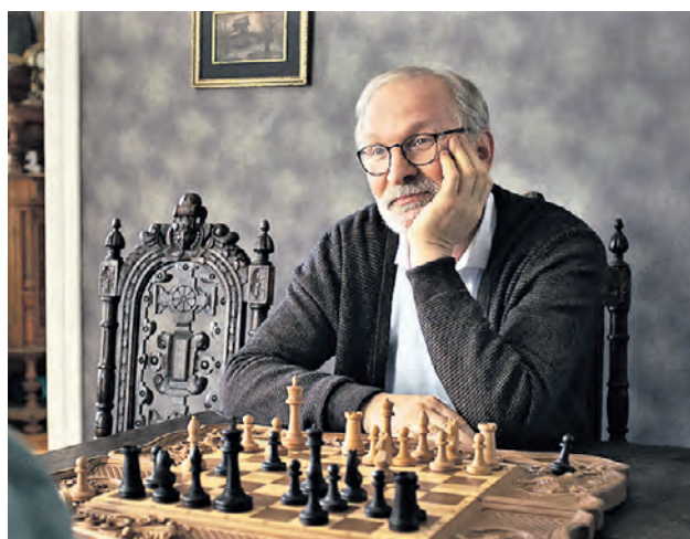
Федор Добронравов в фильме «Календарь ма(й)я»

может закрыться из-за пониженного спроса, российские зрители, напротив, начали массово посещать кино. Так, с 1 по 4 сентября насладиться новинками пришла 751 тысяча человек — это на 100 тысяч больше, чем на прошлой неделе. Важно отметить, что это первый положительный показатель с весны этого года. — Пока зарубежного контента в кинотеатрах мало, зрители решили открыть для себя российское кино. Поэтому сейчас оно лидиру-