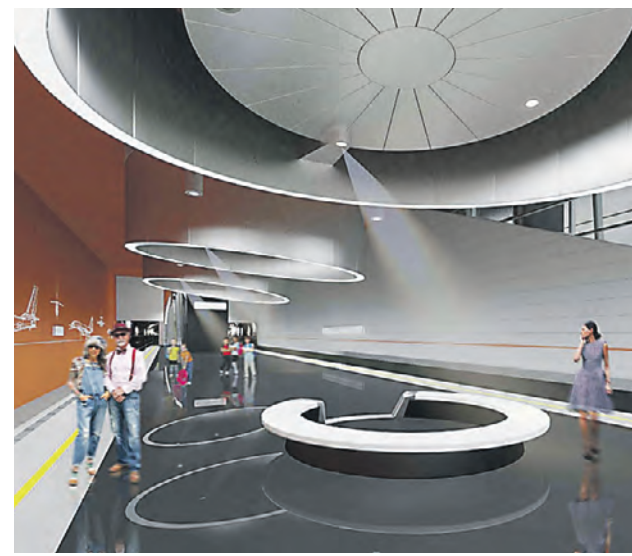
Проект станции «Пыхтино» Калининско-Солнцевской линии, которую планируют открыть в 2023 году