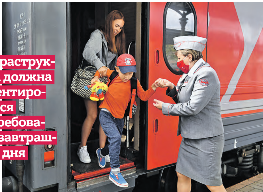
Пассажиры и проводница прибывшего поезда на Белорусском вокзале

Инфраструктура должна ориентироваться на требования завтрашнего дня