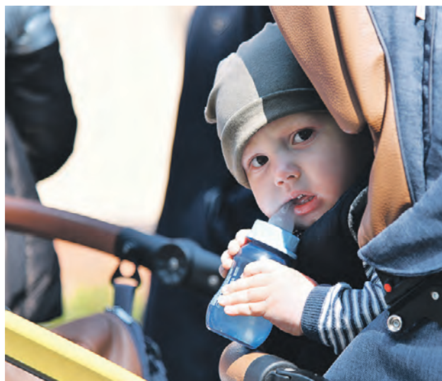
Ребенок в коляске в очереди у пункта выдачи гуманитарной помощи из России в Волчанске

По словам Сергея Шойгу, наши войска в отличие от ВСУ не наносят удары по гражданской инфраструктуре, где могут находиться мирные жители. Огневые позиции и военные объекты противника поражают с помощью высокоточного