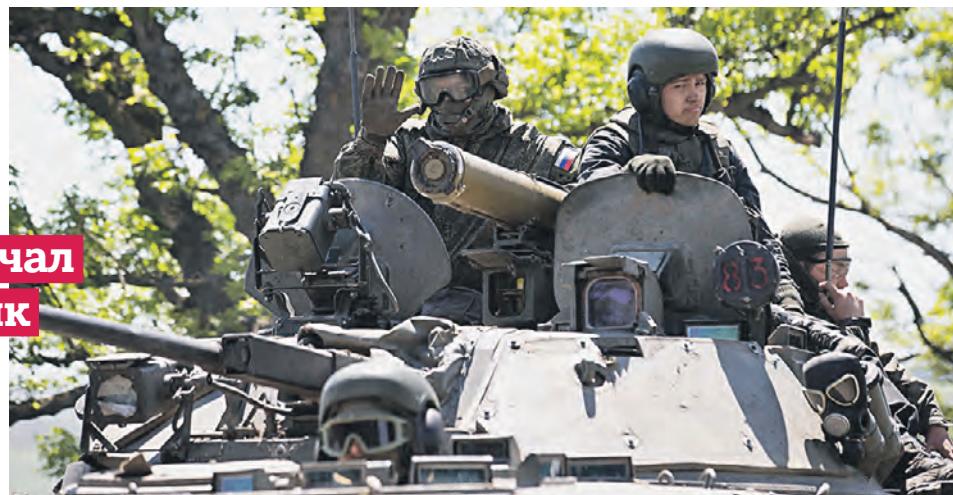
20 мая 2022 года. Военнослужащие на военной технике на одной из улиц освобожденного от украинских националистов Мариуполя