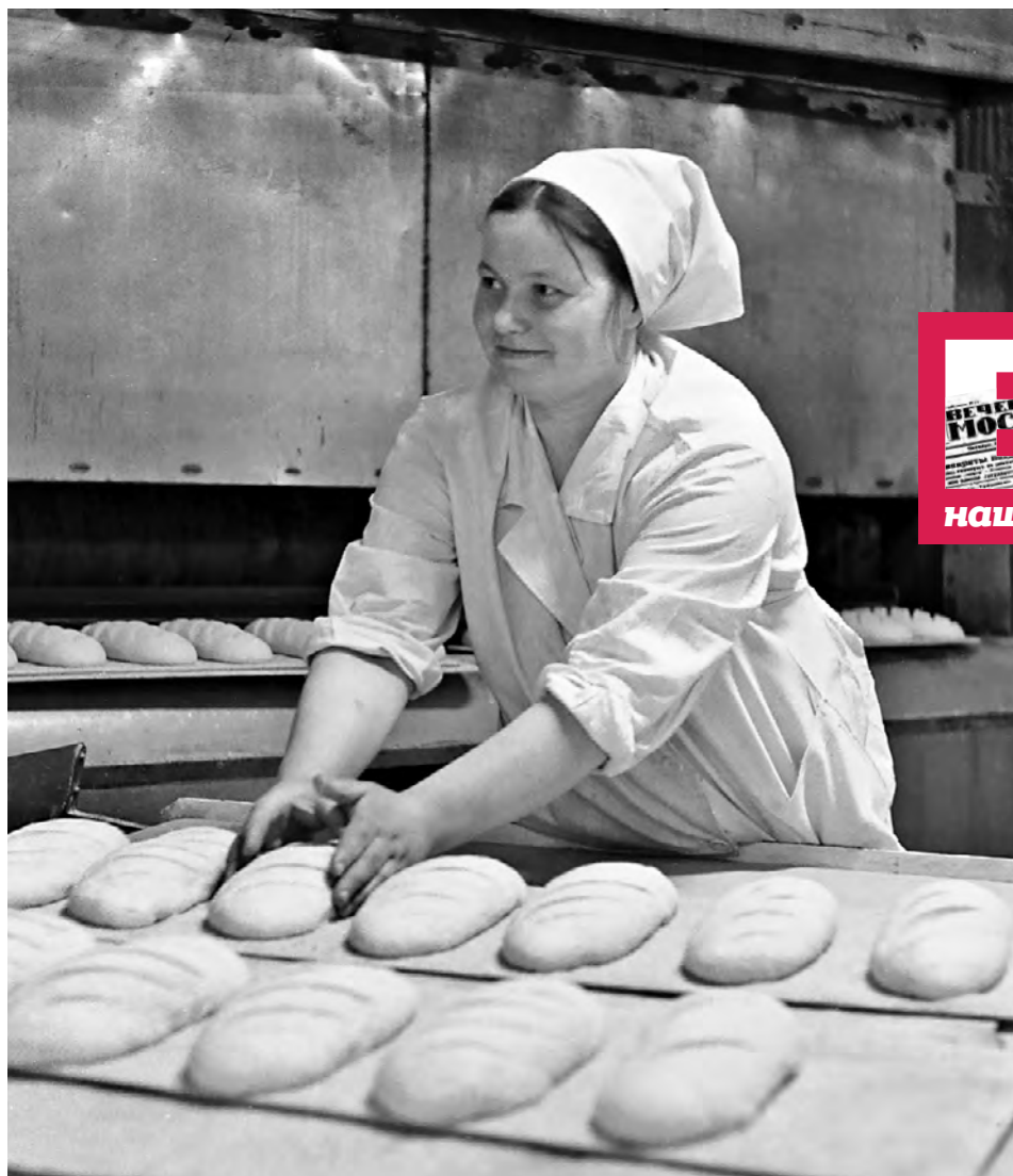
1 июля 1967 года. Пекарь формирует тесто для будущих батонов на Московском хлебозаводе. В день производство выпускало до 150 тонн хлеба

«Рекомендуем один из маршрутов — берегами реки Десны. Протяженность его около 12 километров. До исходного пункта — деревни Десны, что находится на Калужском шоссе, в 30 километрах от Москвы, вас доставит автобус № 231, который идет от станции метро «Калужская». У деревни река пересекает шоссе. Пойдете на запад, вверх по течению. С высокого левого берега Десны открываются