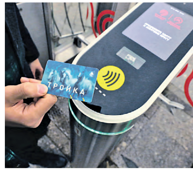
Новый турникет, установленный на станции метро «Проспект Мира»