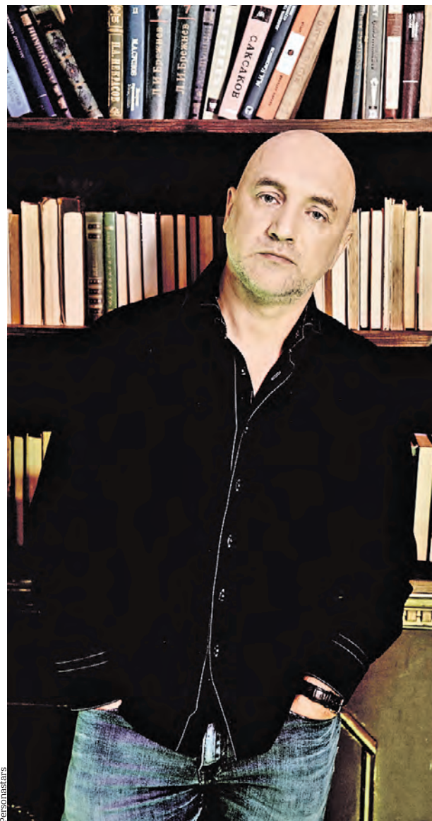
Захар Прилепин считает, что современный шоу-бизнес не соответствует принципам нашей страны

Перестройку нашей культурной, насквозь либеральной элиты сейчас пытаются мягко отложить — мол, не разгоняйте волну, не до этого сейчас. Но именно сейчас и надо начинать перезагрузку. Потому что страна именно сейчас должна слышать песни про