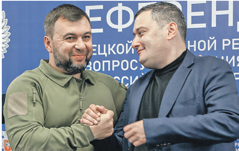
28 сентября 2022 года. Глава ДНР Денис Пушилин (слева) и председатель Комитета Госдумы РФ по информационной политике Александр Хинштейн

После референдумов Штаты пугают Россию войной