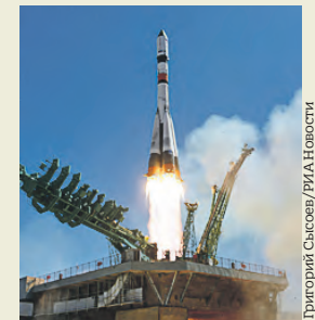
Григорий Сысоев / РИА Новости

Филиал АО «ЦЭНКИ» — НИИ ПМ им. академика Кузнецова отметил в сентябре 67 лет со дня создания. В состав ЦЭНКИ институт входит с 2006 года. Специалисты НИИ ПМ создали несколько поколений уникальных гироскопических приборов и систем для управления ракет-носителей и космических аппаратов серий «Восток», «Союз», «Молния», «Космос», «Прогресс», «Луна», «Марс», «Салют» и других. В этой наукоемкой отрасли наша страна занимает одно из ведущих мест. — Сегодня гироскопические приборы НИИ ПМ обеспечивают реализацию перспективных программ отечественной космической отрасли, — рассказывают в пресс-службе предприятия. НИИ ПМ стал одним из первых предприятий ракетно-космической промышленности России в области исследований инерциальной навигации и разработки высокоточных гироскопических приборов. Его разработки использовались на станции «Мир», а сегодня применяются на служебных модулях российского сегмента Международной космической станции.