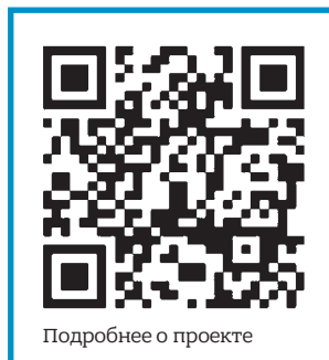
Подробнее о проекте