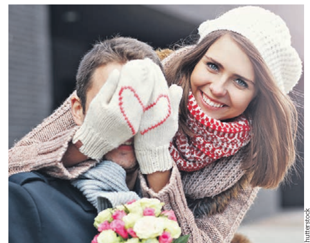
Неважно, с какими настроениями мы встречаем День влюбленных: это отличный повод сказать добрые слова

Любить и хвалить близких надо каждый день, а не только по каким-то непонятным дням — причем зимой. Не понимаю увлечения других этим праздником, он нужен только коммерсантам.