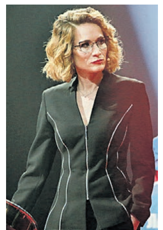
Мария Киселева вновь ведет шоу «Слабое звено». И она прекрасна!

Когда-то олимпийская чемпионка так удачно воплотила на экране образ стервы-ведущей, что представить на ее месте никого другого невозможно. Шоу будет выходить по пятницам в 19:15. «Программа помогла мне лучше понимать людей. Уверена, что сейчас буду разбираться еще лучше! —