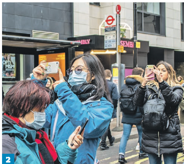
11 февраля 2020 года. На борту лайнера Diamond Princess (1) находятся 136 заболевших. 25 января 2020 года. Туристы из Китая на улицах Лондона (2)

Количество жертв на утро 13 февраля — 1369 человек, общее число заболевших во всем мире уже больше 59 тысяч. Вылечились от коронавируса 6067 человек. Статистикой фиксируются новые случаи заражения за пределами Китая. В Гонконге, где уже больше 40 случаев заболевания, из-за китайского вируса эвакуировали многоэтажку.