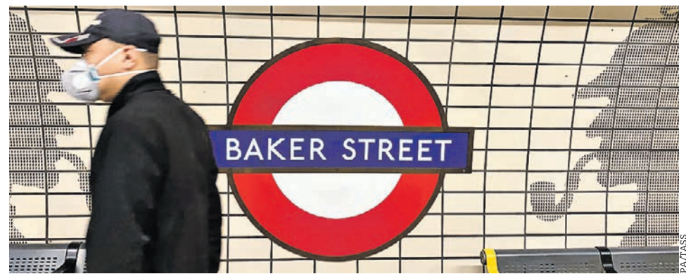
25 марта 2020 года. Лондонский метрополитен в первый день карантина

Как сообщает газета Frankfurter Allgemeine, из-за эпидемии коронавируса пассажиропоток в лондонской подземке упал настолько, что для сохранения одной из старейших транспортных систем мира необходимы финансовые вливания в размере почти 6 миллиардов фунтов стерлингов.