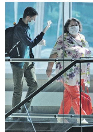
8 июня 2020 года. Туристы в аэропорту Домодедово

Тестирование на наличие или отсутствие опасной инфекции доступно по предварительной записи в городских поликлиниках. Несмотря на доступность процедуры, по-прежнему более двух процентов граждан, возвращающихся с отдыха за границей, не вносят результаты тестирования в Единый портал государственных и муниципальных услуг в течение трех дней после прилета. Тем самым они представляют реальную угрозу здоровью и жизни окружающих их людей. Роспотребнадзором уже направлено 2313 уведомлений о явке для составления протокола об административном правонарушении. Составлено 1638 протоколов по статье, предусматривающей ответственность в виде штрафа в размере до 40 тысяч рублей. Если при этом будет доказано причинение вреда здоровью других людей, то размер штрафа может вырасти до 300 тысяч рублей.