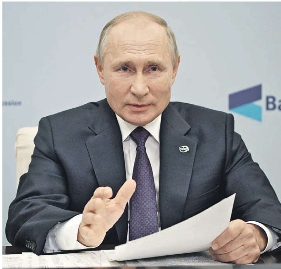
Владимир Путин на заседании дискуссионного клуба «Валдай» расставил точки над «и» по поводу многих дискуссионных вопросов о государственной стратегии

■ На минувшей неделе президент России Владимир Путин в режиме видеоконференции выступил на XVII сессии международного Валдайского клуба.