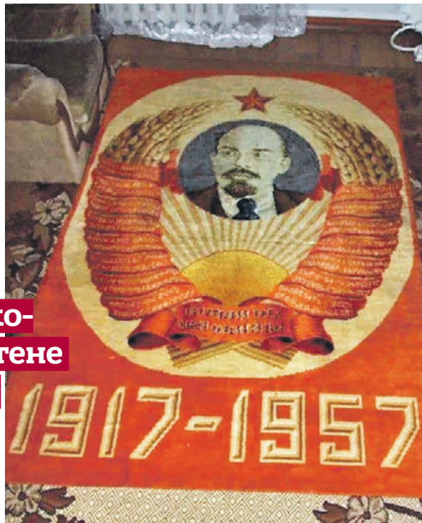
Таких ковров всего два: один подарили немцам, другой — американцам

ствах его вывезли на Сахалин, покрыв масляной краской, чтобы скрыть рисунок, а затем продали во Владивостоке. Москвич хочет получить за него 8,5 миллиона рублей.