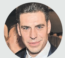
Дмитрий Дюжев Актер, певец

Песня «Я не люблю» мне нравилась с детства. Это то, о чем хочется и нужно говорить сегодня. Очень много стало чего-то такого второстепенного, а о главном мы частенько молчим.