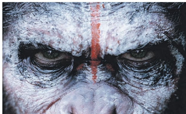
Симпатичный герой фильма Мэтта Ривза «Планета обезьян. Революция»

Эдем совсем не так мил, как может показаться... Ну а завершить вечер полуночникам поможет «Стукач» (23:25) — триллер с Дуэйном Джонсоном (Скалой).