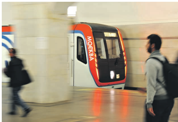
11 октября 2018 года. Поезд «Москва» на станции «Пушкинская»