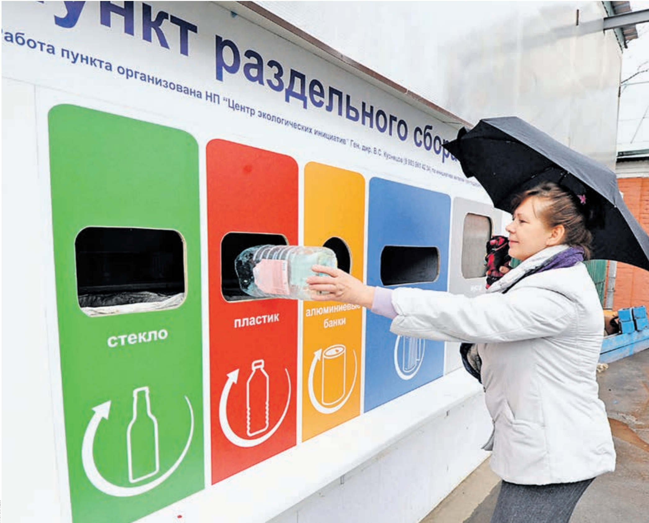
8 октября 2016 года 13:17 Уже год в одном из дворов на Пятницкой улице стоят баки для раздельного сбора мусора. Жители приходят сюда, чтобы выкинуть даже одну пластиковую бутылку