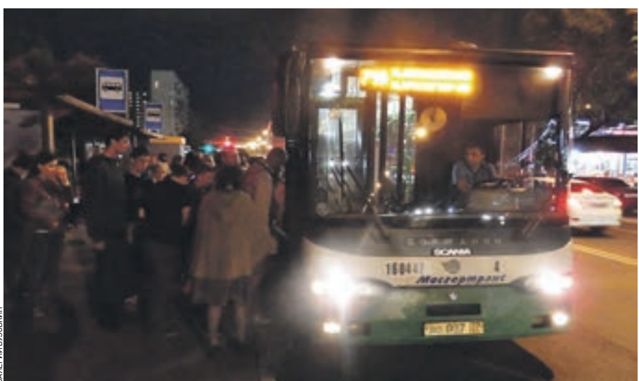
16 сентября 19:40 Улица Генерала Белова. Пассажиры занимают свободные места в автобусе маршрута № 719

Мелкий дождь барабанит по крыше остановки «Метро «Домодедовская», поторапливая горожан быстрее разехать по домам. Несколько человек, сидя на скамейке, всматриваются вдаль.