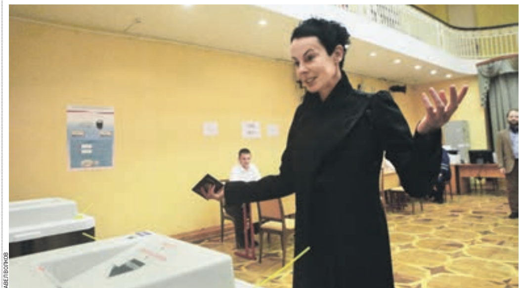
Вчера 9:45 Избирательный участок в школе № 2095. Знаменитая артистка, директор и художник легендарного Театра на Таганке Ирина Апекумова только что исполнила свой гражданский долг

БОРИС ВОЙЦЕХОВСКИЙ b.voitsekhovskiy@vm.ru