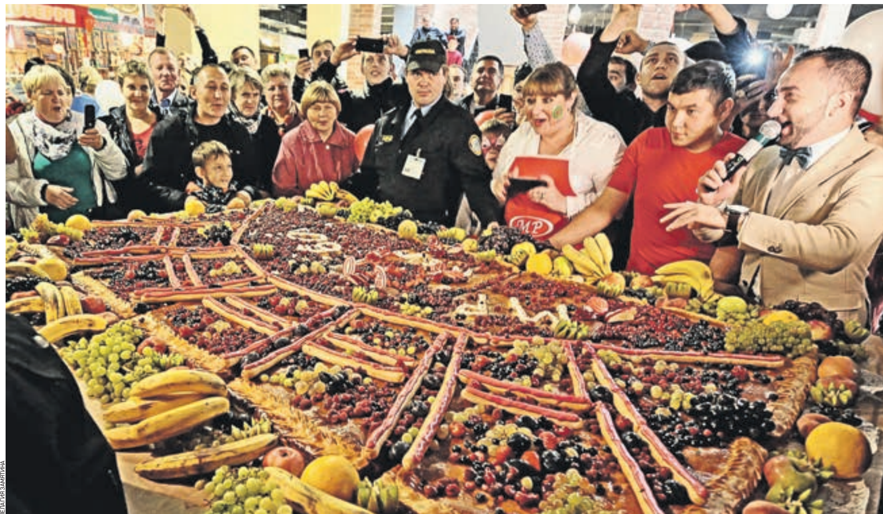
Вчера 14:34 Посетители Москворецкого рынка, прежде чем отведать праздничный пирог, снимают это 80-килограммовое чудо мобильными телефонами на память: когда еще доведется увидеть кондитерское изделие площадью в три квадратных метра! Больше всего пирог похож на прилавок фруктового отдела

ЮБИЛЕЙ Вчера крупнейшему рынку столицы — Москворецкому — исполнилось 60 лет. Корреспонденты «ВМ» побывали на празднике и отведали кусочек 80-килограммового пирога, испеченного специально к этой дате кондитерами рынка.