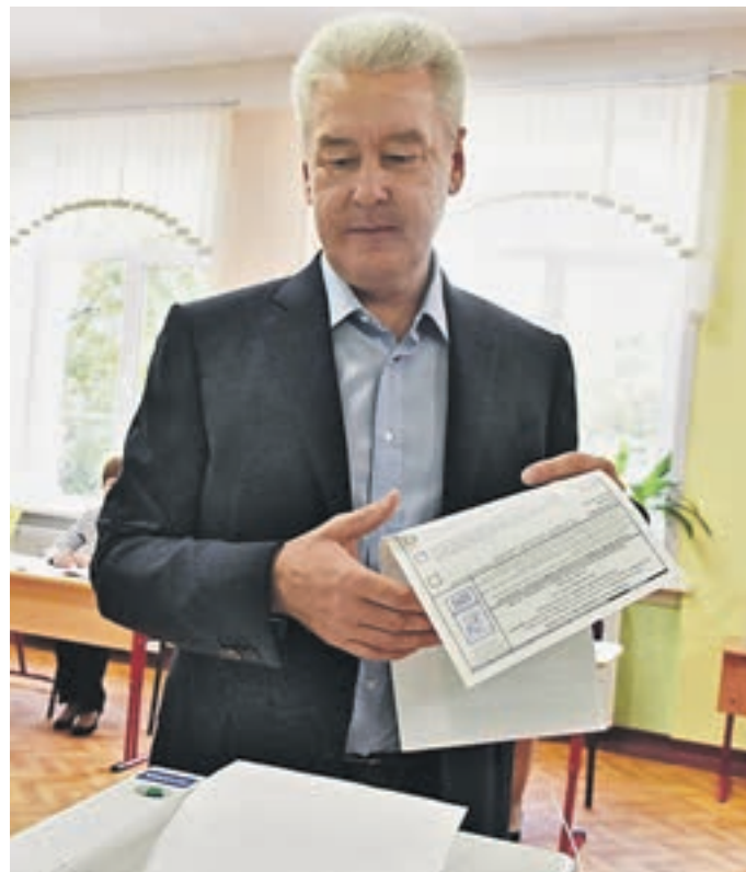
Вчера 11:00 Мэр Москвы Сергей Собянин принял участие в голосовании на избирательном участке № 90, который расположен в школе № 1241