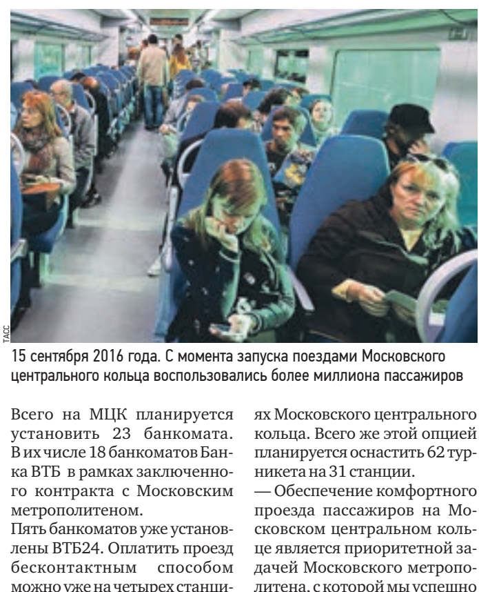
15 сентября 2016 года. С момента запуска поездами Московского центрального кольца воспользовались более миллиона пассажиров

Социально ориентированные коммерческие компании помогают Москве развивать транспортную инфраструктуру. Так, Банк ВТБ будет оказывать услуги по инкассации выручки от продажи билетов на МЦК — Московском центральном кольце. На сегодняшний день в банке уже открыты три счета Центральной пассажирской пригородной компании, куда будут перечислять средства. — Согласно графику инкассации станций, — рассказали «Вечерней Москве» в банке. Сервисы оплаты проезда по Московскому центральному кольцу уже полностью интегрированы в систему городского общественного транспорта. Так, для пополнения карты «Тройка» пассажиры могут воспользоваться как мобильным приложением «Мой проездной» Банка ВТБ, так и банкоматами или автоматами по продаже билетов.