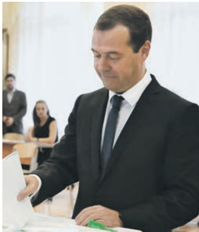
Вчера 12:25 Премьер-министр России Дмитрий Медведев отдал свой голос на участке № 2760, открытом в Шуваловской гимназии № 1448 на улице Довженко