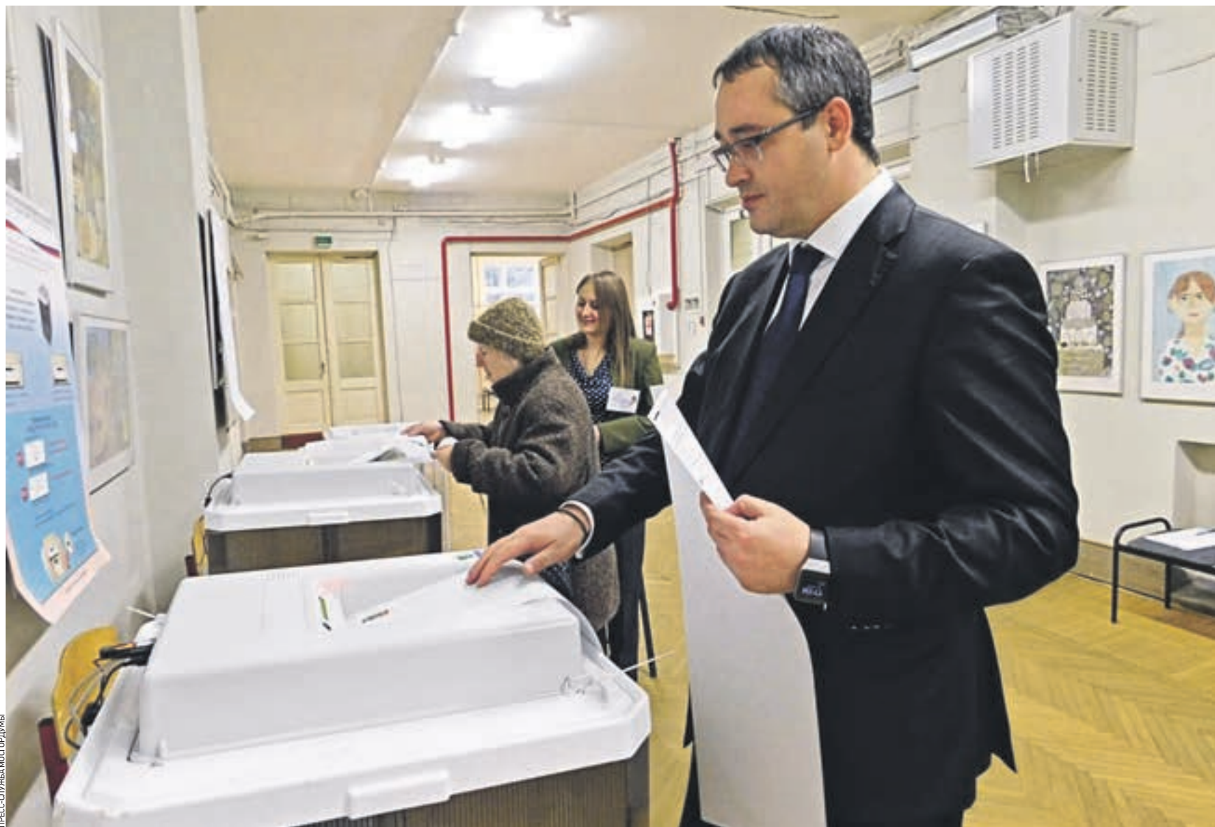
Вчера 17:35 Председатель Московской городской думы Алексей Шапошников проголосовал на избирательном участке № 79. В день проведения выборов он занимал должность заместителя руководителя Общественного штаба по наблюдению за выборами в Государственную думу

Избирательный участок развернулся в холле второго этажа. За честным ходом голосования следят наблюдатели и как минимум две видеокамеры. Одна из них обеспечивает общий обзор. Другая установлена прямо напротив кабин для голосования, задрапированных плотной темно-синей тканью. Система видеонаблюдения зарекомендовала себя еще на прошлых выборах — президента России, мэра Москвы и депутатов Московской городской думы. В общей сложности на 3416 участках столицы установлены 6832 камеры. Они будут работать не только весь день, но и всю ночь, пока избирательные комиссии будут подсчитывать голоса. Эти же камеры передают картинку для онлайн-трансляции в интернете. Так что при желании каждый желающий может посмотреть, как проходит выборы на том или ином участке. В районе 11 часов дня на избирательном участке № 90 свои два бюллетеня получил Сергей Собянин. Ему, как и всем, предстояло отдать свой голос не только за партию, которую он хочет видеть в составе Государственной думы, но и за конкретного депутата, что будет на уровне правительства представлять интересы жителей Центрального административного округа столицы. Твердой рукой глава города поставил две галочки. — Сегодня очень важный день для страны — выборы в Государственную думу, —