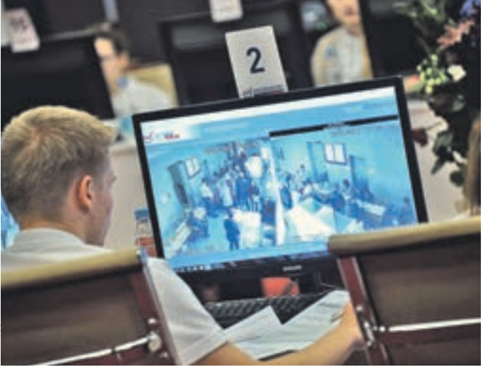
Вчера 11:11 Наблюдатель Общественного штаба удаленно следит за тем, что происходит на одном из избирательных участков