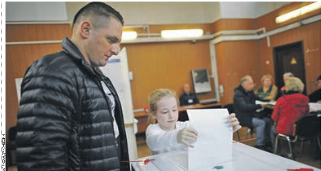
Вчера 12:10 Избирательный участок № 2289. Народный артист России Аскольд Запашный дает возможность поучаствовать в процессе выборов своей семилетней дочери Еве