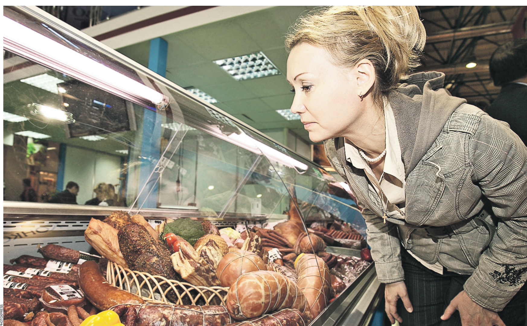
10 октября 2014 года 15:08 Чтобы сохранить ассортимент, качество продукции и удержать цены на уровне прошлого года, свой план действий представили и московские маслоперерабатывающие предприятия. Так, бизнесмены считают, что предприятия необходимо субсидировать

Действовать выгодно В сложившихся условиях бизнес получит дополнительные преференции. Москва для инвесторов стала более выгодной площадкой, чем была до декабря 2014 года. Ведь современная экономическая ситуация позволяет серьезно сократить издержки бизнеса на развитие проектов. Так, тарифы в столице остаются фиксированными, прежней осталась и зарплата специалистов и рабочих в рублях, а в пересчете