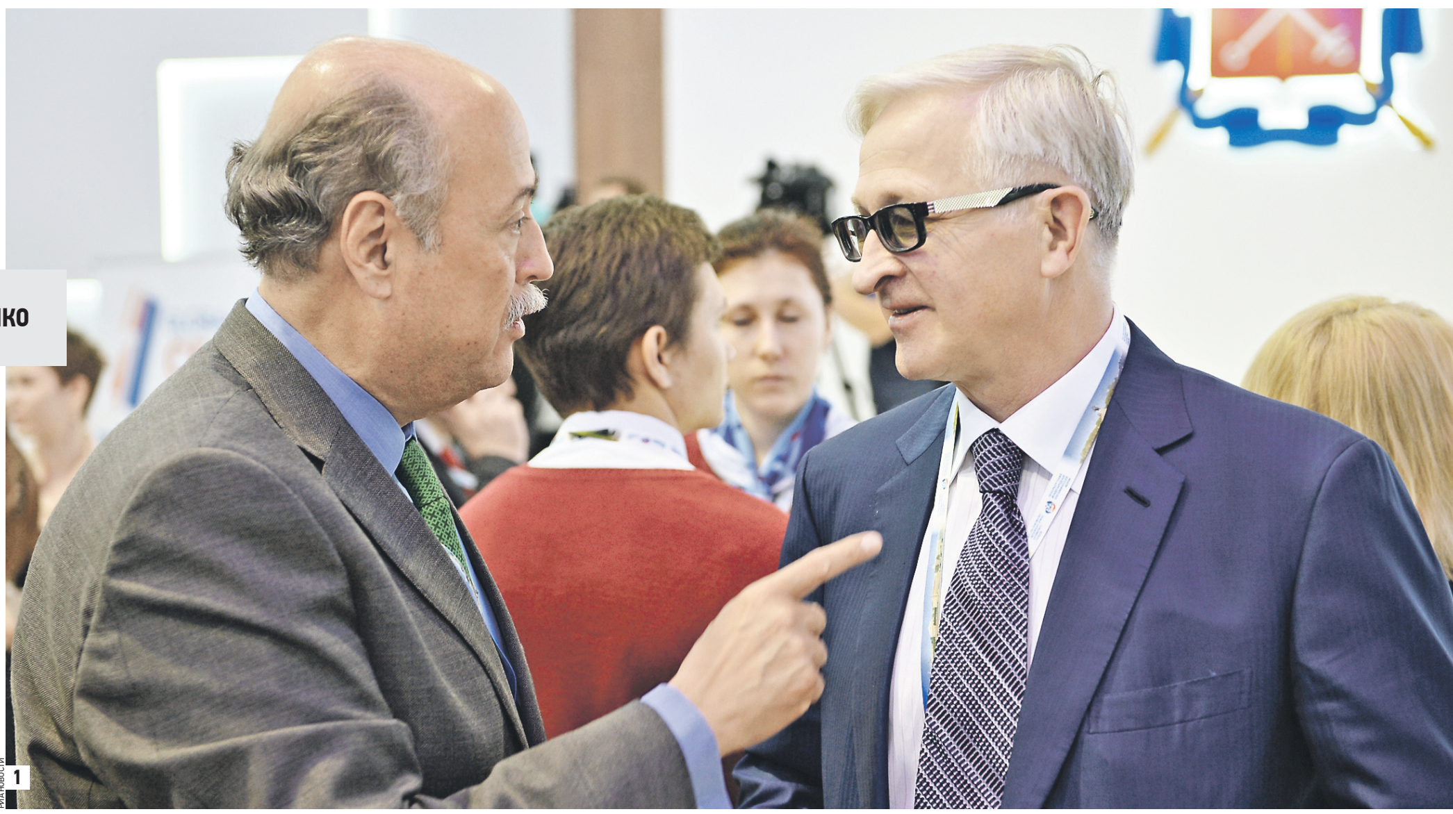
22 мая 2014 года. Посол Мексики Рубен Бельтран (слева) и президент Российского союза промышленников и предпринимателей Александр Шохин на саммите XVII Петербургского международного экономического форума (1) В декабре прошлого года господин Бельтран посетил редакцию «ВМ» и ответил на вопросы журналистов во время прямого эфира (2)

Известная мудрость: «Лучшее место для отдыха — то, где твои друзья». В Мексике очень любят русских. В прошлом году к нам приехали более ста тысяч туристов из России: это впечатляющие цифры для нас!