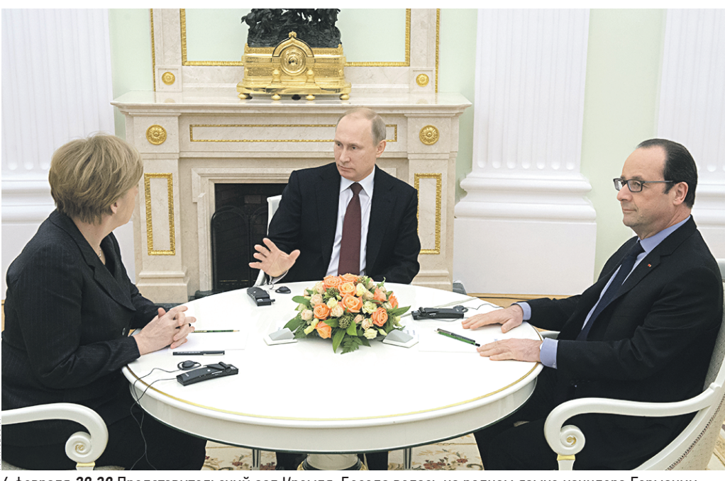
6 февраля 20:39 Представительский зал Кремля. Беседа велась на родном языке канцлера Германии. Владимир Путин четко, по-немецки объяснил Меркель и Олланду позицию России по Украине

ГЕОРГИЙ БОВТ edit@vm.ru Мир давно не видел проявления «челючной дипломатии» на столь высоком уровне. Лишь в перерыве пятичасовых переговоров дежурившие под дверями журналисты заметили, что лица у всех переговорщиков были мрачные. Накануне в Киеве встреча с Порошенко проходила в более широком формате. И там все улыбались. Большинство догадок осведомленных (но не информированных полностью) источников сводятся к тому, что может родиться план разграничения воюющих в Донбассе сторон с помощью международных миротворцев. Но вот каких?