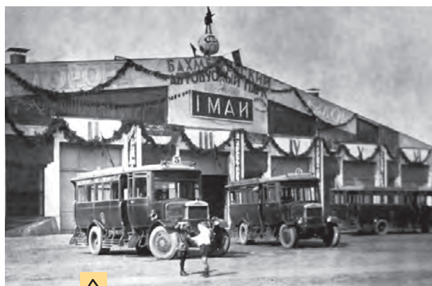
Автобусы «Лейланд» у гаража на территории Бахметьевского автобусного парка в день празднования Первомая, 1928 год

11 августа 1959 года. Состоялось торжественное открытие аэропорта Шере-