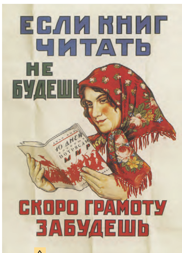
Плакаты СССР «Если книг читать не будешь — скоро грамоту забудешь», художник Александр Могилевский. 1925

С матом сейчас стало постраже, появились целлофанованные издания с пометкой 18+. Но давайте признаемся: если бы мат