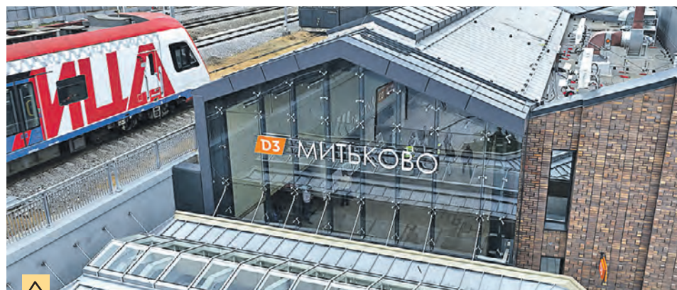
2 августа. Московский городской вокзал «Митьково» третьего маршрута МЦД

— Выставочное пространство увеличится на 2 тысячи квадратных метров. Это позволит установить новые интерактивные экспонаты, — поделился он. Собянин отметил, что ВДНХ будет и дальше радовать любителей прогулок цветущими аллеями и парками. — А этим летом в парке развлечений «Орион» открылась канатная дорога, где на всю красоту территории можно взглянуть с высоты, — добавил мэр. Кстати, к юбилею ВДНХ запустили спецпроект. На сайте выставки можно узнать о ее возрождении, увидеть архивные и современные кадры павильонов.