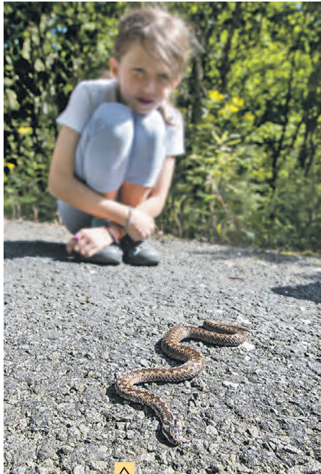
Маленькая девочка, несмотря на опасность, находится рядом с ядовитой гадюкой