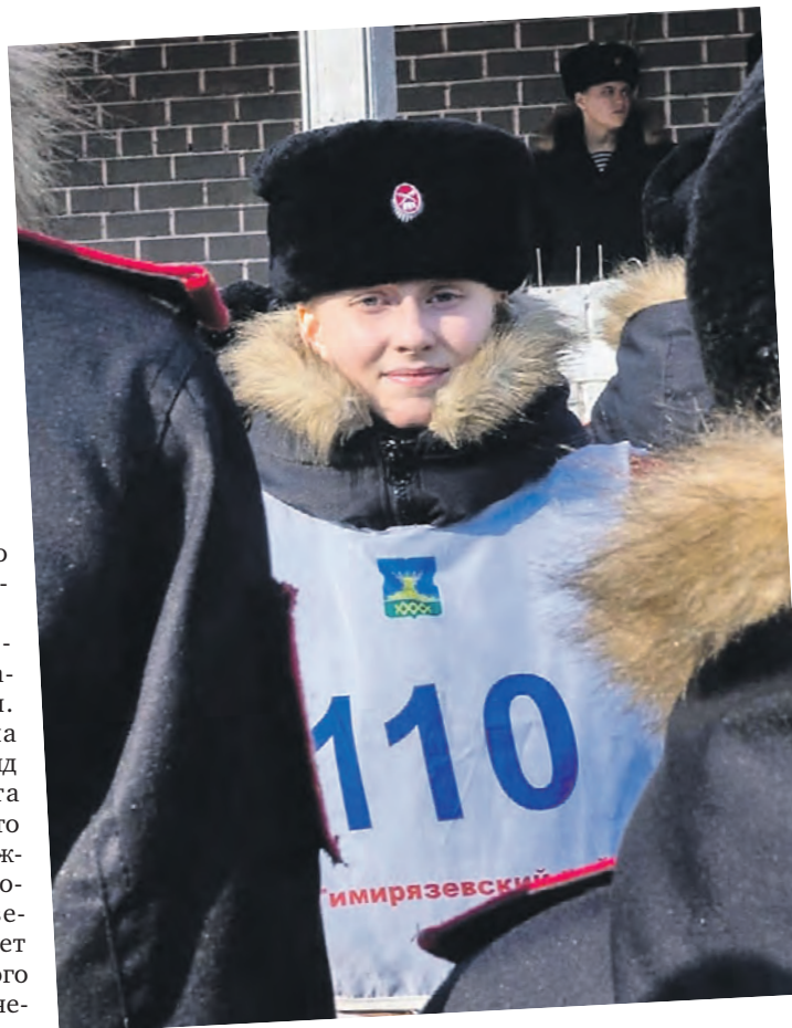
Фото из альбома

Свои фото с историями присылайте на nedelya@vm.ru или на почтовый адрес редакции: 127015, Москва, Бумажный пр-д, 14, стр. 2, «Вечерняя Москва»