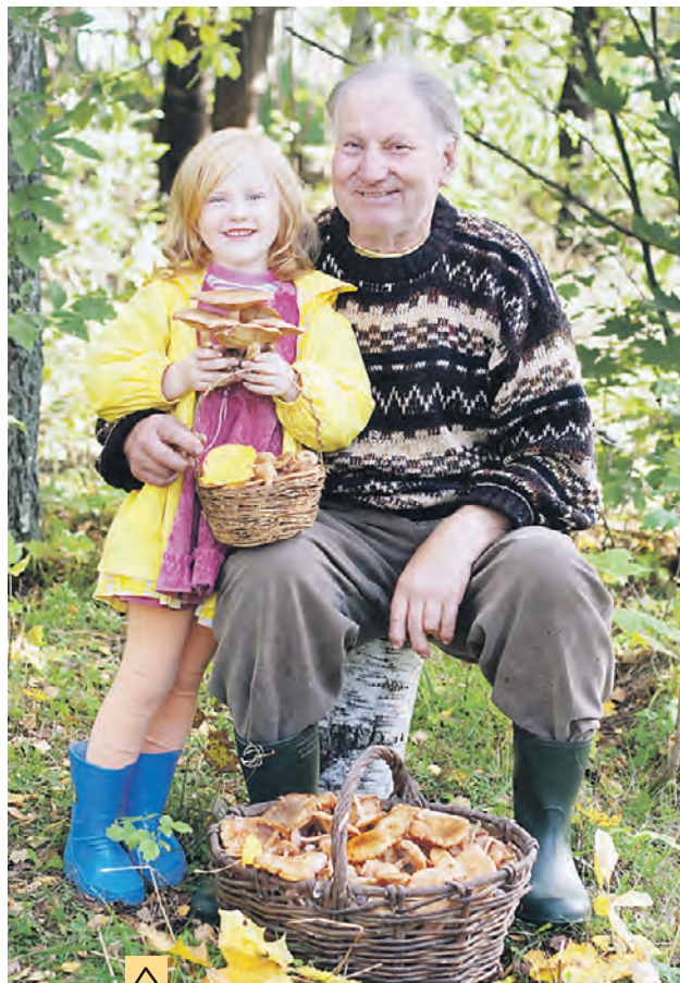
Грибники Подмосквы радовались в этом году богатому сбору лисичек. Но не торопитесь убирать корзины — все еще впереди!