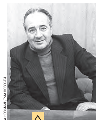
Советский писатель Анатолий Алексин, фото 1986 года

Анатолий Алексин прожил долгую жизнь. Он жил в СССР, России, Израиле, умер в Люксембурге на 94-м году. Его отец — советский чиновник — в 1937 году был репрессирован, приговорен к расстрелу, но спустя два года вышел на свободу. Во время войны Алексин работал на военном заводе, был ответственным секретарем газеты «Крепость обороны», писал заметки в «Пионерскую правду». Не обошел его семью (настоящая фамилия писателя Гоберман) и холокост. Его бабушка оказалась на оккупированной территории, где ее выдал фашистам человек, с детьми которого она занималась уроками. После войны дети этого человека разорвали с отцом отношения и написали об этом писателю... Алексин всю жизнь относился к детям лучше, чем ко взрослым. «Детство живет только в хороших людях», — говорил он. Начинать он с рассказов и повестей для дошкольников — «Сигнальщики и горнисты», «Отряд шагает в ногу», потом перешел на прозу для подростков. В советской литературе Алексин стал писателем, поднимающим темы морали и нравственности, где человек человеку «друг, товарищ и брат». В повестях «Домашний совет», «Безумная Евдокия» и других он точно соблюдал баланс между переживаниями героев и позитивной картиной жизни в СССР. Его отличительной чертой прозы было стремление рассказывать о житейских проблемах, избегая морализаторства. Алексин добавлял соцре-