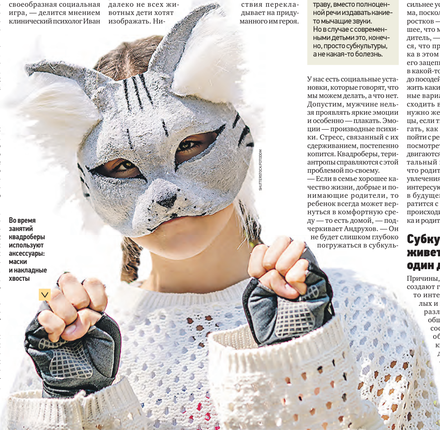
Во время занятий квадроберы используют аксессуары: маски и накладные хвосты

— Для взрослого есть некоторые статусные ограничения, указывающие ему, какой род занятий приемлемый, а какой — недо-