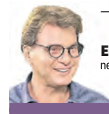
Евгений Додолев nedelya@vm.ru

Галина Коньшина стала известна благодаря участию в юмористическом телешоу «Большая разница», где зрители увидели ее блестящие пародии на многих звезд эстрады, ТВ и политиков