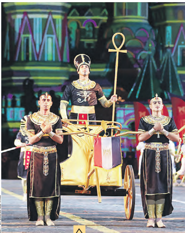
Военный коллектив из Египта давно стал добрым другом фестиваля: музыканты приезжают к нам четвертый раз