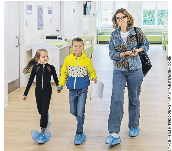
18 июля 2022 года. Филиал № 1 Детской городской поликлиники № 42 принял первых пациентов после реконструкции

Теперь здесь все отвечает современным требованиям медицины и нового московского стандарта здра-