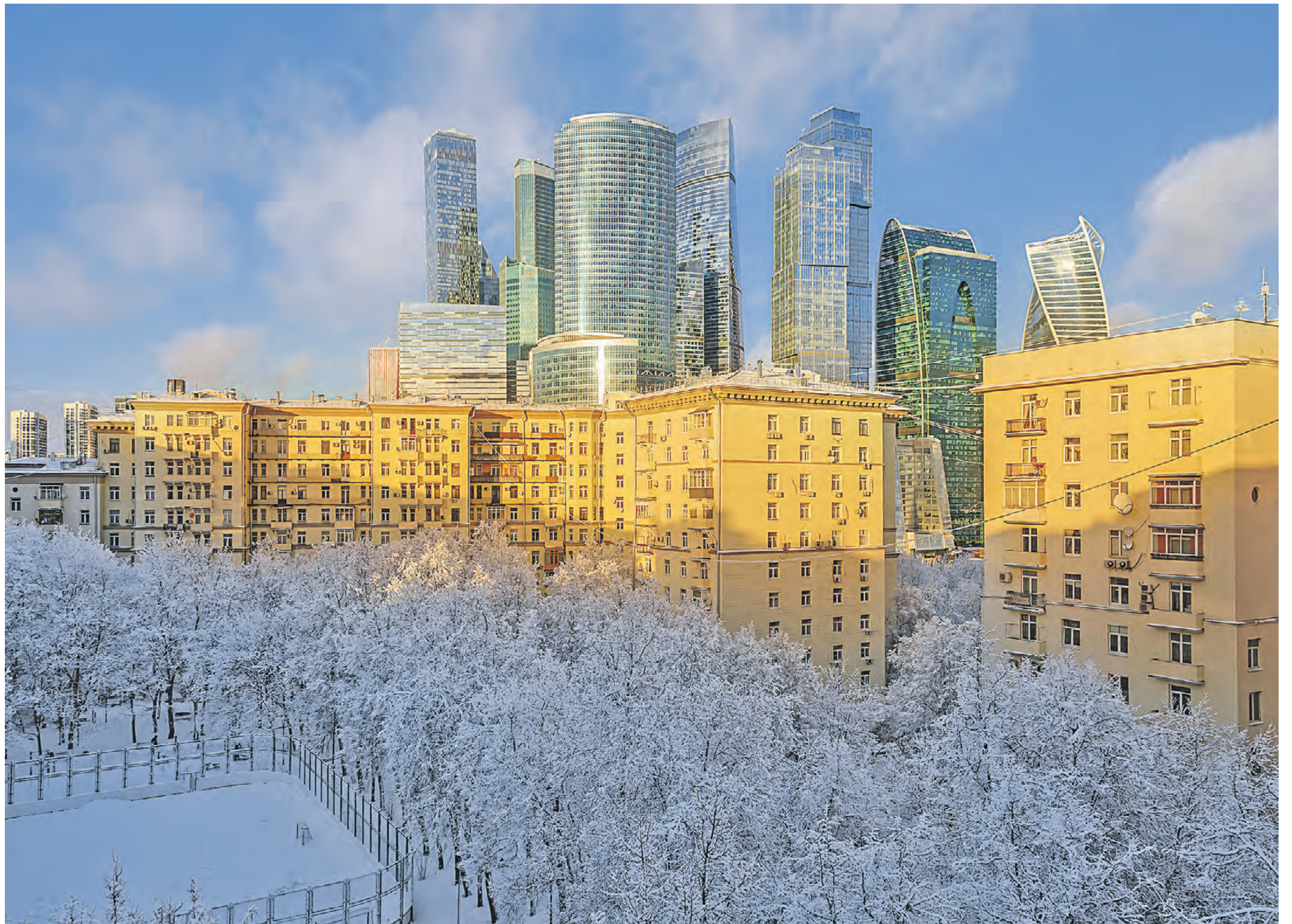
Снег, мороз и солнце — редкий для нынешней зимы надр запечатлел наш фотокорреспондент во дворе одних из последних построенных в столице «сталинок», которые находятся на Кузнецком проспекте. За старыми домами, построенными в 1953 году, возвышаются башни «Москвы-Сити» — символ столицы XXI столетия.