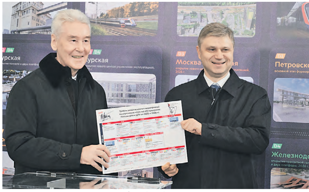
16 января. Мэр Москвы Сергей Собянин (слева) и глава РЖД Олег Белозеров открыли городской вокзал Щербинка на МЦД-2 и обновили планы по совместной работе