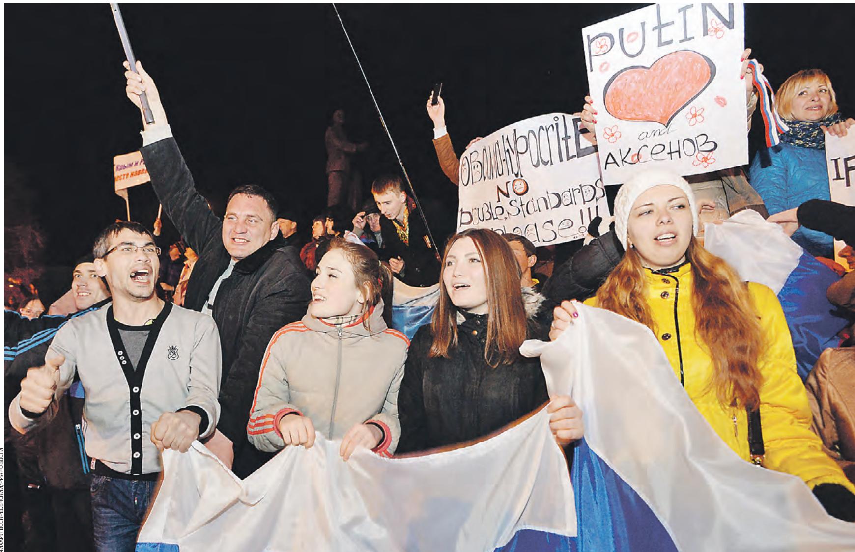
18 марта 2014 года. Жители Симферополя смотрят трансляцию праздничного концерта в честь подписания договора о принятии Крыма в состав Российской Федерации на центральной площади города

К утру протестующих разогнали. Но поскольку в столкновениях пострадали около 80 человек, это вызвало новую волну протестов. 1 декабря на антиправительственную акцию собрались уже более 500 тысяч человек. Маховик цветной революции раскрутился по полной. Вялотекущие протесты майдановцев длились почти три месяца. С 18 по 19 февраля 2014 года ситуация снова на-