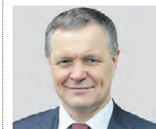
ВЛАДИМИР ЖИДКИН РУКОВОДИТЕЛЬ ДЕПАРТАМЕНТА РАЗВИТИЯ НОВЫХ ТЕРРИТОРИЙ ГОРОДА МОСКВЫ

ресный и познавательный формат отдыха в городе.