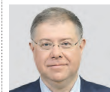
СТЕПАН ОРЛОВ ДЕПУТАТ МОСГОРДУМЫ

Последний раз мы катались на речном трамвайчике летом, года три назад. Наша семейная прогулка по реке началась от причала в парке Тушино. Два часа пролетели незаметно. Впечатления от речной прогулки остались самые замечательные — от приятной атмосферы, окружающей обстановки и от общения с сыновьями и мужем. Этим летом, кстати, планируем повторить поездку на речном трамвайчике, обновить эмоции и впечатления.