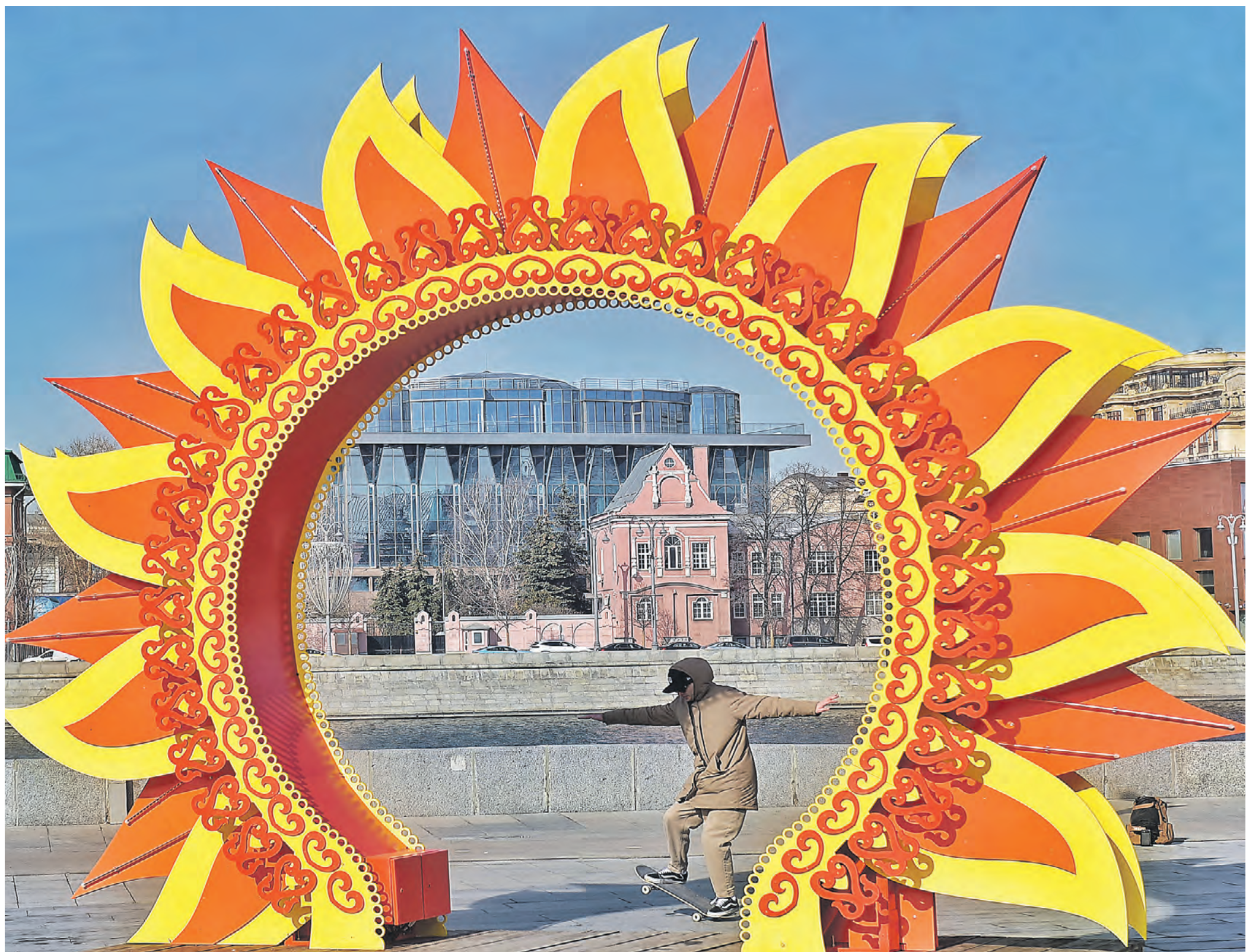
Яркая арка в виде солнца, украсившая Крымскую набережную к Масленице, согревает одним своим видом.