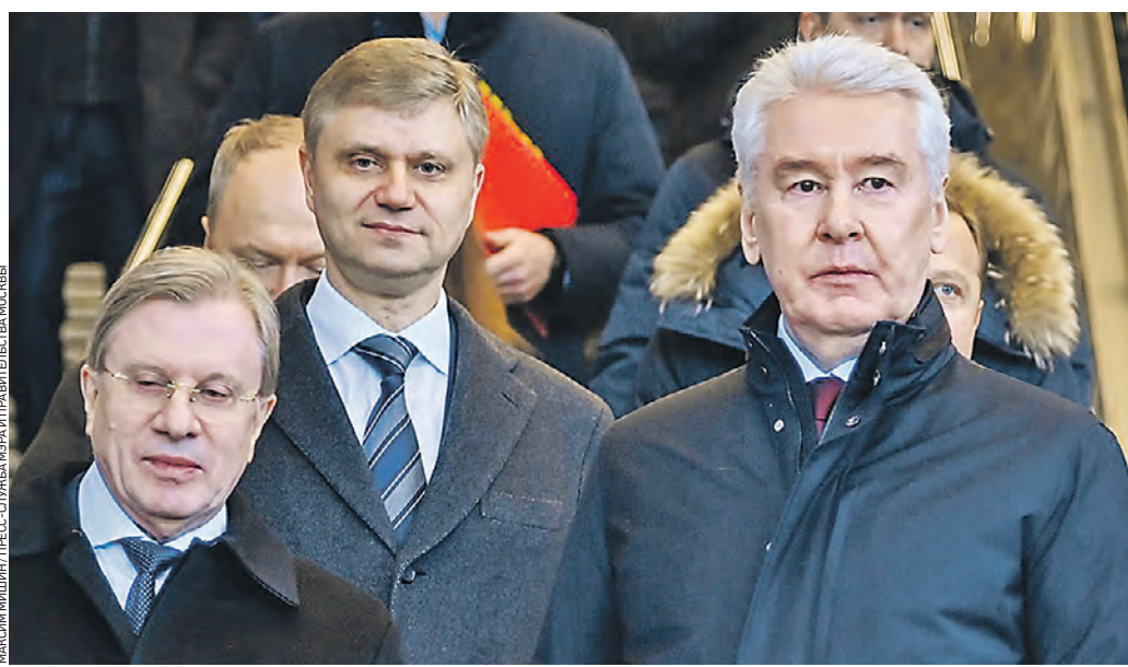
14 марта. Мэр Москвы Сергей Собянин, генеральный директор — председатель правления ОАО «РЖД» Олег Белозеров и министр транспорта РФ Виталий Савельев (справа налево) доложили президенту России Владимиру Путину о начале строительства высокоскоростной железнодорожной магистрали от Москвы до Санкт-Петербурга

Высокоскоростная магистраль протяженностью 679 километров свяжет крупнейшие городские агломерации и экономические центры России, в которых проживают более 40 миллионов человек — это