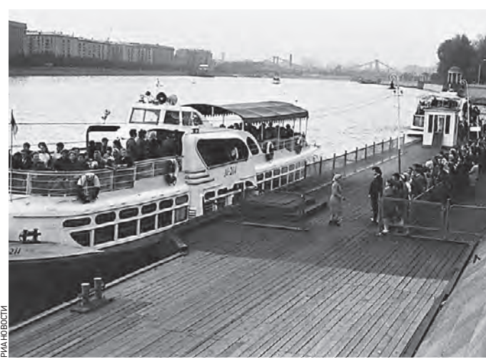
Теплоход у причала Центрального парка культуры и отдыха имени Максима Горького. Август 1969 года

Руководитель Департамента градостроительной политики Москвы Сергей Левкин сообщил, что с начала реализации программы реновации более