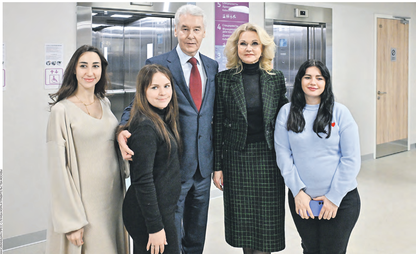
27 ноября. Мэр Москвы Сергей Собянин и заместитель председателя правительства России Татьяна Голикова (справа от мэра) пообщались с посетительницами крупнейшего в стране Центра женского здоровья, который открылся на юго-востоке столицы. Женщины получают в одном месте все виды необходимой помощи