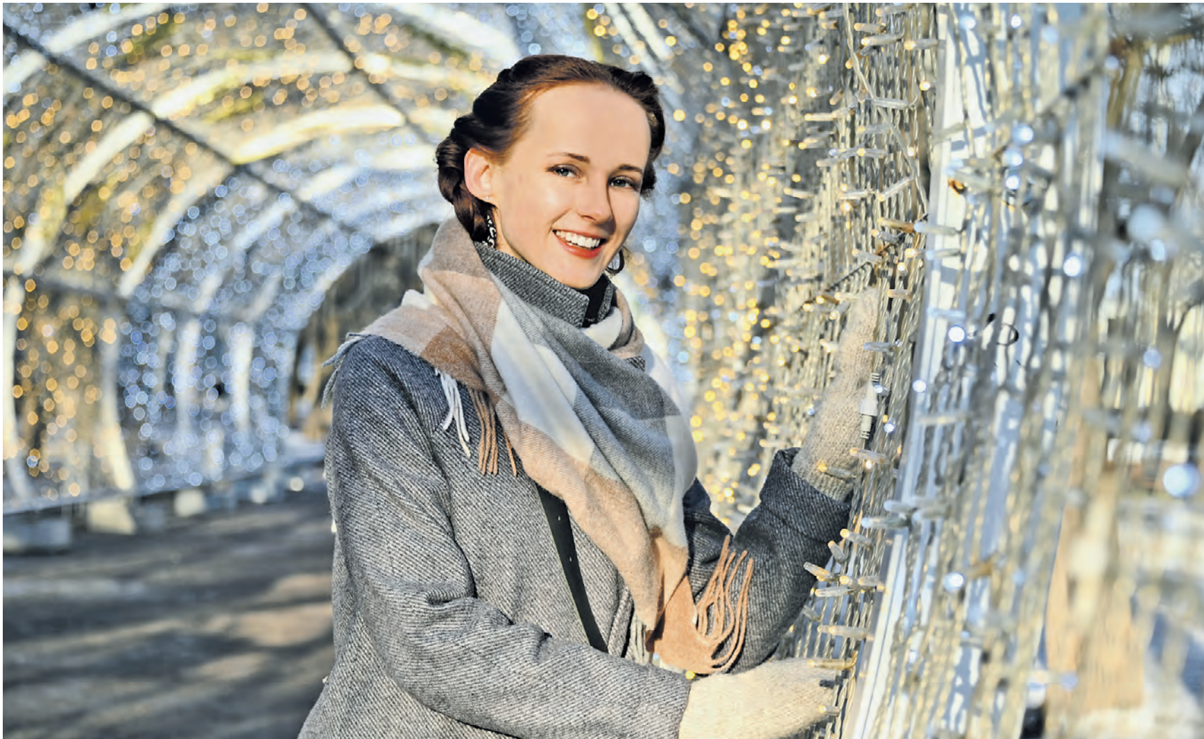
26 ноября. Актриса театра и кино Элеонора Морева прогуливается по центру столицы. Город облачается в праздничный наряд. На бульварах уже установлены световые тоннели, на площадях появляются арки, у ВДНХ и на Поклонной горе зажгли огни больших новогодних шаров.

Москва с каждым днем становится ярче и наряднее — площади, бульвары, парки, скверы и улицы города активно украшают к Новому году и Рождеству. Многие из праздничных декораций уже хорошо знакомы жителям и гостям столицы. Так, на Поклонной горе вновь появился самый большой елочный шар в мире — его высота более 20 метров, а весит он около 35 тонн. Центр по традиции украшают большие световые арки, напоминающие фасады столичных театров. На Бульварном кольце снова устанавливают световые тоннели, Театральной площади и Патриарший мост, как и в прошлом году, украст ажурными арками и конструкциями в виде рождественских звезд, а полюбопытствующие москвичам полярные медведи вернутся на Ростокинский аведак. — Москва сейчас словно в предвкушении волшебства, — прогуливаясь по центральному улицам столицы, подмечает детали актриса театра и кино Элеонора Морева. — Здорово, что столицу