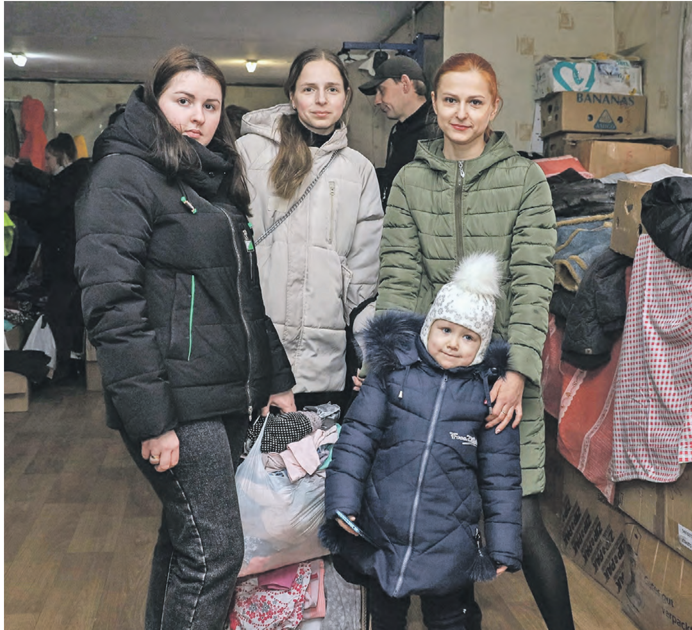
18 февраля. Жители Макеевки и других населенных пунктов Донецкой Народной Республики получили теплую одежду, которую собрали волонтеры фонда «Все будет хорошо». В тот день помощь оказали более 30 семьям