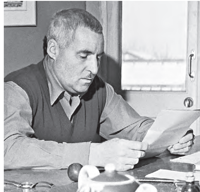
Поэт и писатель Константин Симонов в рабочем кабинете. Фото 1960 года

Счастливы те, кто живет без сомнений... У Симонова той поры их не было. Активно печатаясь, он искренне принимал все условия «игры» и к моменту начала Второй мировой представлял собой идею