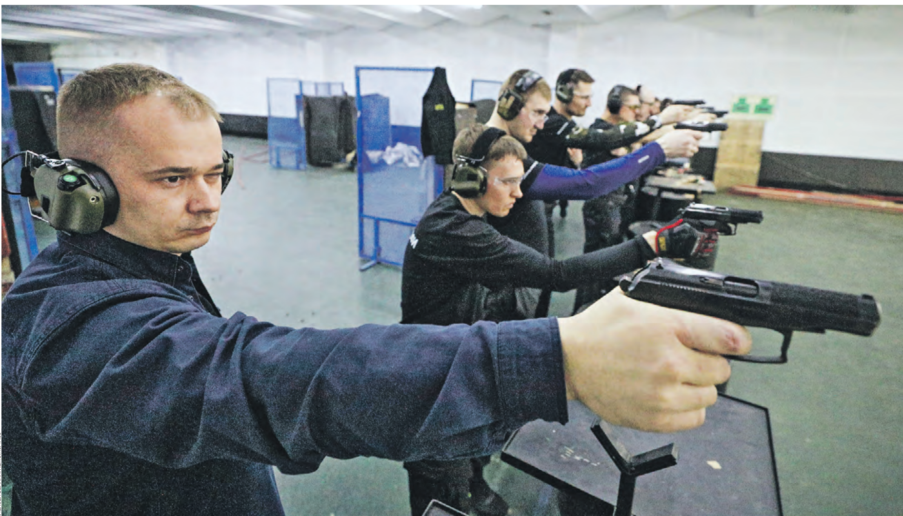
18 апреля. Тренировка сотрудников частного охранного предприятия во время занятий по стрелковой и тактической подготовке в тире. Если поправки в закон будут приняты, то большинство охранных должны будут носить оружие и уметь с ним обращаться