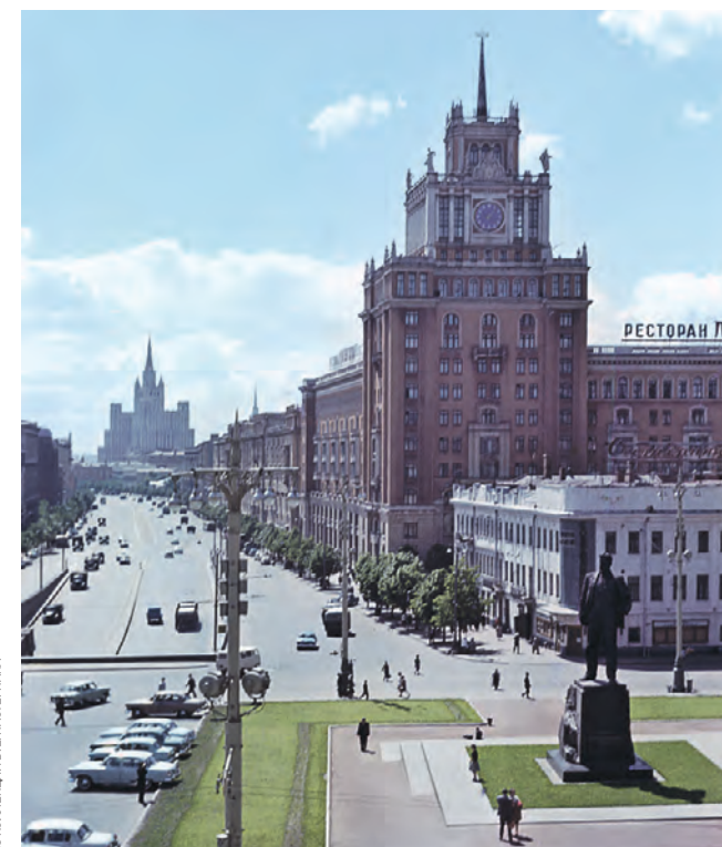
1962 год. Площадь Маяковского уже заметно преобразилась

большое внимание деталям: от выбора места застройки до оформления фасадов. После смерти Сталина Чечулина обвиняли в излишней монументальности и дороговизне проектов. Тем не менее работы этого знакового для Москвы архитектора продолжают восхищать своей красотой и мастерством исполнения.