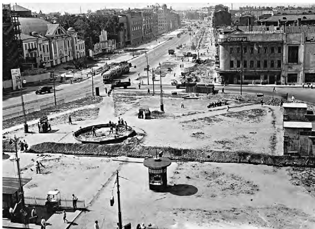
1936 год. Площадь Маяковского (ныне Триумфальная) не раз меняла не только название, но и облик