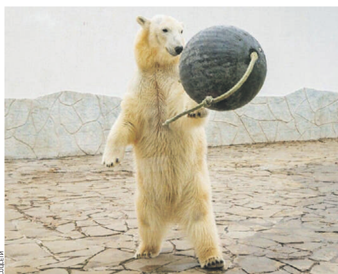
Белая медведица Айка из зоопарка в Ростове-на-Дону. Архивное фото

В рамках программы по сохранению медведей из Ростова-на-Дону в Московский зоопарк (Пресненский район) приехала белая медведица Айка. «ВМ» узнала, что ждет животное в столице.