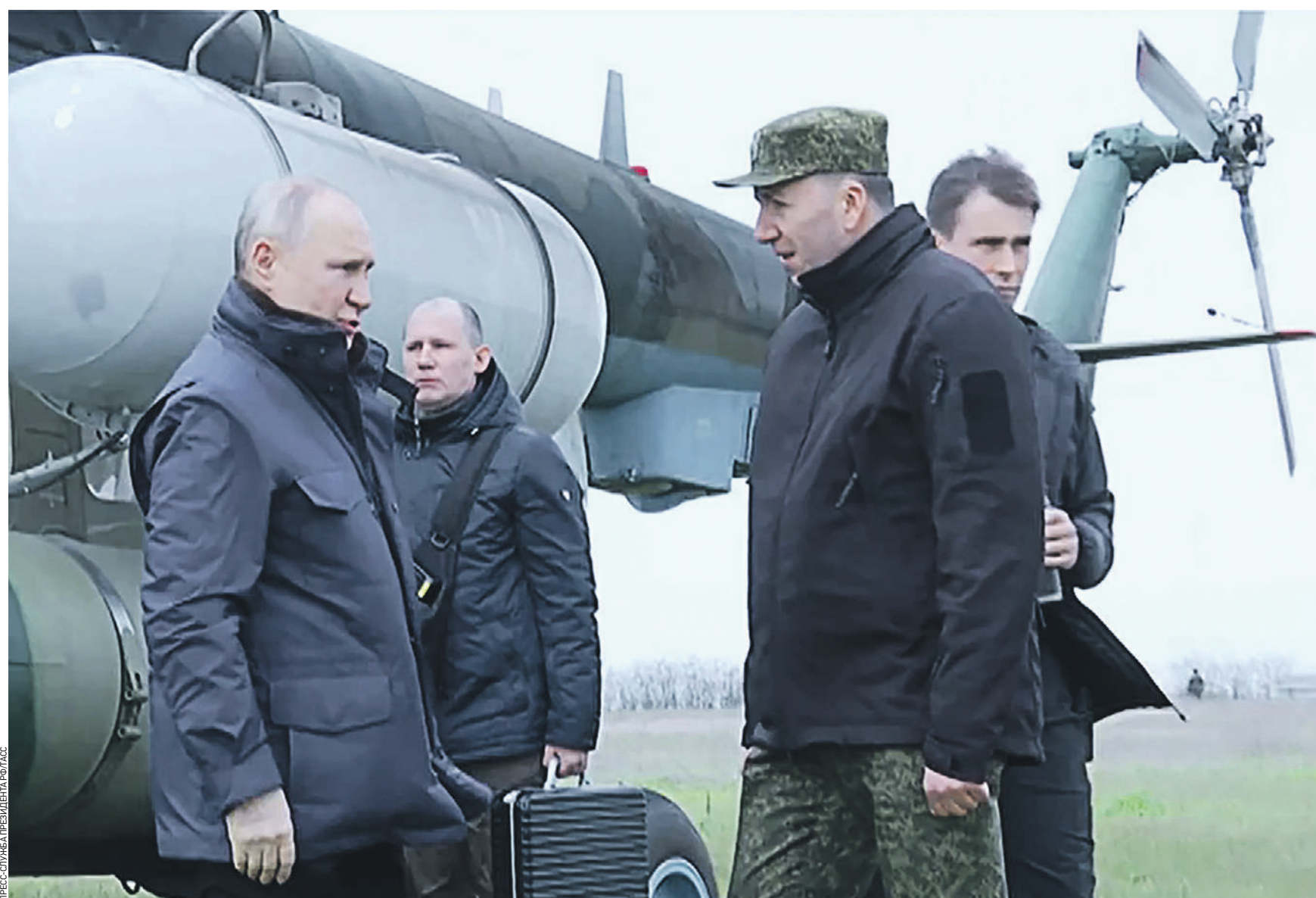
Вчера 08:50 Президент РФ Владимир Путин (слева) и командующий группировкой войск «Днепр» генерал-полковник Олег Макаревич (справа) во время посещения военного штаба на Херсонском направлении. Заслушав доклад, российский лидер посетил штаб национальной гвардии «Восток» в ЛНР

Президент России Владимир Путин впервые посетил военные штабы в Херсонской области и ЛНР