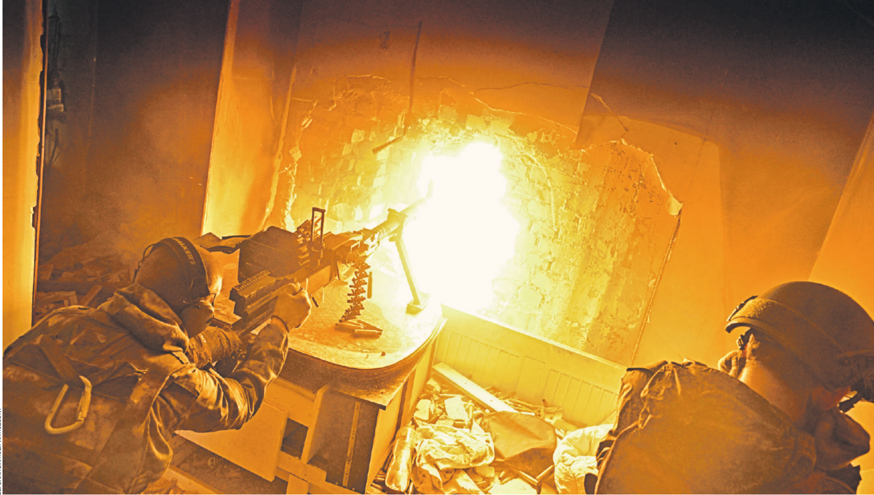
14 апреля 12:38 Бойцы частной военной компании «Вагнер» ведут стрельбу по противнику из станкового крупнокалиберного пулемета ДШК. Сейчас наши военнослужащие продолжают вести ожесточенные бои за Артемовск