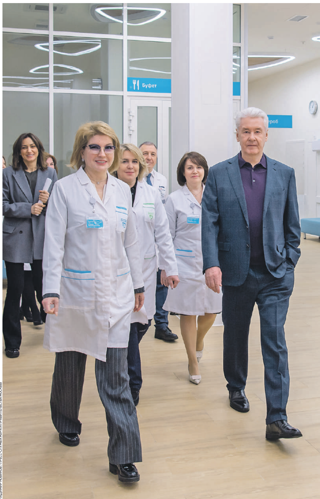
30 января 13:05 Мэр Москвы Сергей Собянин (справа) и главный врач Консультационно-диагностического центра № 6 Наталья Суворова на открытии новой детско-взрослой поликлиники на Дмитровском шоссе