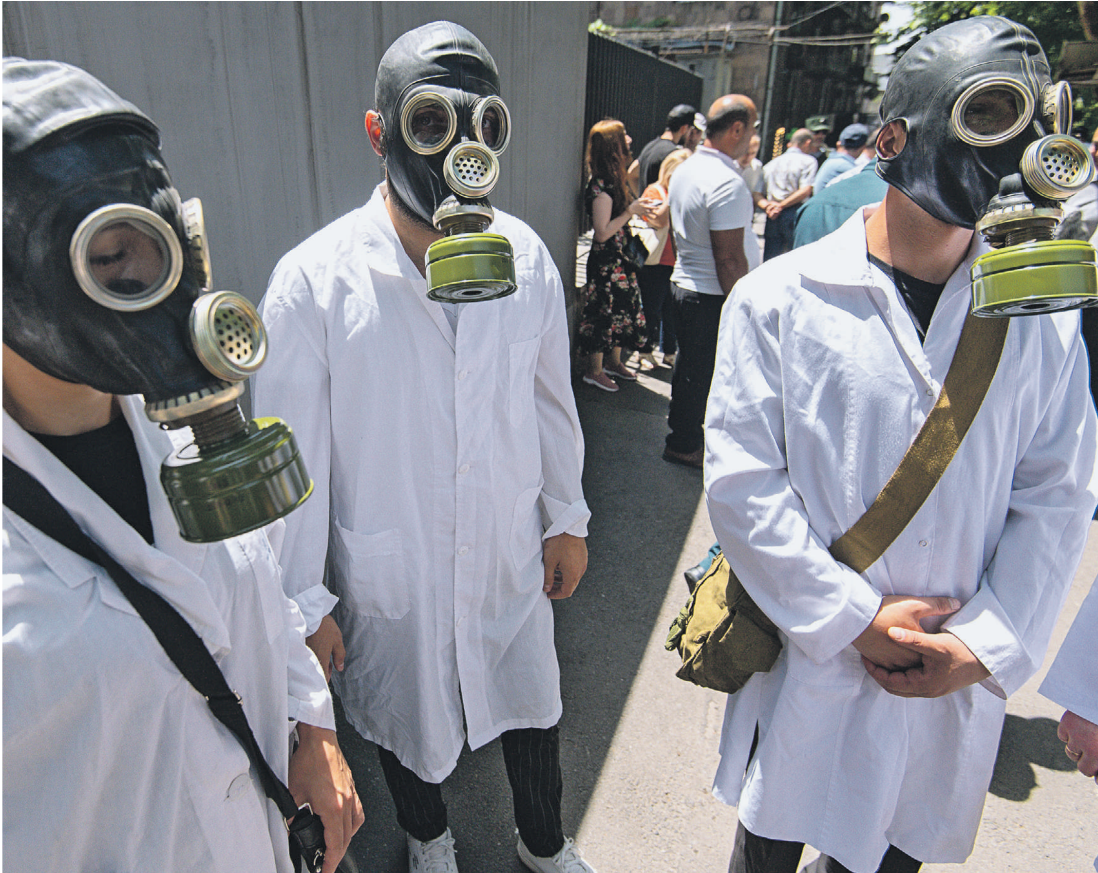
22 июня 2022 года. Участники митинга около Национального центра по контролю и профилактике заболеваний в Ереване протестуют против деятельности американских биологических лабораторий в Армении

Россия — единственная страна, которая способна сейчас противостоять США