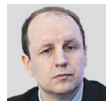
БОГДАН БЕЗПАЛНЫЙ ЧЛЕН СОВЕТА ПРИ ПРЕЗИДЕНТЕ ПО МЕНЬШИНОСТНЫМ ОТНОШЕНИЯМ