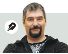
ПАВЕЛ ВОРОБЬЕВ Корреспондент