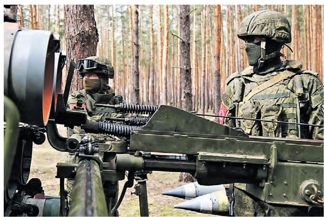
10 апреля 10:48 Боицы расчета реактивных систем залпового огня (РСЗО) «Смерч» готовятся нанести удары по объектам военной инфраструктуры и логистическим узлам ВСУ