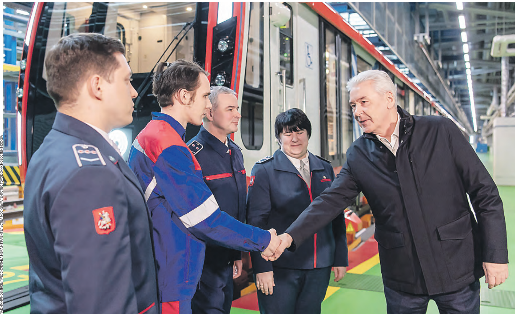
5 апреля 2022 года. Мэр Москвы Сергей Собянин (справа) общается с сотрудниками электродепо «Солнцево». Сейчас в городе строится еще три современных электродепо для обслуживания Большой кольцевой и радиальных линий метрополитена

Также строится электродепо «Южное» — в районе Братеево. По словам мэра, оно будет обслуживать составы Замосворецкой линии.