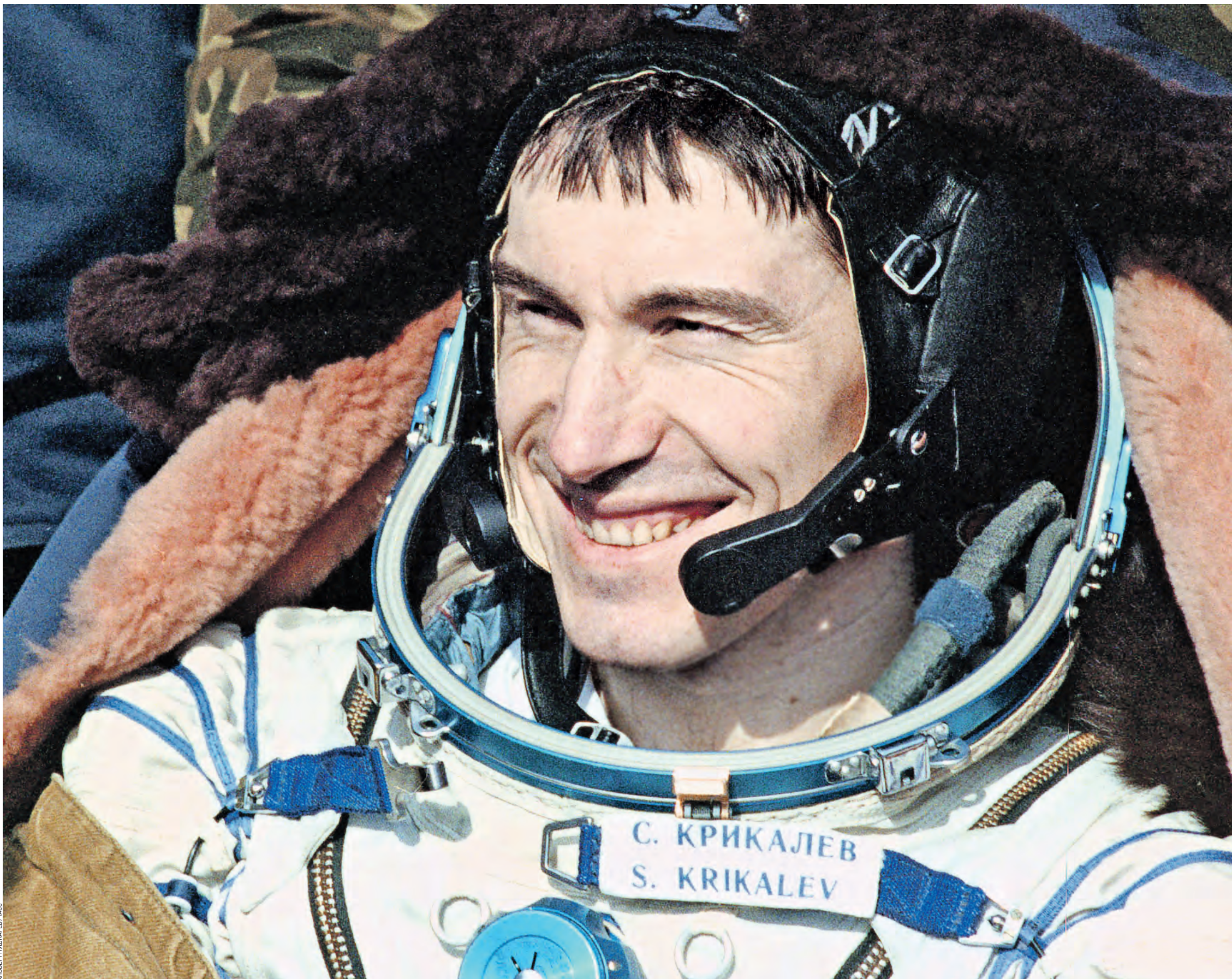
25 марта 1992 года. Космонавт Сергей Крикалев сразу после возвращения на Землю с космического корабля «Союз ТМ-13». Спускаемый аппарат совершил мягкую посадку в районе города Аркалык в Казахстане

Это не хобби, а мой образ жизни. Я начал заниматься пилотажем, будучи студентом. Принимал участие в соревнованиях и по окончании института выполнил норматив мастера спорта по высшему пилотажу, а через несколько лет и норматив мастера спорта международного класса. Сейчас, к сожалению, возможности заниматься пилотажем на соревновательном уровне нет, но я не бросаю свое дело, авиация — это часть моей жизни.