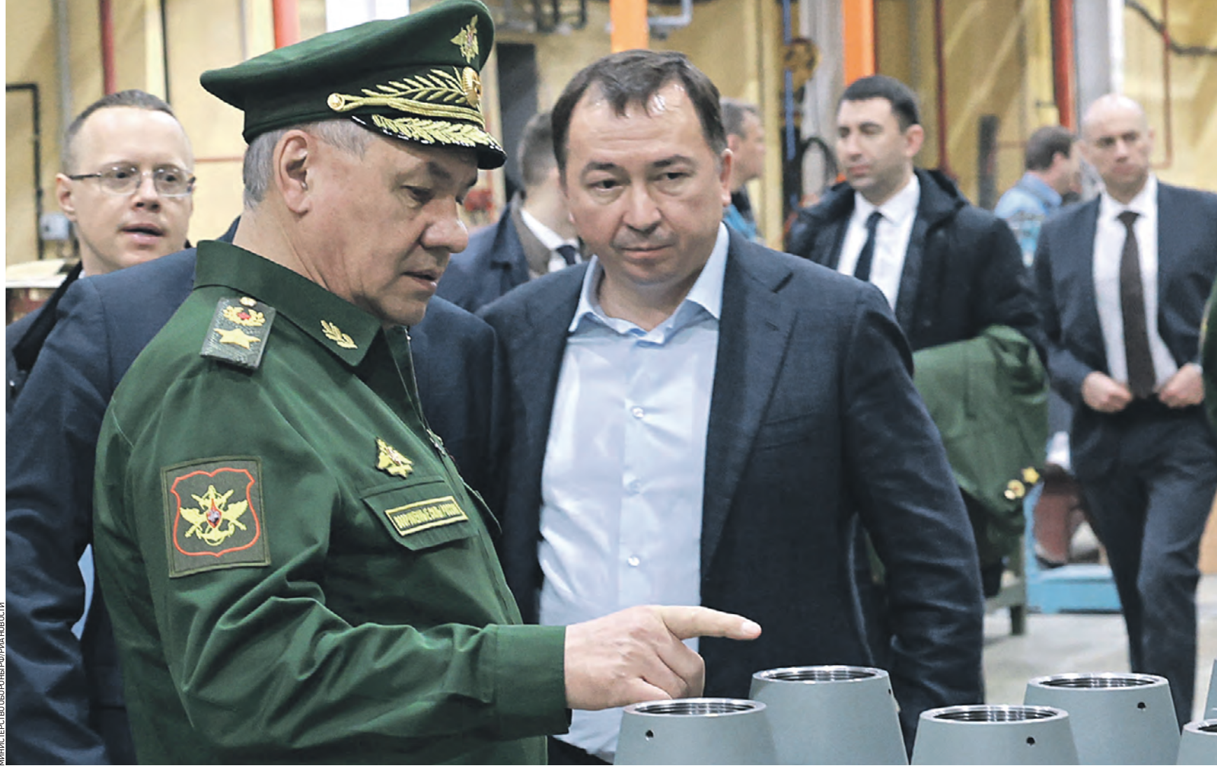
Вчера 12:04 Министр обороны РФ Сергей Шойгу (слева) проверяет ход выполнения гособоронзаказа на предприятиях ОПК в Челябинской и Кировской областях

По его словам, средствами противовоздушной обороны за сутки перехвачено 18 реактивных снарядов систем залпового огня HIMARS