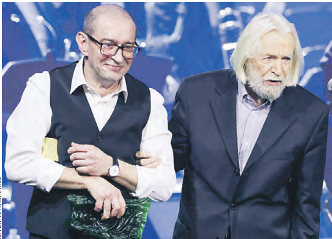
27 марта 20:40 Художественный руководитель МХТ имени А.П. Чехова Константин Хабенский (слева) и народный артист РСФСР Станислав Любшин на вручении новой премии, которую учредили в театре

— В дальнейшем в этой номинации премии будут получать не только люди, связанные с культурой, но и достигшие вершин в спорте, медицине и науке, — отметил Константин Хабенский. Номинантов награждали памятными орденами в форме чайки — символа МХТ имени Чехова и копией горельефа