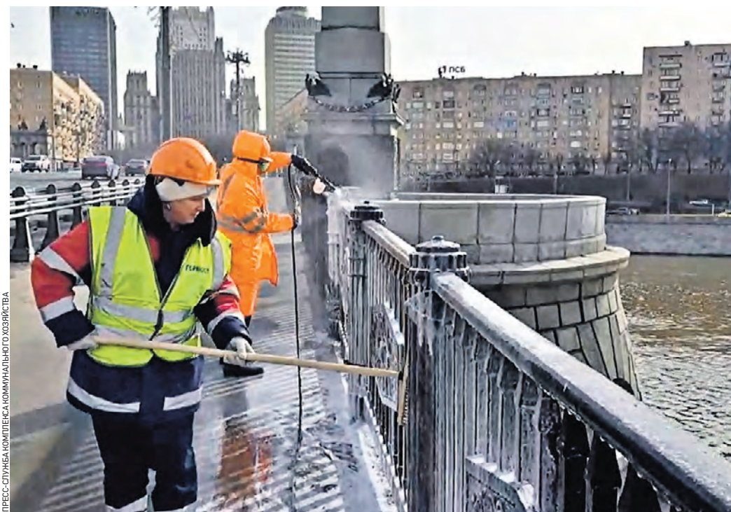
Вчера 11:17 Специалисты Комплекса городского хозяйства Москвы промывают ограждения Бородинского моста