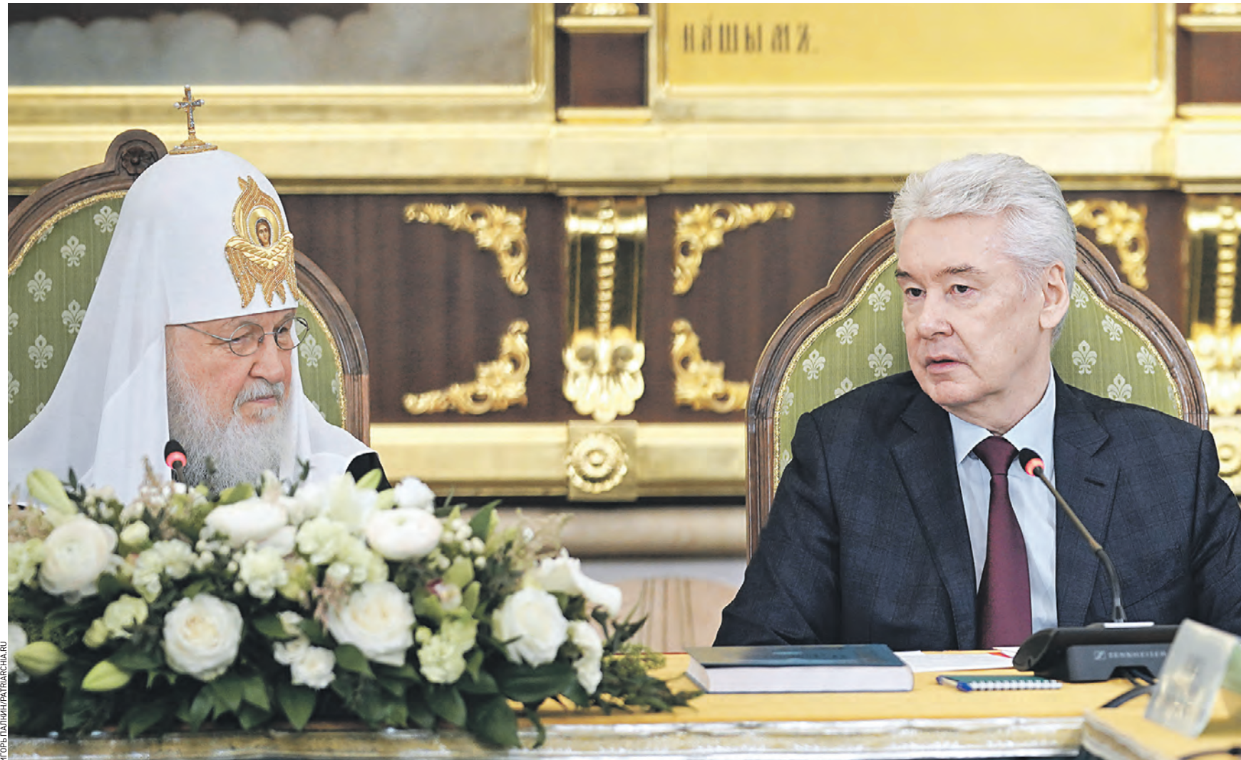
Вчера 11:39 Патриарх Московский и всея Руси Кирилл и мэр Москвы Сергей Собянин (справа) провели вместе с государственными и общественными деятелями заседание совета по изданию «Православной энциклопедии». В ближайшее время свет увидят еще два тома книги

Сегодня тома «Православной энциклопедии» стоят в церковных библиотеках по всему миру. Большое внимание распространению издания уделяют и столичные власти, всецело поддерживая важный проект.