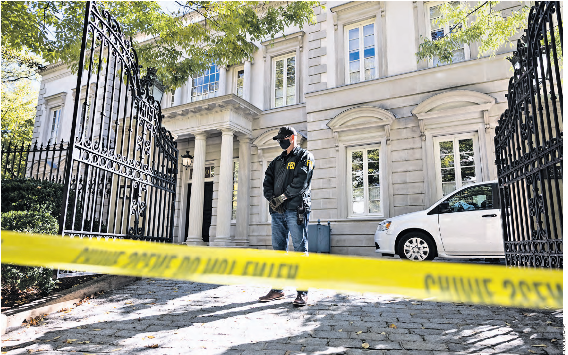
19 октября 2021 года. ФБР проводит обыск в доме Олега Дерипаски в Вашингтоне. Российских олигархов начали активно «раскулачивать» на Западе еще до начала спецоперации на Украине. Сейчас процесс продолжается