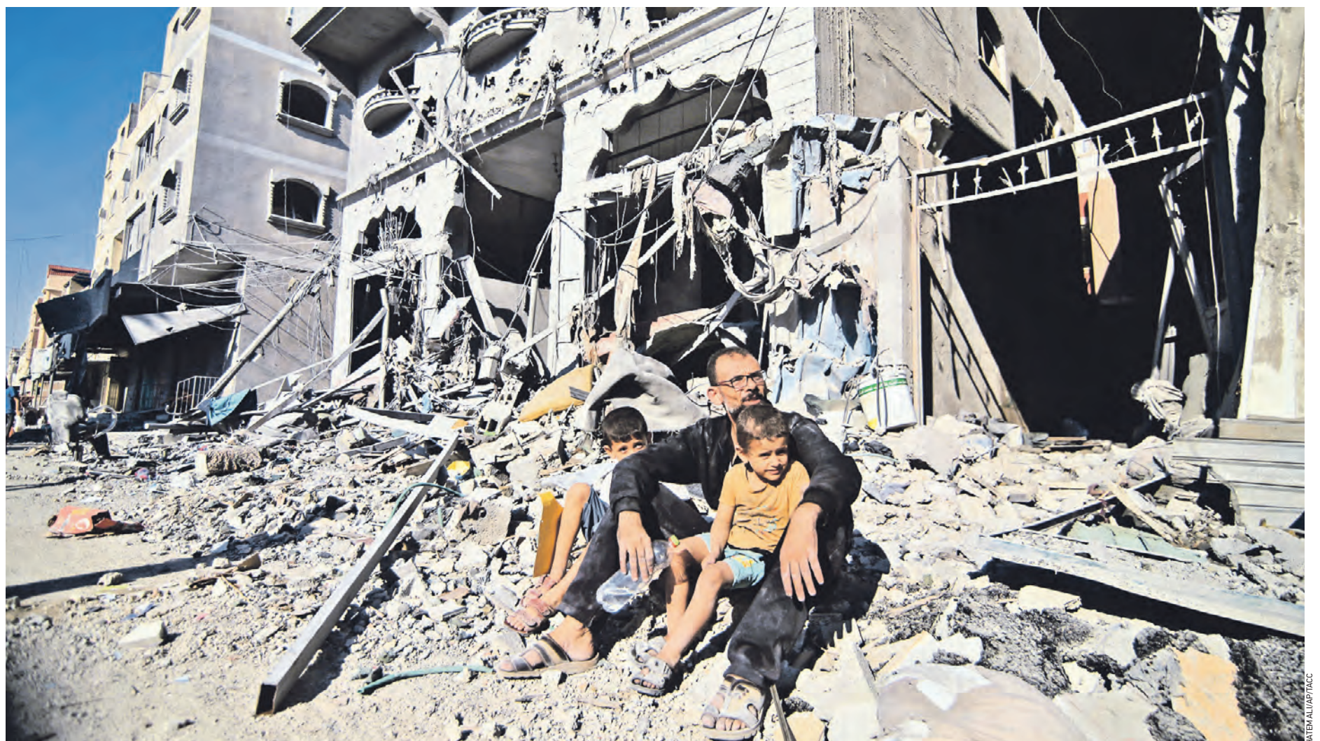
12 октября. Палестинцы сидят возле разрушенного после израильских авиаударов в лагере беженцев Рафях дома на юге сектора Газа. Сейчас на этой территории вновь вспыхнул конфликт, который ранее был заморожен

Лиза Интересно, а когда Польша захочет вернуть свой исторический кусочек Западной Украины? Сейчас вроде самое время.