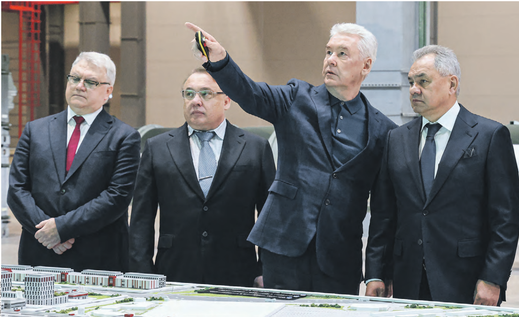
17 октября. На фото (слева направо): председатель правления концерна «Алмаз-Антей» Ян Новиков, гендиректор концерна «Крост» Алексей Добашин, мэр Москвы Сергей Собянин и министр обороны РФ Сергей Шойгу на церемонии открытия нового производственного корпуса на территории индустриального парка «Руднево»

— Москва активно занимается развитием промышленности, в том числе поддержкой оборонно-промышленного комплекса страны, — отметил мэр. — На площадках Москвы сосредоточено большое количество высокотехнологичных предприятий, которые год от года активно развиваются. Мэр подчеркнул, что для создания дополнительных мощностей одного из самых высокотехнологичных и лучших предприятий оборонно-промышленного комплекса страны — «Алмаз-Антей» — построен уникальный завод площадью около 100 тысяч квадратных метров. — Он оснащен всеми необходимыми инженерными сетями, оборудованием для того, чтобы здесь проходил монтаж и дальнейшее производство очень нужной для страны про-