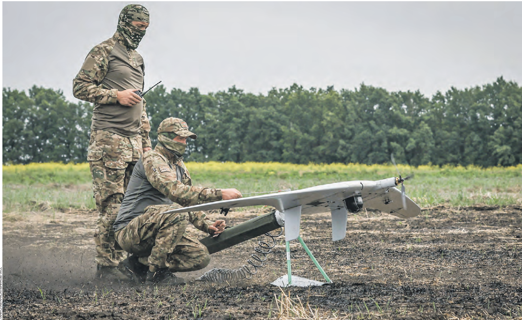
8 июня 2023 года. Бойцы Центрального военного округа ВС РФ отправляют разведывательный беспилотный летательный аппарат «Суперкам» на Краснолиманском направлении в зоне проведения спецоперации

Кроме того, по информации ведомства, Киев в ходе попыток наступления потерял за