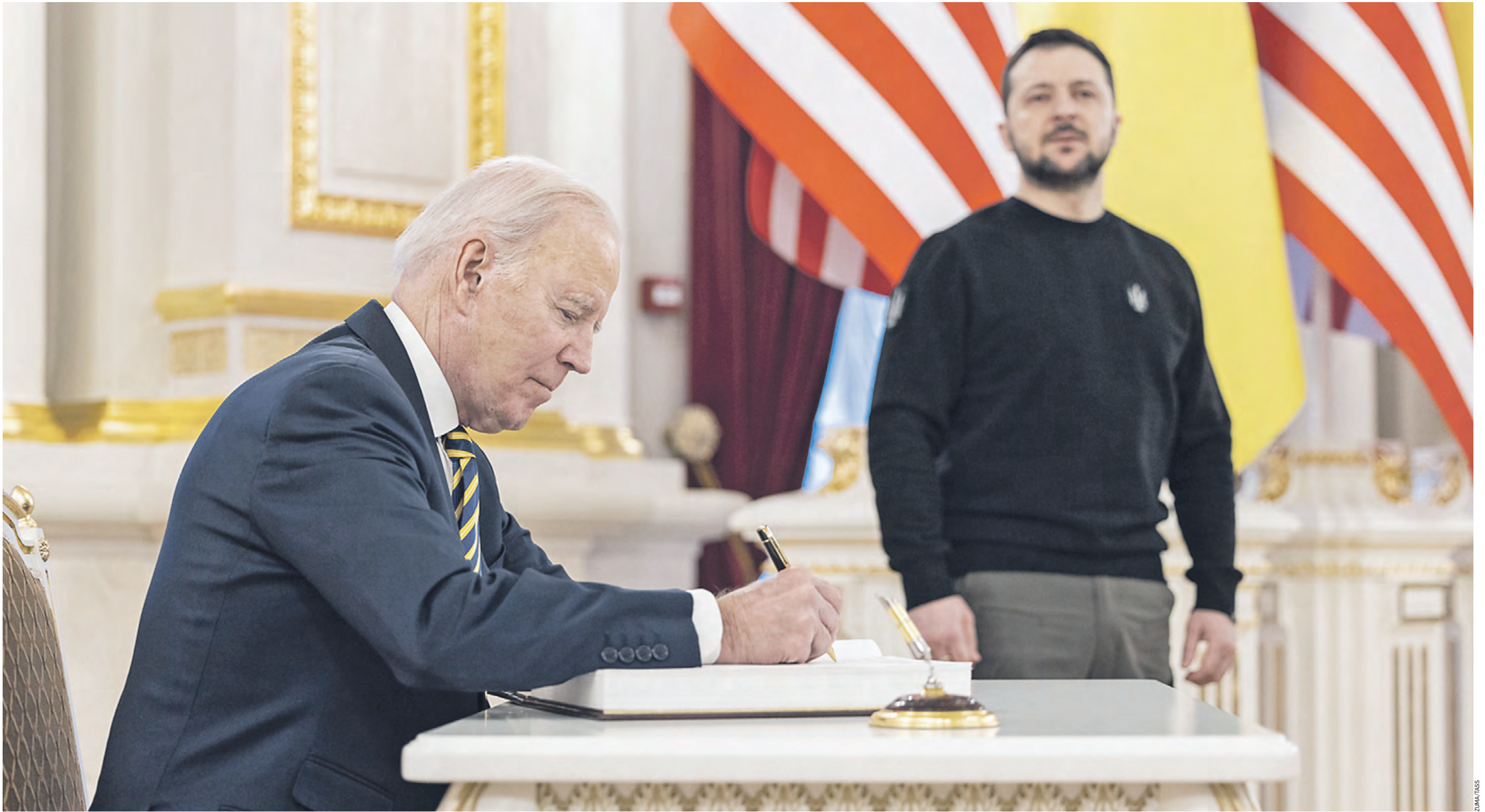
20 февраля 2023 года. Президент США Джо Байден подписывает гостевую книгу во время встречи с президентом Украины Владимиром Зеленским в Киеве

Дипломат Александр Бобров о чтении между строк