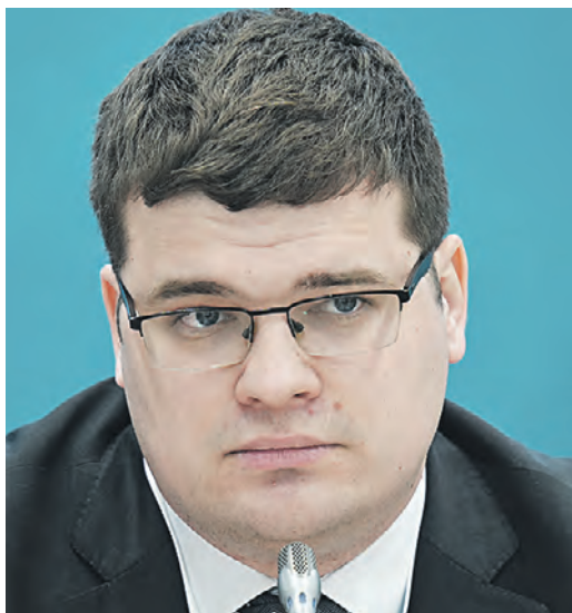
Александр Бобров / РИА Новости

Директор Института международных отношений и управления МГИМО МИД России Александр Бобров (на фото) преподает основы государственного и делового протокола начинающим дипломатам. Он умеет «в дипломатию» настолько, что, даже критикуя, заставляет собеседника чувствовать себя польщенным. Этому учит классическая школа государственного протокола, которую заканчивали прославленные советские дипломаты и политики. Все они, кроме общепринятого дипломатического набора правил, владеют невербальным языком символов, которые влияют на политику и общественное сознание порой не меньше, чем официальные заявления. Вместе с Александром Кирилловичем мы рассмотрели последние яркие политические эпизоды и попытались найти и расшифровать скрытые смыслы, заложенные в них.