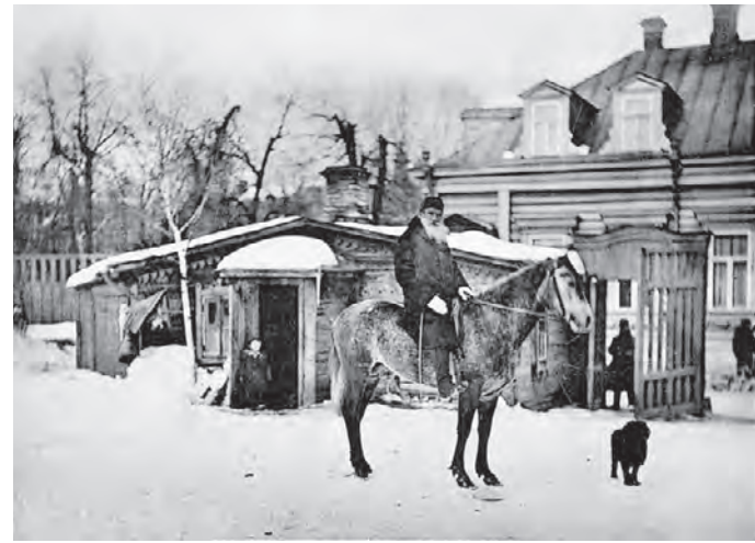
1898 год. Русский писатель Лев Николаевич Толстой во дворе своего дома в Хамовниках

1 июля 1937 года В наши дни большой многопрофильный стационар «Коммунарка» строится в поселении Сосенское Новомосковского округа. Недавно там открыли детскую больницу. — Несколько лет назад на этой территории был пу-