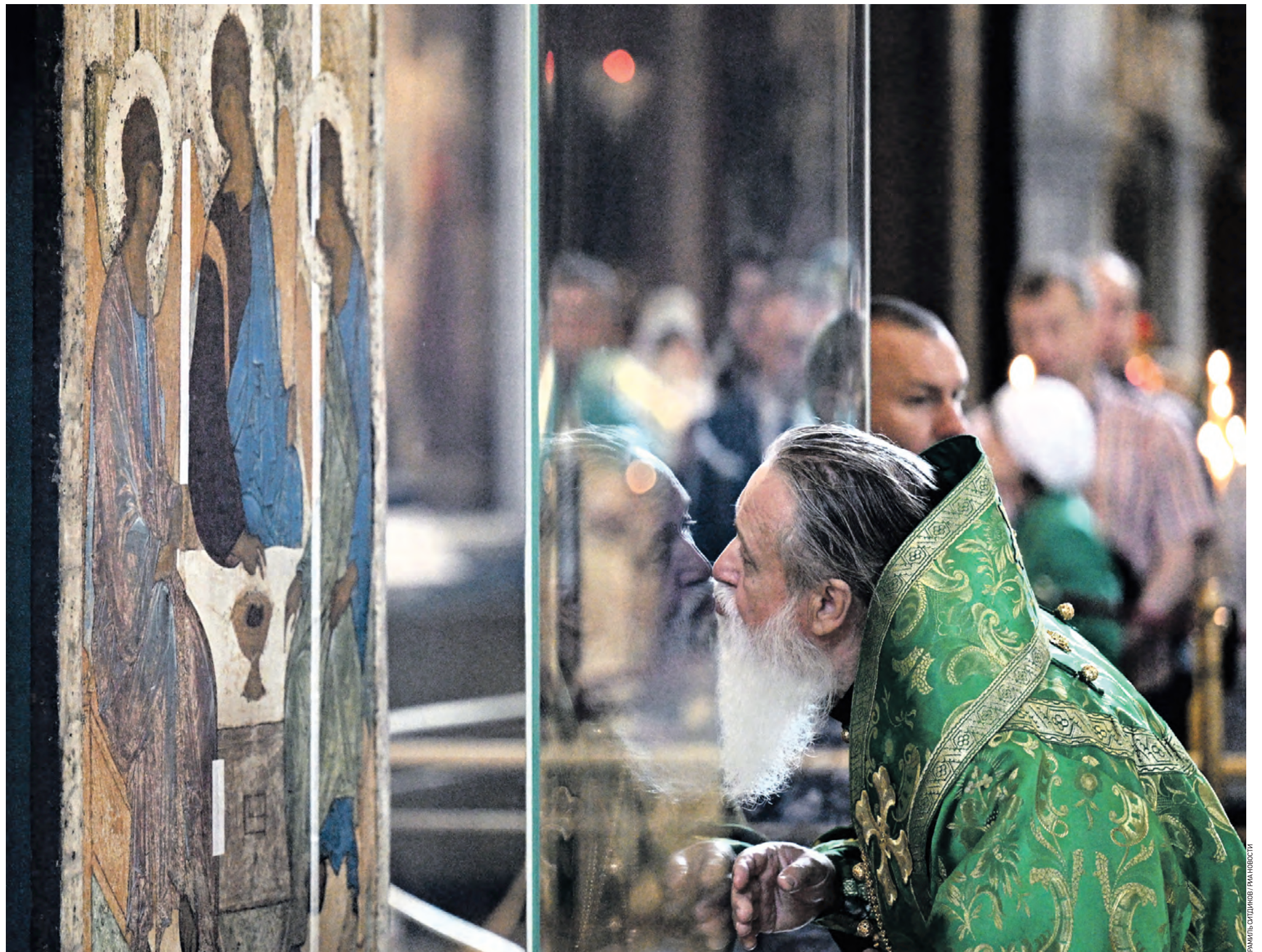
Вчера 09:10 Священнослужитель целует икону «Троица», выставленную вчера для поклонения в храме Христа Спасителя. Образ, созданный великим иконописцем Андреем Рублевым в XV веке, ныне указом президента РФ Владимира Путина передан Русской православной церкви

Кроме своей древности, «Троица» ценна прежде всего как предмет высокого искусства. О знаменитом произведении Андрея Рублева написано много. Статьи, монографии продолжают выходить и сегодня. Но знаменитый философ и искусствовед Павел Флоренский выразился, вероятно, точнее многих. Он писал: «Нас умиляет, поражает и почти оживает в произведении Рублева вовсе не сюжет, не число «три», не чаша за столом и не крила, а внезапно сдернутая пред нами завеса ноуменального (недоступного для чувственного восприятия). — «ВМ») мира, и нам, в порядке эстетическом, важно не то, какими средствами достиг иконописец этой обнаженности ноуменального и были ли в чьих-либо других руках те же краски и те же приемы, а то, что он воистину передал нам узренное им откровение. Среди мятущихся обстоятельств времени, среди раздоров, междоусобных распри, всеобщего одичания и татарских набегов, среди этого глубокого безмолвия, разлившего Русь, открылся духовному взору бесконечный, невозмутимый, нерушимый мир, «свышний мир» горнего мира. Вражде и ненависти, царящим в долгием, проти-