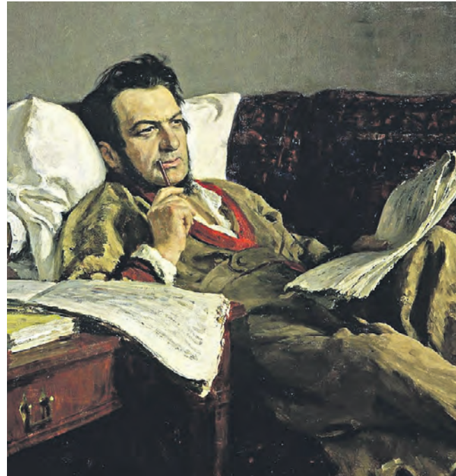
Фрагмент картины «М. И. Глинка за сочинением оперы «Руслан и Людмила» кисти Ильи Репина (1887)

«Вечерняя Москва» продолжает рассказывать о событиях, которые происходили в этот день и повлияли на ход истории.