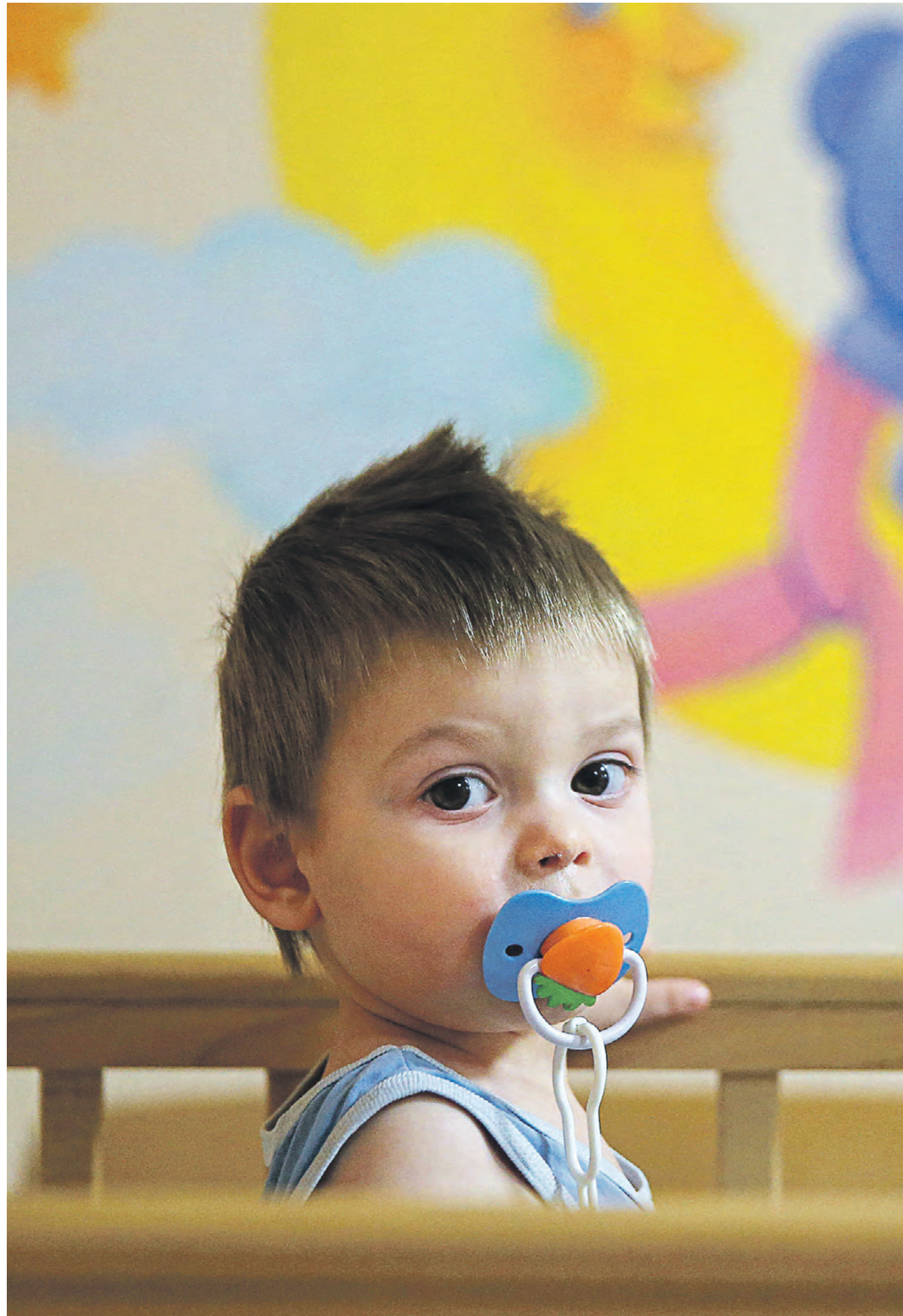
10 ноября 2016 года. Мальчик в Центре содействия семейному воспитанию «Центральный». Эта организация круглосуточно принимает детей до четырех лет, оставшихся без родительской опеки. Здесь также открыта школа приемных родителей