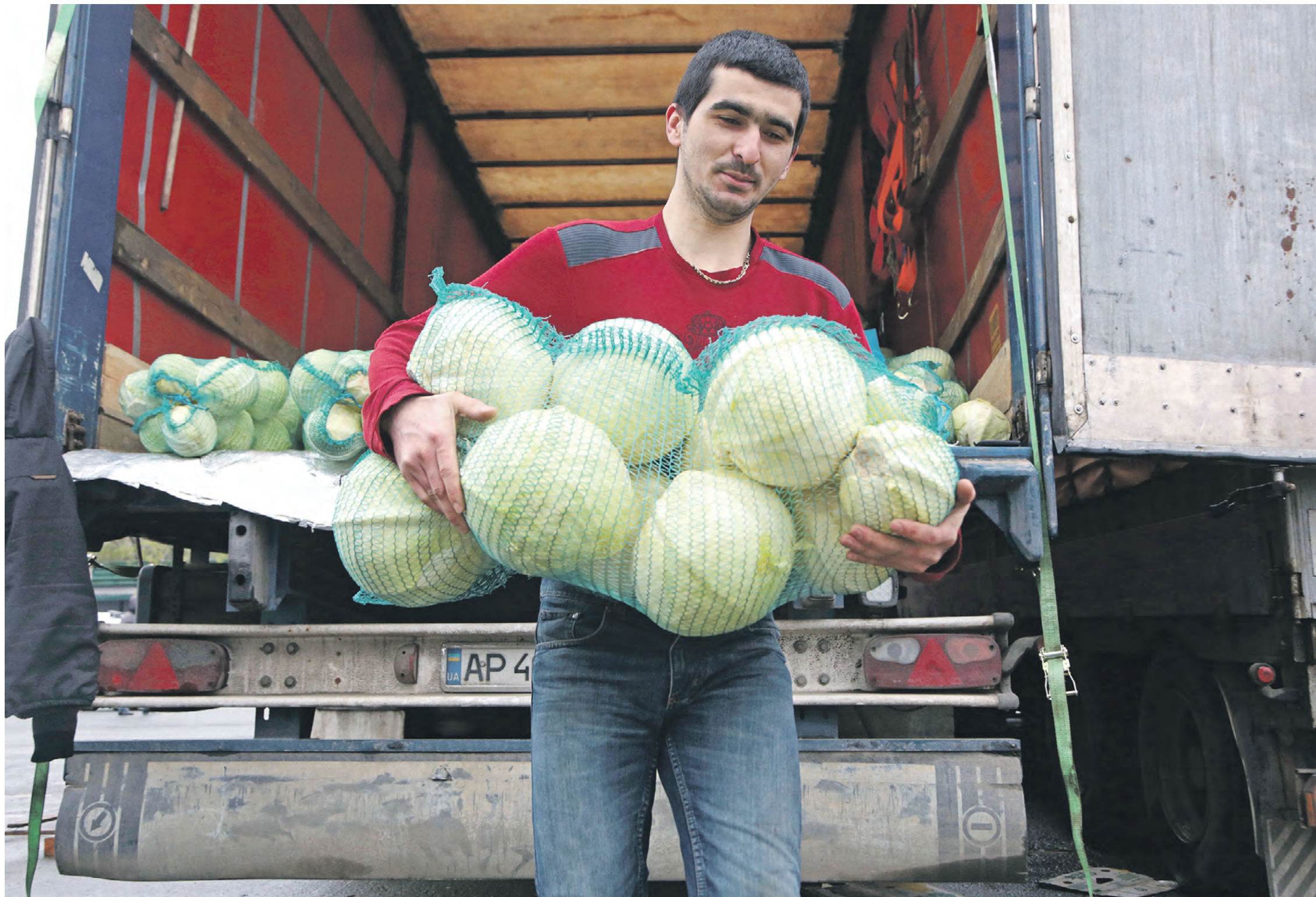
19 апреля 2022 года. Продавец выгружает напущу, привезенную из Херсонской и Запорожской областей, на симферопольском рынке «Привоз». Поставки сельхозпродукции с освобожденных территорий в Крым идут вовсю