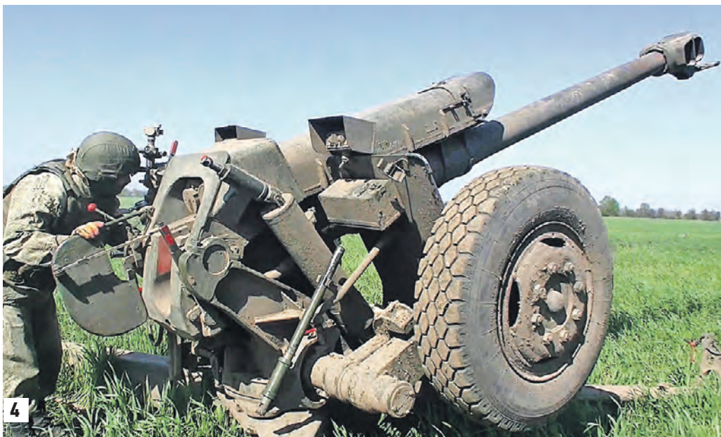
РИСУНОК АЛЕКСАНДРА ГОЛУБОВИЧА