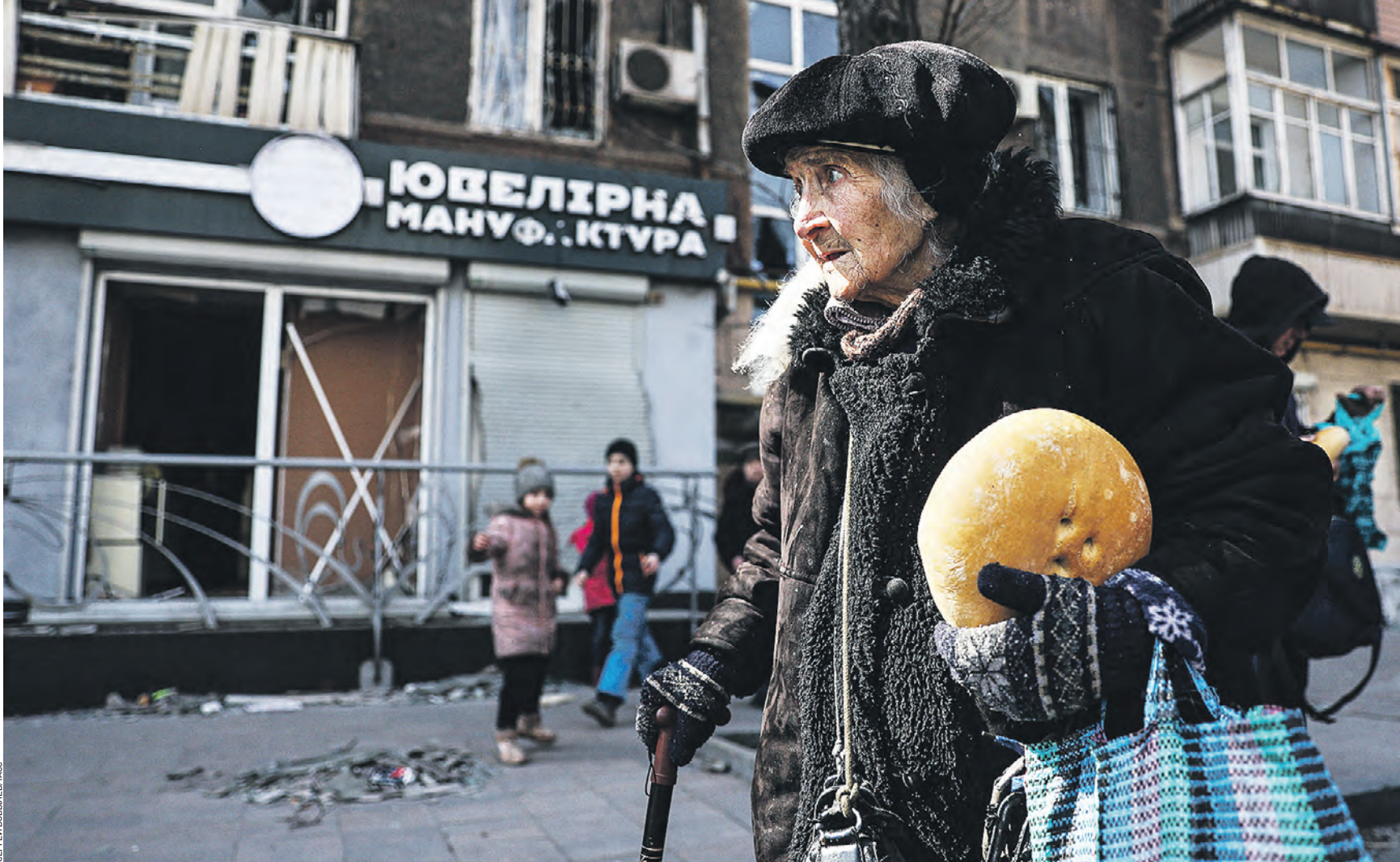
3 апреля 11:06 Российские волонтеры раздали гуманитарную помощь мирным жителям Мариуполя, где сейчас идут бои. Люди получили продукты питания, одежду, средства гигиены и другие необходимые вещи

По его словам, точными ударами уничтожены в том числе восемь командных пунктов и узлов связи, радиолокатор подсвета и наведения ЗРК С-300, пусковая установка комплекса «Точка-У». Ракетными ударами поражены шесть складов боеприпасов и два склада горюче-смазочных материалов. Подверглись обстрелу и ликвидированы 85 опорных пунктов и районов сосредоточения боевой техники ВСУ. Генерал-майор Конашенков отметил, что российские ПВО сббили в воздухе четыре украинских беспилотника в районах населенных пунктов Чернобаевка, Индустриальная, Гурты и Нижняя Кринка. — В районе города Очакова Николаевской области российские военные обнаружили и уничтожили центр подготовки украинских сил специальных операций, — рассказал Игорь Конашенков. — Удар по месту подготовки был нанесен высокоточным