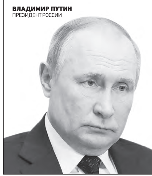
ВЛАДИМИР ПУТИН ПРЕЗИДЕНТ РОССИИ