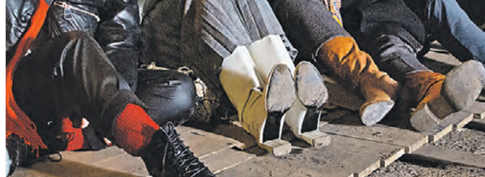
Кадр из четырехсерийного фильма «Под прикрытием», который сочетает криминальный жанр с юмором

— Да, тут у меня другое амплуа. В «Великолепной пятёрке» я оперативник Бубнов, семьянин и юморист. А в новом проекте Пятого канала я — бандит! Пригласив меня в этот проект, мне дали возможность развиваться, что так важно для актера. Тут мы использовали возможность играть остро, это все же криминальная комедия, а юмор нам так сейчас нужен в жизни. Они помогают, позволяют дышать полной грудью.