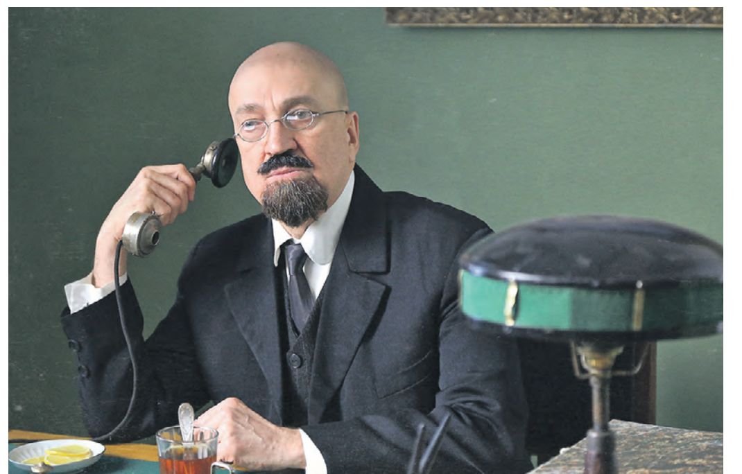
Многосерийный фильм «Одесса» перенесет своего зрителя в опасные, но интересные послереволюционные годы

По словам режиссера Андрея Щербинина, замысел сериала подразумевает создание «многоуровневого» проекта: — Это в первую очередь жанровое кино. Мы взяли на себя смелость обвить себя продолжателями традиций советского кинематографа, по которому сами очень соскучились. «Бумбараш», «Зеленый фургон», «Красные дяволята» — это прекрасные фильмы, остро сюжетные, захватывающие, с искрометным юмором, но не только развлекав-