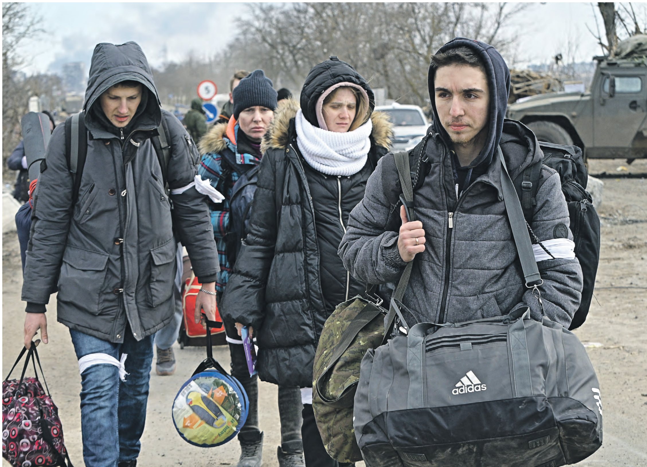
16 марта 2022 года. Мариуполь. Зеленый коридор. Жители с трудом выбрались из города, часть которого сейчас удерживают нацисты, прикрываясь горожанами как живым щитом