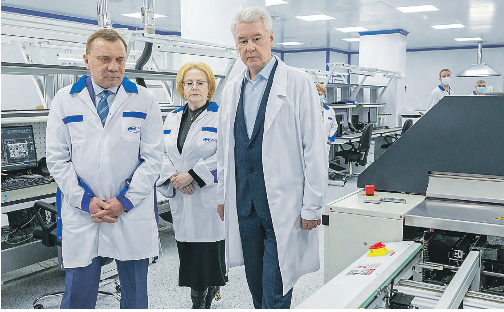
19 марта 2021 года. Мэр Москвы Сергей Собянин (справа) вместе с руководителем Федерального медико-биологического агентства Вероникой Скворцовой и заместителем председателя правительства России Юрием Борисовым осмотрел новую лабораторию технопарка «Модуль»

Расчетаться за второй квартал первого года аренды земли, предоставленной под строительство, можно будет с беспроцентной отсрочкой в шесть месяцев. Более того, город готов отдать участки под проектирование, строительство или реконструкцию объектов промышленно-производственного назначения всего за 1 рубль в год. До 9,5 процента снижается ставка при предоставлении расщепки за землю, которую застройщик берет в аренду. Такая же ставка зафиксирована для платежей за изменение вида разрешенного использования участка. Банковские гарантии прописаны и для собственников земли. Кроме того, инвесторы полу-