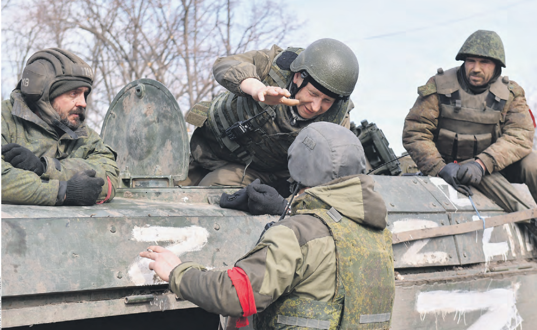
20 марта 2022 года. Бойцы народной милиции, только что освободившие шахтерский поселок Степное, приветствуют земляка из соседнего подразделения. Бронемашина дончан украшена литерой Z — символами спецоперации по денацификации Украины

Противник теряет технику По словам Игоря Конашенкова, за прошедшие сутки оперативно-тактической и армейской авиацией поражены 137 военных объектов Украины. Среди них: 101 место скопления боевой техники, восемь складов артиллерийского вооружения и боеприпасов, шесть пунктов управления узлов связи, две установки реактивных систем залпового огня, а также один зенитно-ракетный комплекс. — Российскими средствами противовоздушной обороны сбиты в воздухе 14 украин-