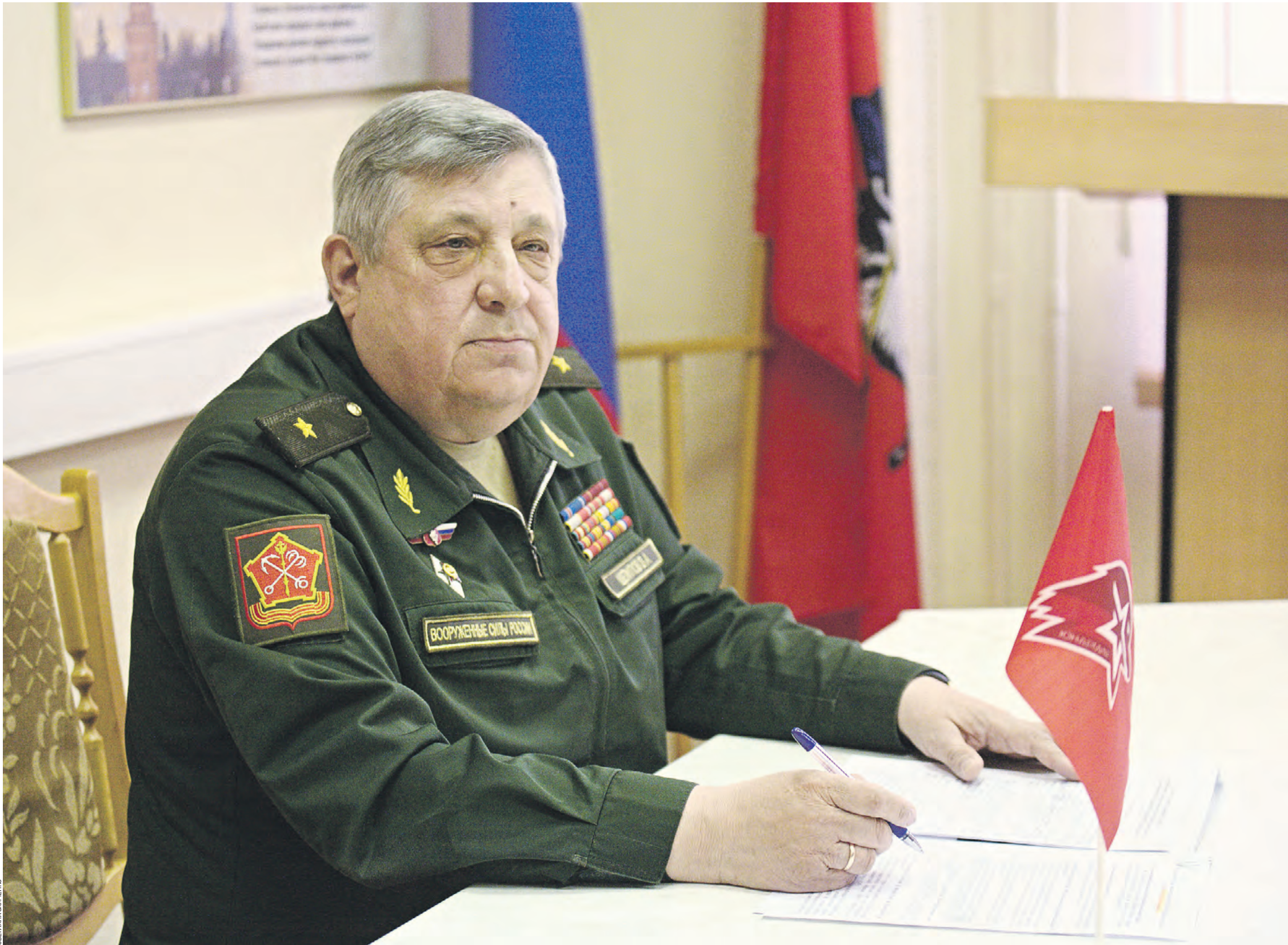
18 февраля 11:23 Военный комиссар города Москвы генерал-майор Виктор Щепилов в своем кабинете готовится к личному приему призывников, впервые встающих на учет

Военный комиссар Москвы Виктор Щепилов: Солдат должен уметь хорошо думать