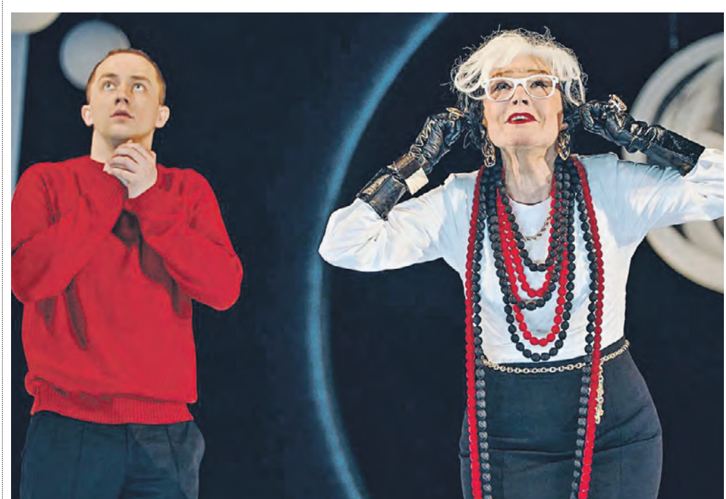
9 февраля 19:23 Артисты Вера Алентова и Артем Ешкин в спектакле «Мадам Рубинштейн» на сцене Московского драматического театра имени А. С. Пушкина

Вчера народная артистка России Вера Алентова отпраздновала 80-летие. День рождения актрисы отметили на сцене Московского драматического театра имени А. С. Пушкина.