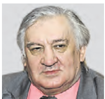
ВИКТОР КРОВОПУСКОВ ЧЕТЫРЕХКРАТНЫЙ ОЛИМПИЙСКИЙ ЧЕМПИОН ПО ФЕХТОВАНИЮ

Нынешняя Олимпиада, напомним, прошла без зрителей на трибунах. Организаторы недополучили огромные суммы от продажи билетов. Значит, нужно бороться за высокие телевизионные рейтинги. Один из способов их повысить — организовать скандал. Как это сделать? Можно, например, найти в анализах Камиллы Валиевой запрещенное вещество, но до поры до времени не обнародовать эту информацию. А когда Олимпиада начнется, рассказать об этом. Что, собственно, и произошло. Вообще скандал ради повышения собственного рейтинга и давления на соперника — это обычное явление. Взять, например, историю с Украиной, куда якобы готовилось российское вторжение. Сегодня борьба за влияние происходит главным образом в медиафере. И мне очень жаль, что страдает спорт. По идее, ту же Камилу Валиеву — если нашли запрещенное вещество — вообще не должны были допускать до соревнований. Ведь триметазидин, как известно, у нее был обнаружен еще в декабре, на национальном турнире. Но скандал формируется и развивается по своим законам. Я много лет участвовал в Олимпиадах и чемпионатах мира и скажу, спорт всегда был частью большой политики. Именно поэтому и в подготовку спор-