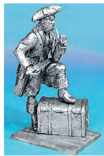
Фигурка пирата Синяя борода высотой семь сантиметров