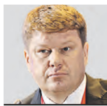
ДМИТРИЙ ГУБЕРНИЕВ СПОРТИВНЫЙ КОММЕНТАТОР

Нашим на Олимпиаде не проще и не сложнее, чем и всем остальным. Мы, с моей точки зрения, недобираем золота, у нас там обилие четвертых-пятых мест, но в целом можем быть довольны тем, как ребята и девчонки подошли к этой Олимпиаде. Я не чувствую давления со стороны Международного олимпийского комитета. Даже по поводу Валиевой высказывания единичных чиновников этой организации погоды не сделали — ее допустили до соревнований, она выступала и имела шансы выиграть медаль. Извела ее. Сейчас надо обращать внимание не на высказывания чужих чиновников, а на то, что происходит у нас в стране. На то, что мы можем и должны делать сами: за-