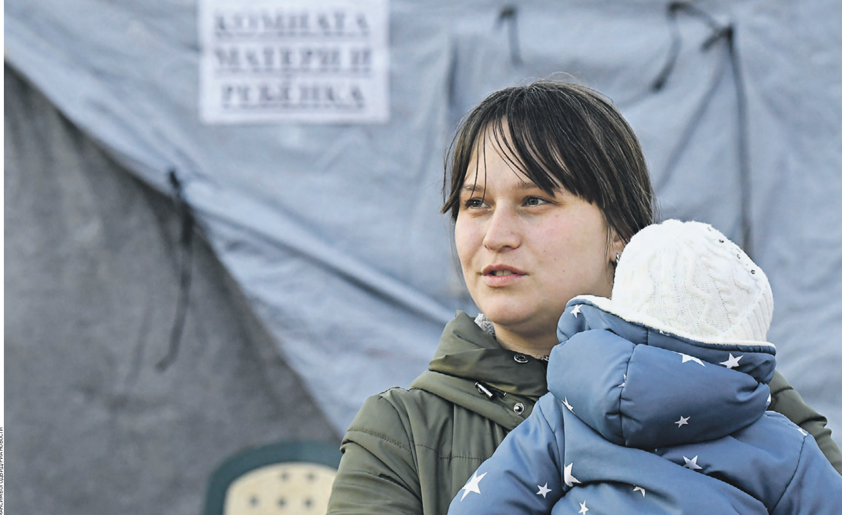
21 февраля 2022 года. Женщина с ребенком возле пункта обогрева для беженцев из Донбасса у железнодорожного вокзала в Таганроге. Местные оперативно налаживают быт для тех, кто был вынужден покинуть свои дома и с детьми на руках ехать за помощью в Россию

Также стало известно, что 21 февраля в районе населенного пункта Митякинская Ростовской области на участке государственной границы