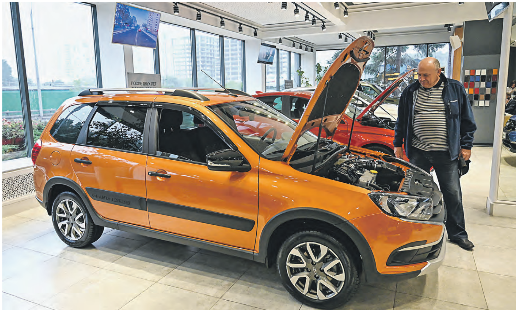
16 сентября 2022 года. Покупатель в дилерском центре в Строгине рассматривает российский автомобиль. Доля продаж отечественных моделей — как новых, так и классических — растет. А вот продажи практически всех иномарок снижаются: часть компаний ушла с рынка, часть не готова представить новые интересные модели