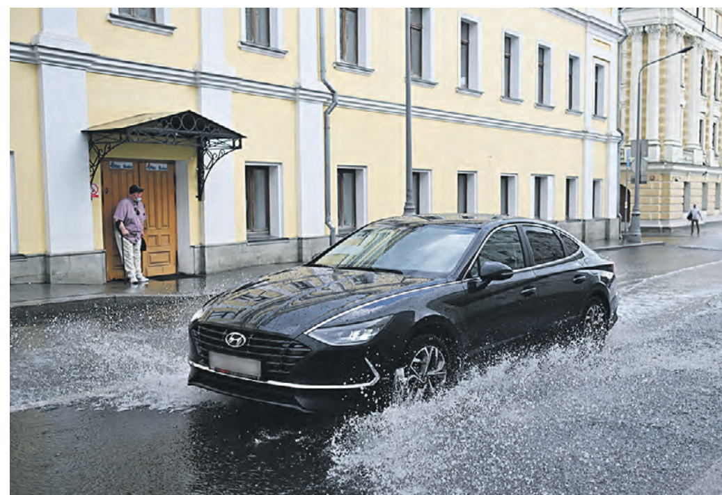
27 июля 2022 года. Корейский автомобиль едет по улице Ленинке в Москве. В центре столицы машины угоняют реже, потому что каждый квадратный метр просматривается видеонаблюдением

Эксперты проанализировали статистику угонов автомобилей в России с начала 2022 года.