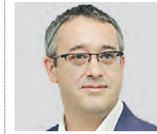
АЛЕКСЕЙ ШАПОШНИКОВ ПРЕДСЕДАТЕЛЬ МОСКОВСКОЙ ГОРОДСКОЙ ДУМЫ

Газете «Вечерняя Москва» исполнилось 99 лет. И как вам?