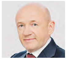
ВЛАДИМИР ПЛАТОНОВ ПРЕЗИДЕНТ МОСКОВСКОЙ ТОРГОВО-ПРОМЫШЛЕННОЙ ПАЛАТЫ

От имени депутатов Московской городской думы и от себя лично поздравляю коллектив «Вечерней Москвы» с днем рождения издания! «Вечерка» — одна из самых авторитетных и уважаемых городских газет, надежный источник новостей для москвичей и наш давний информационный партнер. Ваше издание уверенно развивается, расширяет форматы общения с читателями, выходит в онлайн и покоряет новые профессиональные вершины. На протяжении почти века «Вечерка» остается одной из самых массовых и любимых столичных газет.