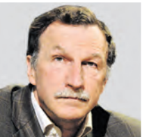
ГЕОРГИЙ БОБТ ОБОЗРЕВАТЕЛЬ

Мнение колумнистов может не совпадать с точкой зрения редакции «Вечерней Москвы»