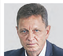
ВЛАДИМИР СИПАГИН ДЕПУТАТ ГОСУДАРСТВЕННОЙ ДУМЫ РОССИИ

ления фирм-однодневок и обналаживания через них денежных средств уже неактуальна для нашей страны. С введением электронных систем контроля Федеральной налоговой службы и всеобщей автоматизации платежей резко сократилось число таких подставных компаний. Государство сейчас имеет все необходимое, чтобы успешно выявлять и противодействовать подставным фирмам и тем, кто их создает. К тому же в Уголовном кодексе уже прописаны случаи, когда человек может быть освобожден от ответственности за налоговые или экономические преступления. И зачем вводить еще один механизм, мне неясно. К тому же в случае принятия таких поправок у некоторых граждан станет меньше причин отказываться от предложения стать таким подставным директором. Ведь кто-то будет уверен, что это стало легче избежать наказания.