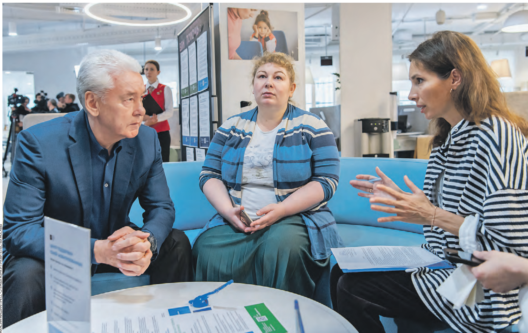
Вчера 13:16 Мэр Москвы Сергей Собянин пообщался с родственниками мобилизованных москвичей. В Центре поддержки на улице Сергея Радонезского ответил на все волнующие вопросы и оказал помощь и женам, и детям, и родителям призванных мужчин

Вчера мэр Москвы Сергей Собянин посетил Центр поддержки семей мобилизованных. Жены, дети и родители получают социальную, юридическую и психологическую помощь.