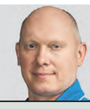
ОЛЕГ АРТЕМЬЕВ ГЕРОЙ РОССИИ, КОМАНДИР ТРАНСПОРТНОГО ПИЛОТИРУЕМОГО КОРАБЛЯ «СОЮЗ МС-21»