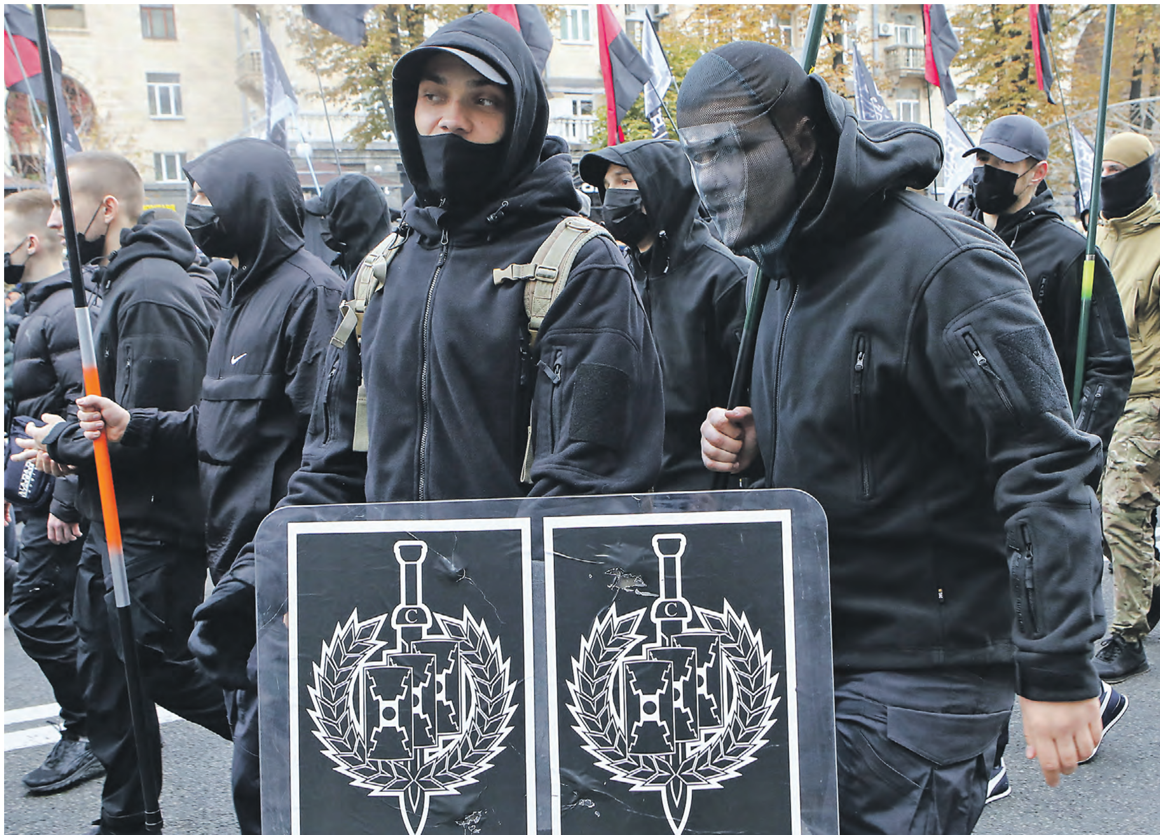
14 октября 2021 года. Марш в День защитников и защитниц Украины в Киеве. Участники шествия несут щиты с символикой неонацистской организации «Центурия»

Первая точка зрения рассматривает нацизм либо как результат сугубо экономического развития, то есть как результат экспансионистских тенденций германского империализма, либо как политическое явление, то есть захват государственной власти, исповедуемой нацизм. Иначе говоря, победа нацизма объясняется как результат обмана и подавления большинства