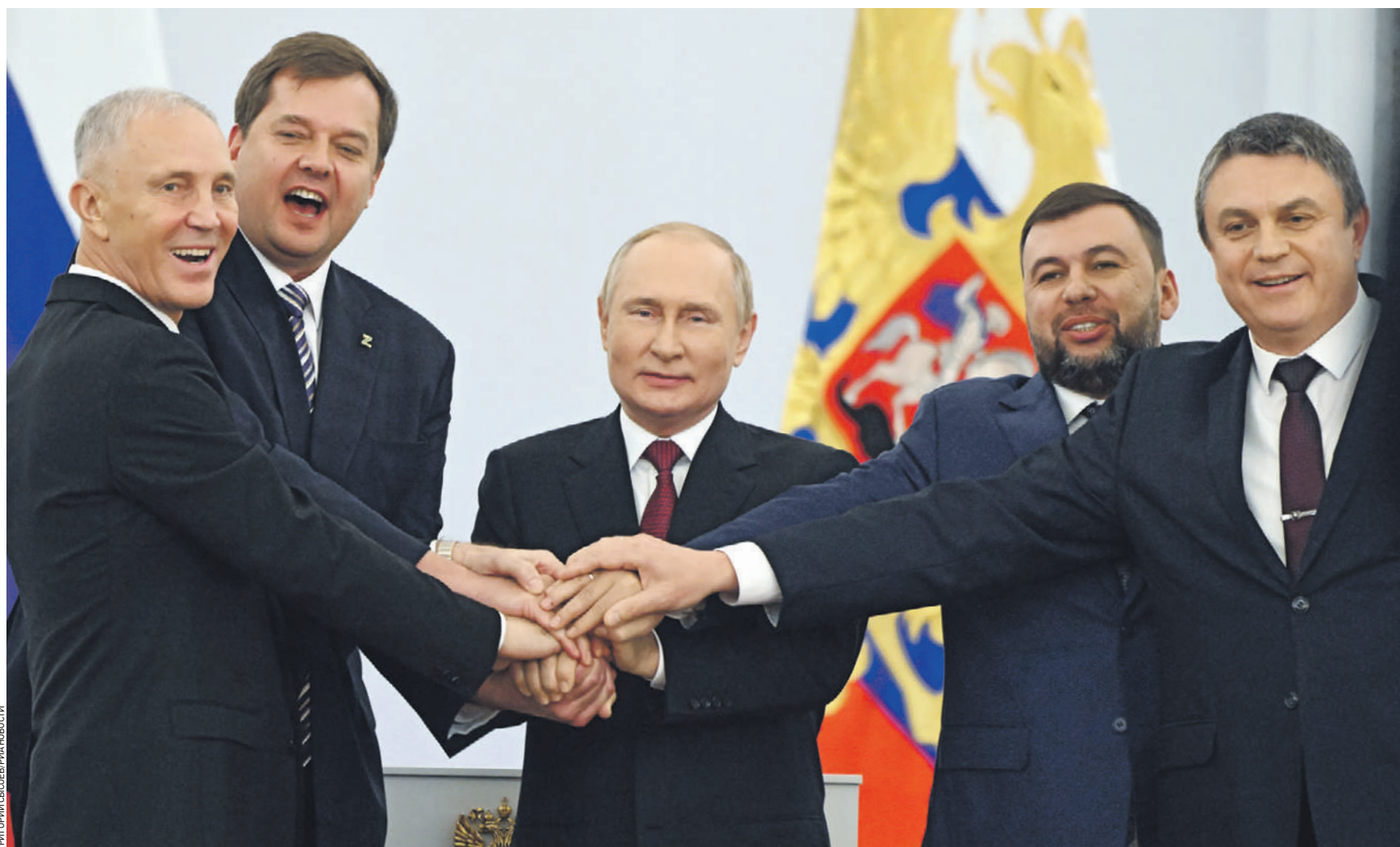
30 сентября 16:44 Глава администрации Херсонской области Владимир Сальдо, глава администрации Запорожской области Евгений Балицкий, президент РФ Владимир Путин, глава ДНР Денис Пушилин, глава ЛНР Леонид Пасечник (слева направо) после подписания договоров о вхождении регионов в состав России

Договоры о присоединении новых регионов признали конституционными