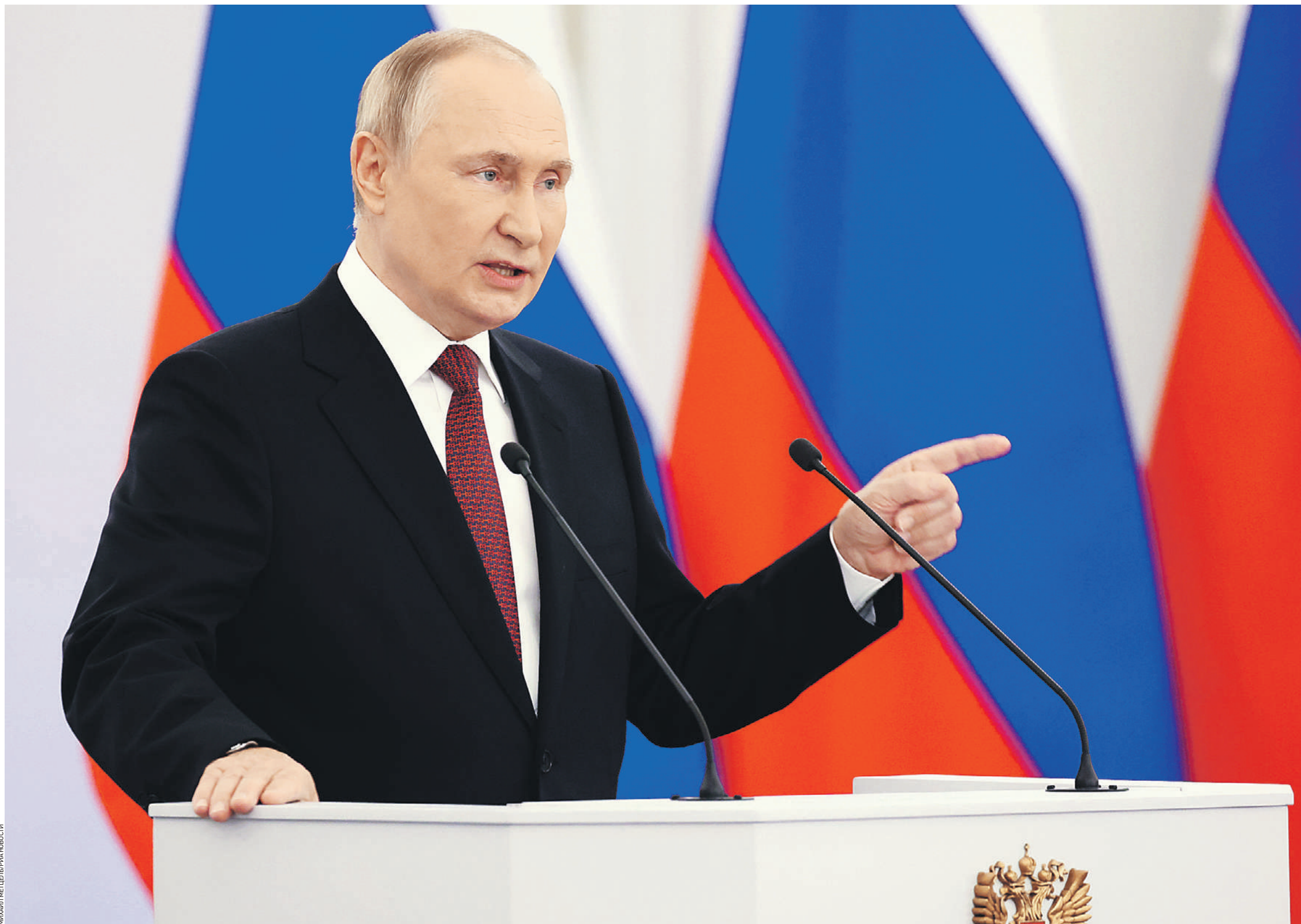
30 сентября 15:46 Президент РФ Владимир Путин выступает в Георгиевском зале Большого Кремлевского дворца на церемонии подписания договоров о вхождении в состав России ДНР, ЛНР, Запорожской и Херсонской областей

Россия сделала исторический шаг, защитив попавших в беду братьев