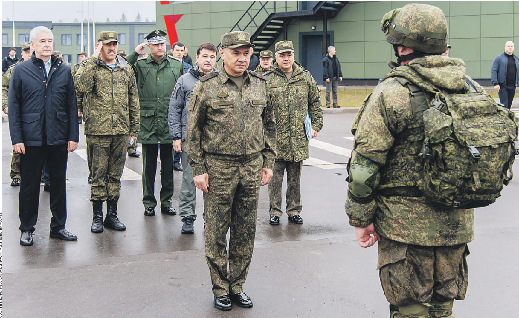
1 октября 12:15 Министр обороны Российской Федерации Сергей Шойгу (в центре), мэр Москвы Сергей Собянин (слева) и губернатор Подмосковья Андрей Воробьев (четвертый слева) во время посещения временного пункта размещения мобилизованных