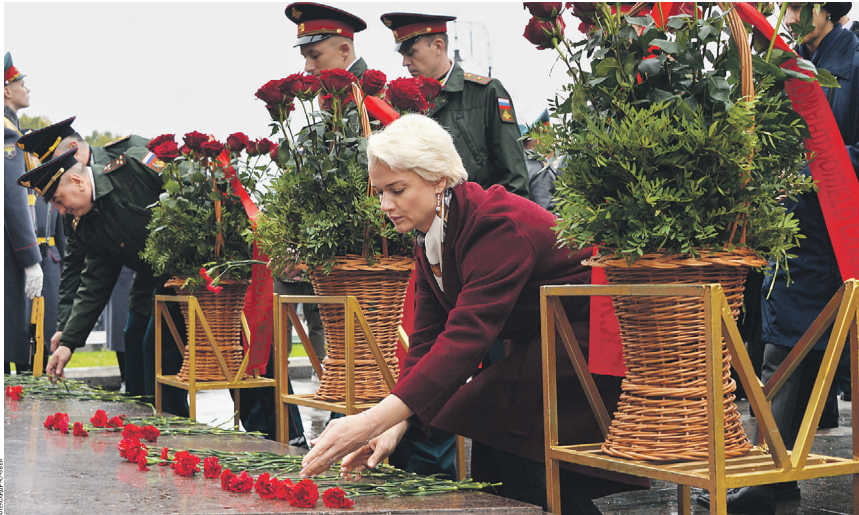
1 октября 12:18 Олимпийская чемпионка, заместитель начальника спортивного клуба ЦСКА Светлана Хоркина возложила цветы к Могиле Неизвестного Солдата