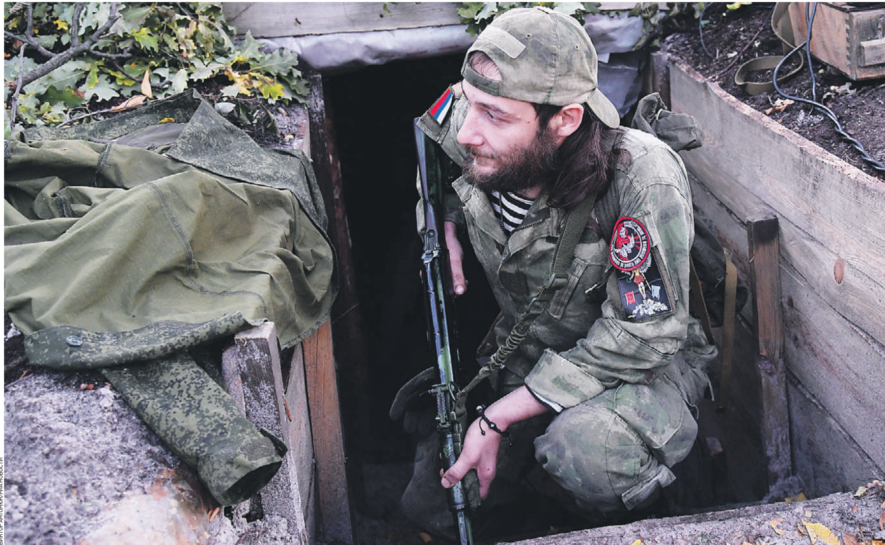
19 сентября 2022 года. Боец подразделения «Барс-16» («Чубань») на передовой на окраине Красного Лимана в ДНР. Сейчас на этом направлении ситуация остается сложной: киевские боевики предпринимают попытки отбить территорию

— С сегодняшнего дня нанесено по инфраструктуре города огромное количество ударов. В первую очередь крупному обстрелу подверглась те-