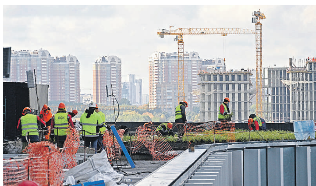
27 сентября 2022 года. На крыше образовательного кластера «Ломоносов» ведутся работы по ее озеленению. Здесь будет благоустроенная площадка для отдыха

Кластер «Ломоносов» — флагман проекта инновационного центра МГУ. В десятиэтажном здании расположатся офисы высокотехнологичных компаний, лаборатории, центры сертификации и испытаний, цифровых аддитивных технологий и центры НИОКР для осуществления научно-технологической и внедренческой деятельности. Также там будут созданы большие выставочные и презентационные пространства.