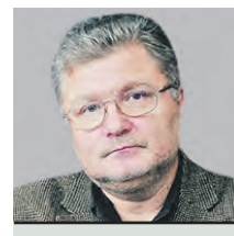
ЮРИЙ ПОЛЯКОВ ПИСАТЕЛЬ