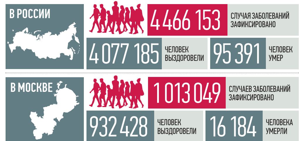
По данным стопкоронавирус.рф и mos.ru на 19:00 22 марта

Повторные заражения коронавирусом чаще всего встречаются у пожилых людей, заявил вчера глава лаборатории геномной инженерии МФТИ Павел Волчков. Происходит это по причине старения иммунной системы вместе со всем организмом. Чтобы защитить возрастных граждан, им необходимо вакцинироваться.