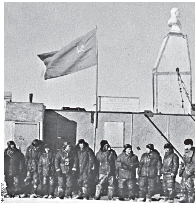
1 февраля 1975 года. Полярники на советской антарктической станции «Полюс недоступности»

«Вечерняя Москва» продолжает вспоминать события, которые происходили в этот день и повлияли на ход истории.