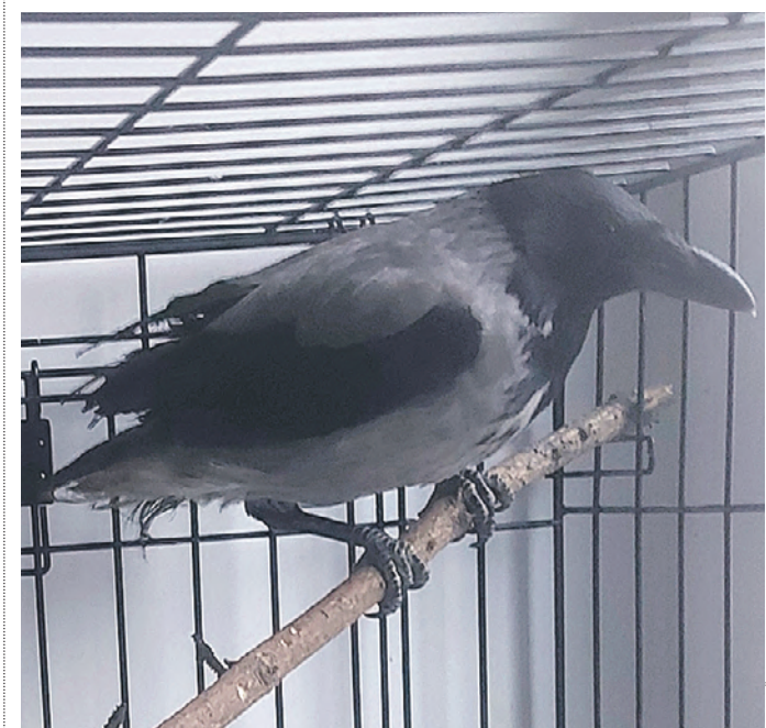
Вчера 13:31 Ворона по кличке Худи восстанавливается после трудной уличной жизни