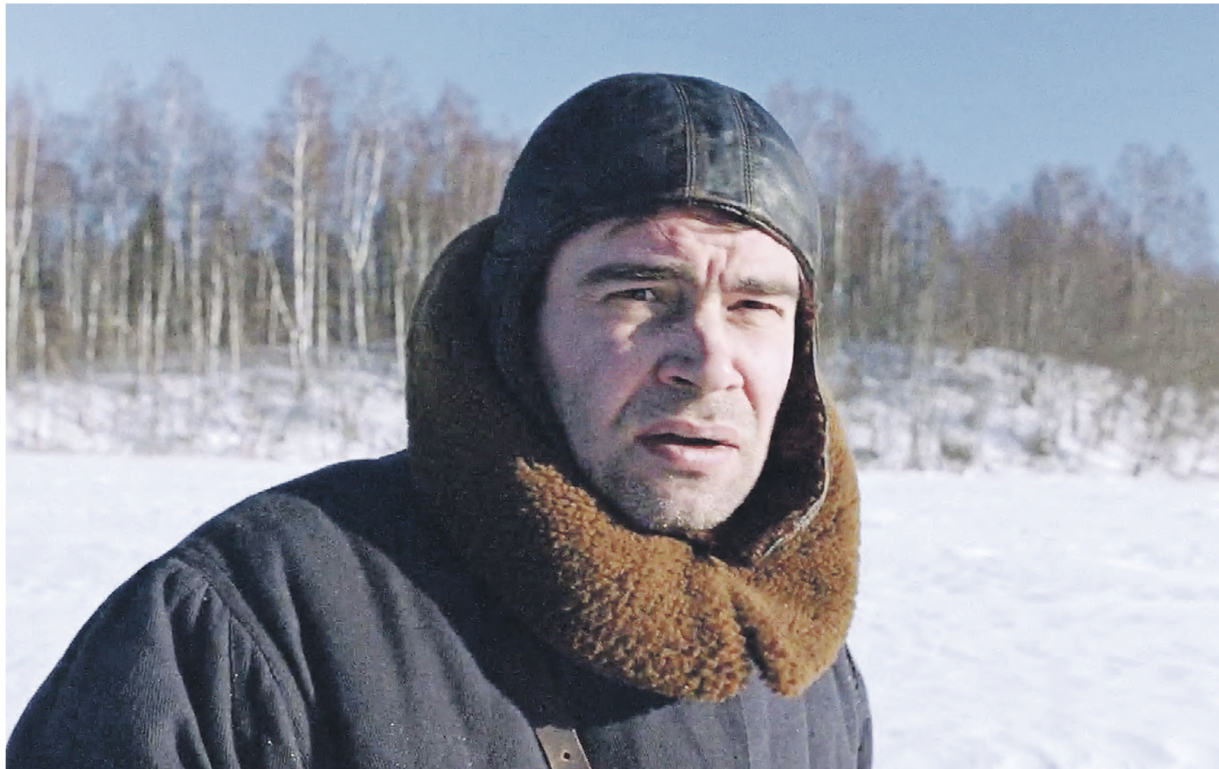
Актер Петр Федоров в роли Николая Комлева на съемочной площадке фильма «Летчик» (2021) полз по снегу, проходил через ледяную воду, ел сырую рыбу, убежал от живых волков, а еще похудел на 17 килограммов, чтобы в кадре было заметно, какой путь преодолел герой

Каждое поколение зрителей воспринимает киноповествование иначе, чем предыду-