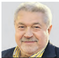
ЮЛИЙ ГУСМАН телеведущий, член жюри КВН

Чем силен КВН? Тем, что каждый год он растит новых ребят, которые приходят к городским и школьным лигам региональным. Эта свежая кровь дает ему жизнь. Но КВН, как и футбол, — это игра. Со временем она достигает высоких вершин. И сегодня тяжело даже признанным мастерам забить гол. Также сложно сегодня придумать что-то оригинальное и остроумное, яркое — чего еще не придумали до тебя. Что ждет КВН в дальнейшем? Будет обидно, если «тиктокеры» его победят. Но вспомним, что, когда появилось кино, многие предрекали быструю смерть театру. Но театр выжил и развивается. То же и с КВН. Если его не будут терять, унывать и разворовывать, то он будет жить, даже если он потеряет какую-то часть популярности. Все равно в него будут играть и в школах, и в институтах. «Тиктокеры», конечно, будут набирать обороты. Но ведь ничего не случилось с прежними музыкальными жанрами, когда появились рэперы. Должно быть так, как сказал когда-то Мао Цзэдун: «Пусть расцветают все сто цветов».