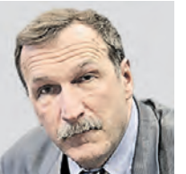
ГЕОРГИЙ БОБТ ОБОЗРЕВАТЕЛЬ

Мнение колумнистов может не совпадать с точкой зрения редакции «Вечерней Москвы»