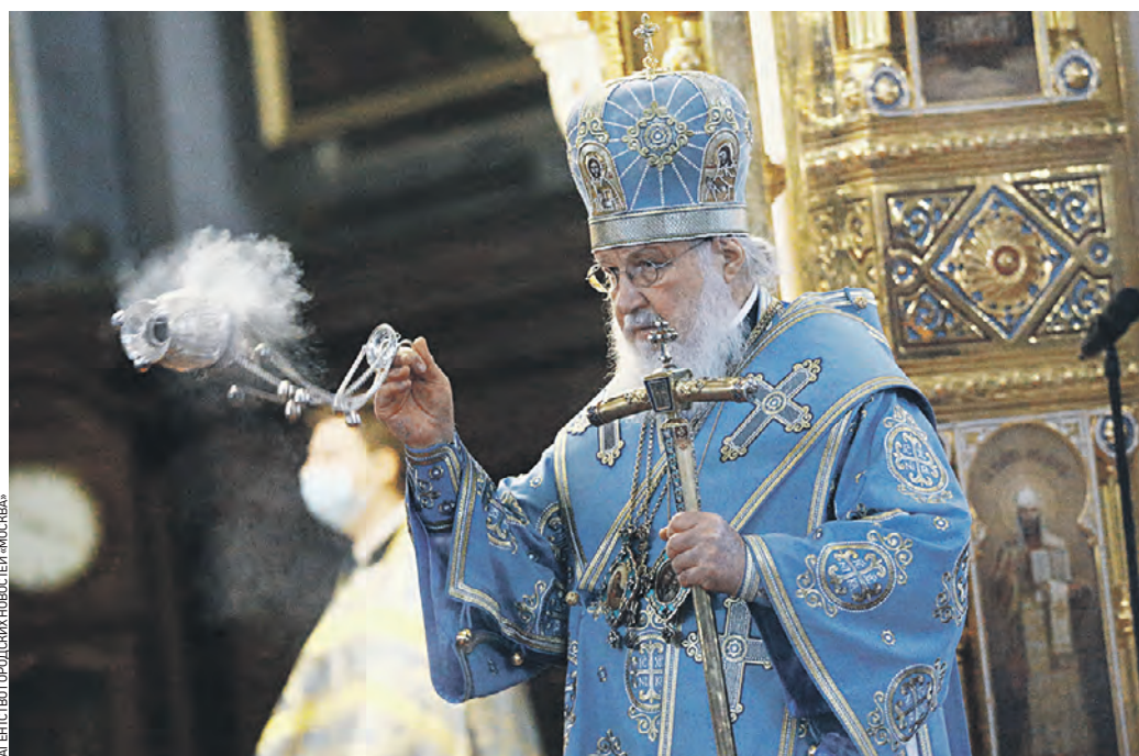
4 ноября 12:48 Святейший Патриарх Московский и всея Руси Кирилл совершил Божественную литургию в честь праздника в храме Христа Спасителя

В Нафедральном соборном храме Христа Спасителя прошла Божественная литургия сразу в честь двух праздников: Казанской иконы Божией Матери и Дня народного единства. Ее совершил Святейший Патриарх Московский и всея Руси Кирилл.