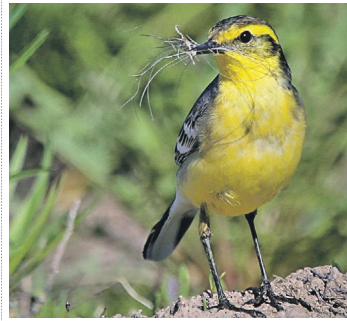
10 мая 14:35 Природно-исторические парки Москвы обивают желтоголовые трясогузки