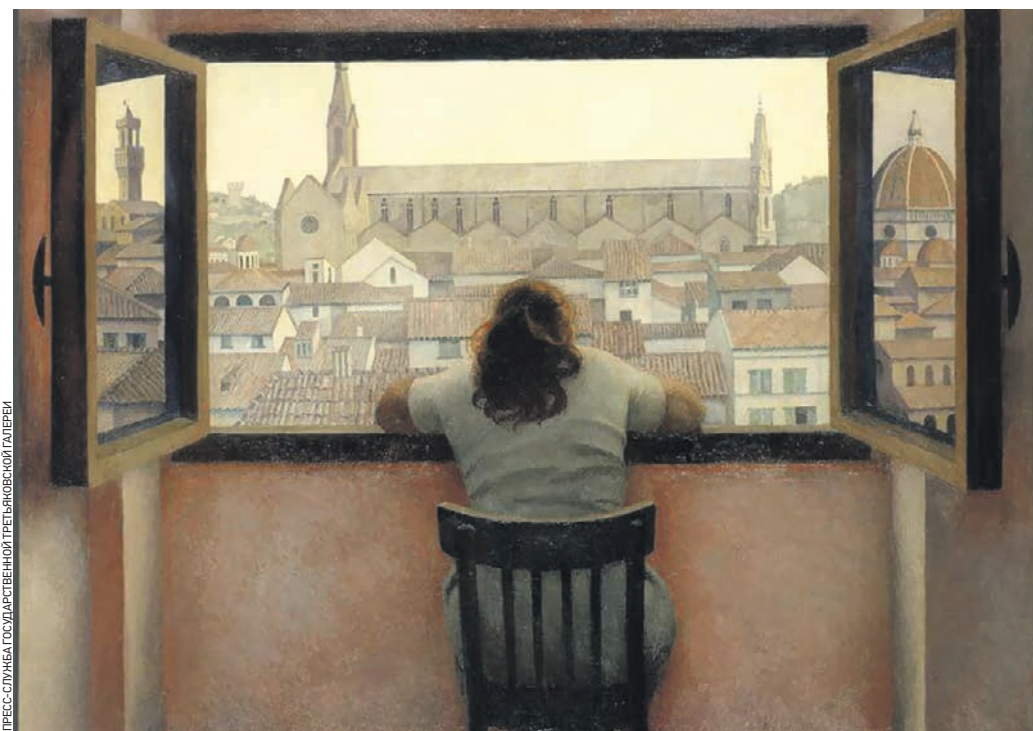
Вчера 13:20 Одной из работ, представленных на выставке, станет картина известной советской художницы Татьяны Яблонской «Вечер. Старая Флоренция»

В первую очередь мы будем заботиться о безопасности своих посетителей и соблюдать все меры социального дистанцирования. Большая часть билетов будет выведена для продажи онлайн, а обычные кассы — оборудованы специальными защитными экранами. Также в экспозиционных залах будет меньше посетителей, и мы предоставим им маски и перчатки.