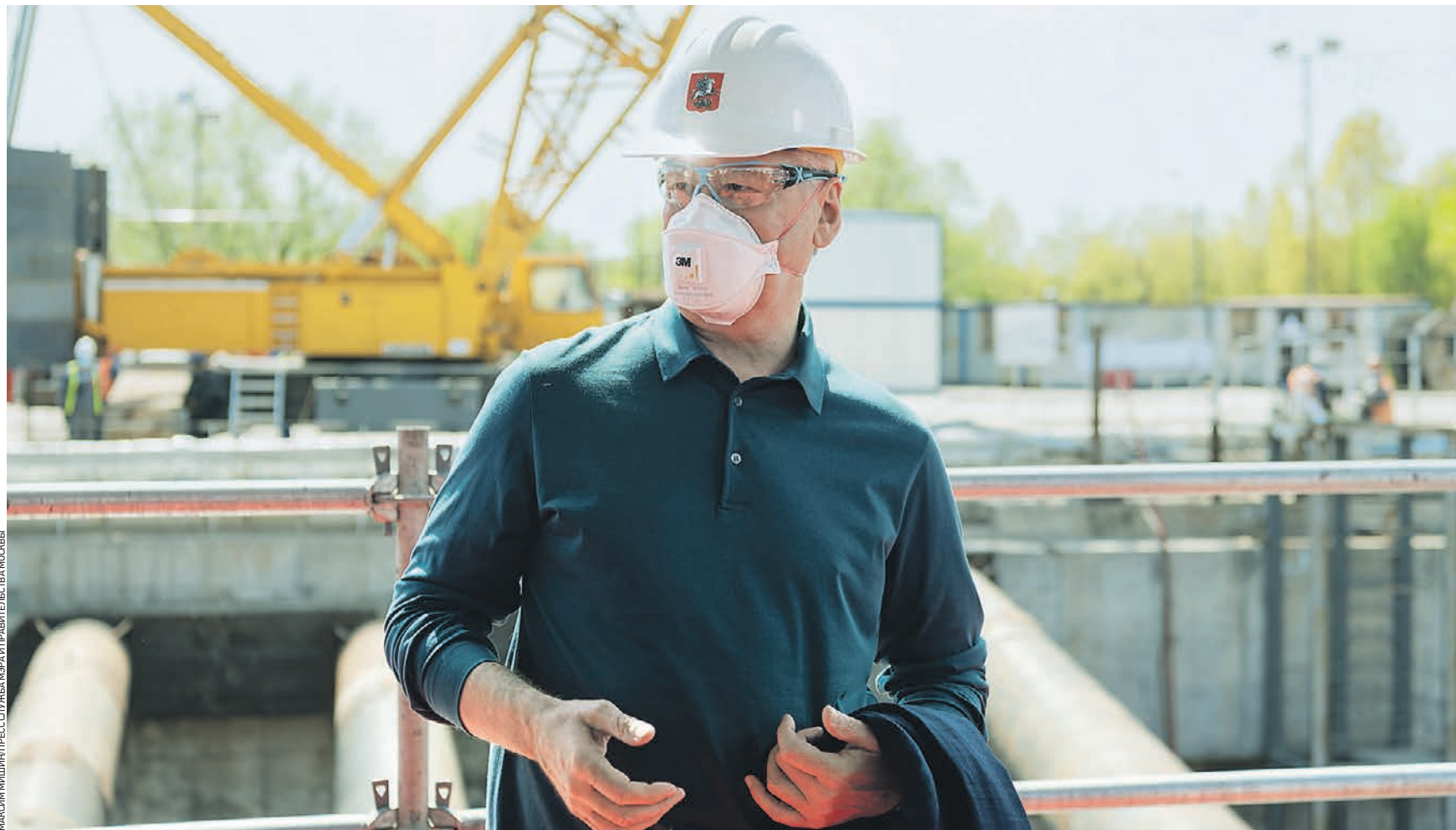
Вчера 11:05 Мэр Москвы Сергей Собянин на стройплощадке станции «Кленовый бульвар» Большой кольцевой линии метро. По его словам, строители соблюдают все необходимые санитарные нормы. Это нужно, чтобы не допустить распространения коронавирусной инфекции в столице

контроль Несмотря на ограничения, введенные в городе из-за коронавируса, стройка метро все это время не останавливалась на минуту. Об этом вчера сообщил мэр Москвы Сергей Собянин.