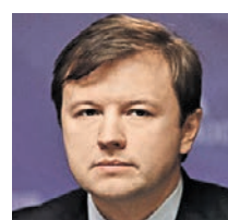
ВЛАДИМИР ЕФИМОВ ЗАМЕСТИТЕЛЬ МЭРА МОСКВЫ ПО ВОПРОСАМ ЭКОНОМИЧЕСКОЙ ПОЛИТИКИ И ИМУЩЕСТВЕННО-ЗЕМЕЛЬНЫХ ОТНОШЕНИЙ