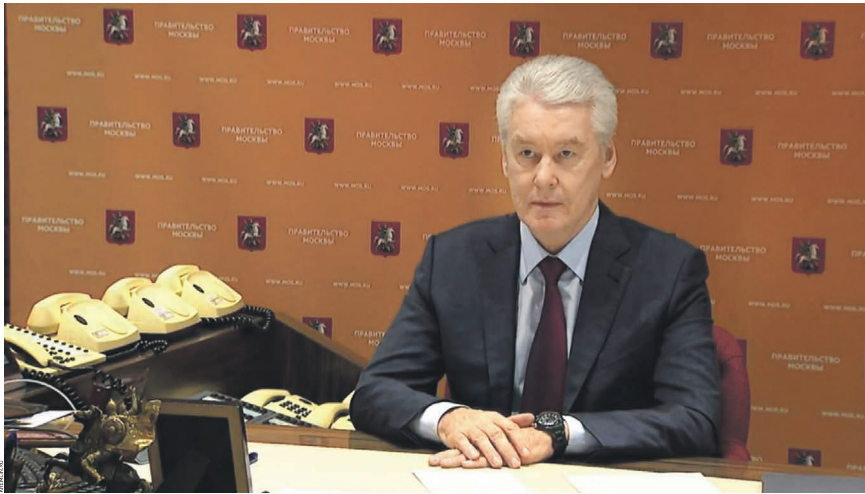
Вчера 18:07 Мэр Москвы Сергей Собянин во время совещания президента России с руководителями регионов по вопросу противодействия распространению коронавирусной инфекции. Глава города рассказал про столичный опыт борьбы с болезнью

решения Искусственный интеллект поможет врачам обнаружить коронавирусную инфекцию по рентгеновским снимкам. Об этом вчера мэр Москвы Сергей Собянин заявил президенту.