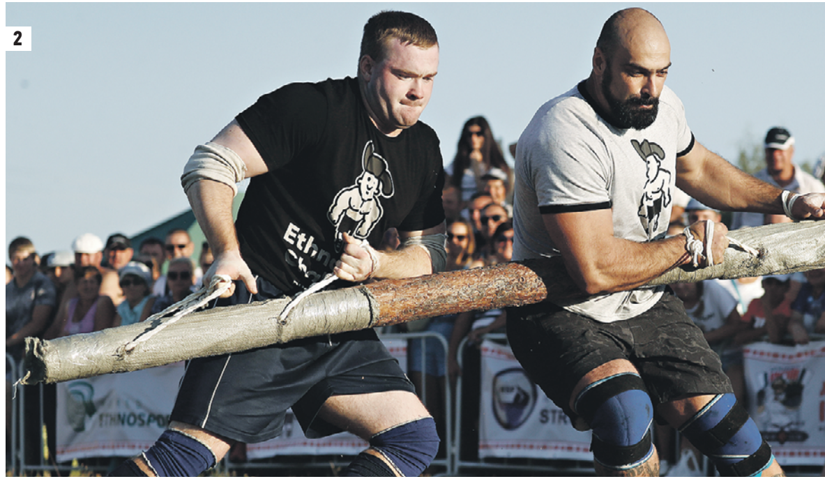
2 25 ноября 2017 года. В музее-усадьбе С. В. Рахманинова ежегодно проводятся музыкальные фестивали (1) 27 августа 2018 года. В село Атнамов Угол на традиционные русские игры «Атнамовские кулачки» съезжаются гости со всей области (2)

Уникальность Тамбовщины кроется в ее жителях