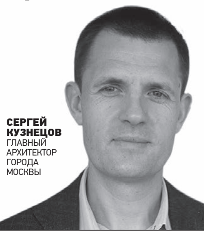
СЕРГЕЙ КУЗНЕЦОВ ГЛАВНЫЙ АРХИТЕКТОР ГОРОДА МОСКВЫ

Качественная архитектура будет нужна всегда. Однако я уверен, что опыт, полученный нами в коронавирусный период, наложит заметный отпечаток на переосмысление всего градостроительства.