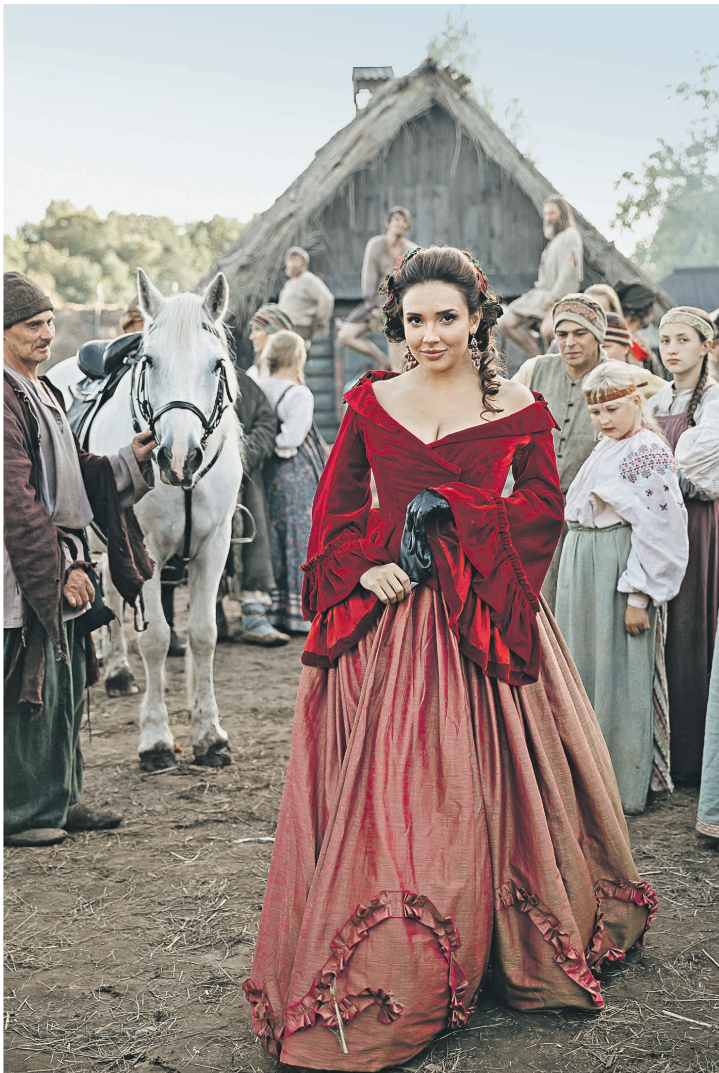
Актриса Ольга Дибцева в роли Аглаи из комедии режиссера Клема Шипенко «Холоп», которая триумфально прошла в отечественном кинопрокате