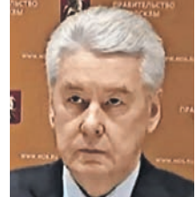
РИЧАРД БЛОТ / СЕРГЕЙ СОБЯНИН

Из-за большой востребованности проводить один из самых популярных среди выпускников экзаменов решено в течение двух дней. Это необходимо для обеспечения санитарно-эпидемиологической безопасности и снижения риска заражения коронавирусной инфекцией.