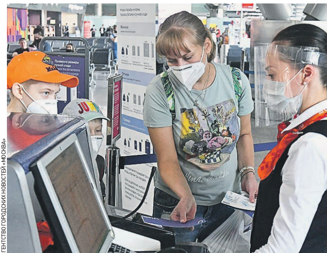
10 июня 2020 года. Пассажиры и сотрудники аэропорта Внуково не забывают носить медицинские маски

— рассказали в пресс-службе аэропорта Внуково. Проверку Ространснадзора успешно преодолел и аэропорт Домодедово. — Использование электронного посадочного талона позволяет пассажирам пройти предполетные формальности, минимизировав социальные контакты. Желание могут сдать анализ на коронавирус в нашем медпункте, — уточнили в пресс-службе воздушной гавани. Андрей Шнырев, замглавы Ространснадзора, сообщил, что нарушениями санитарно-эпидемиологических требований на транспортных объектах становится меньше.