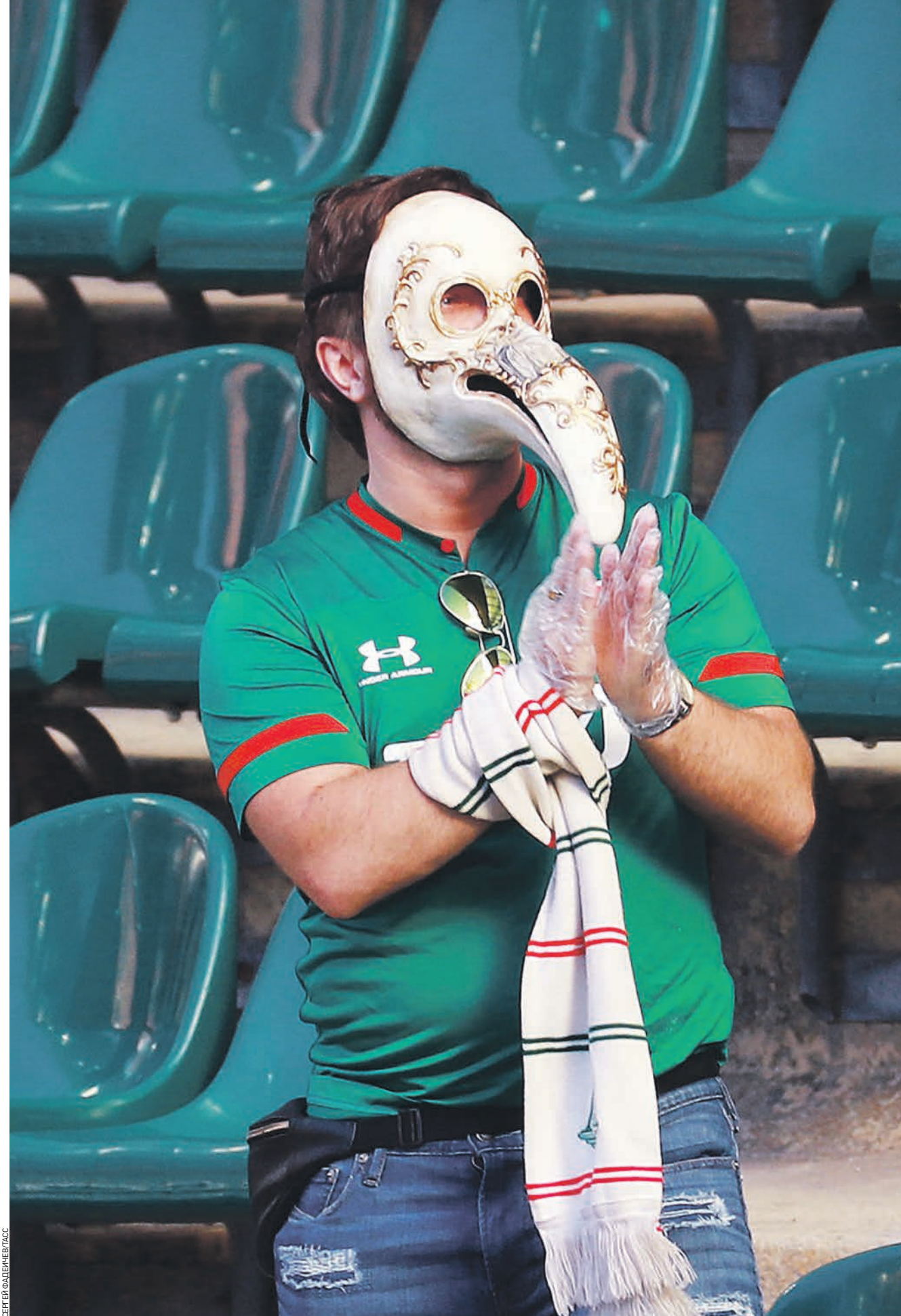
21 июня 2020 года. Болельщик на матче чемпионата России по футболу между командами «Локомотив» (Москва) и «Оренбург» (Оренбург). На спортивных мероприятиях зрители теперь обязаны соблюдать социальную дистанцию, носить маски и перчатки