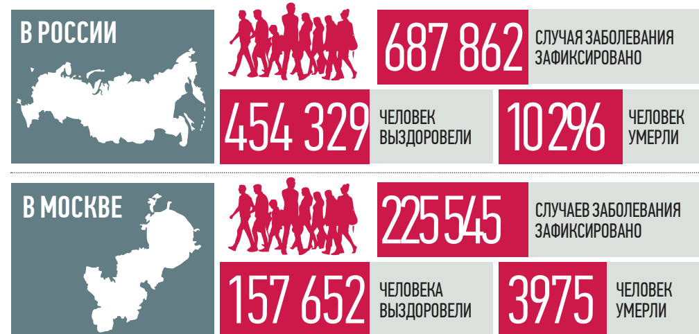
По данным стопкоронавирус.рф и mos.ru на 19:00 6 июля