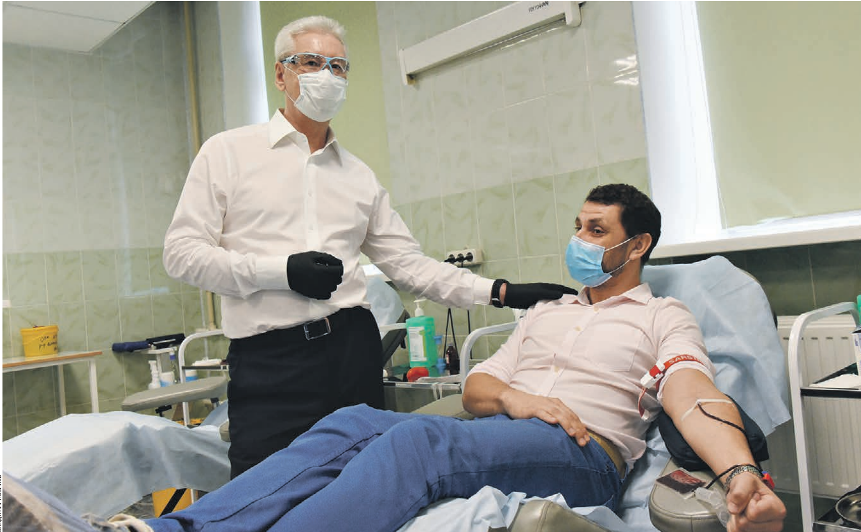
Вчера 14:37 Мэр Москвы Сергей Собянин (слева) пообщался с Почетным донором России Яковом Якубовичем, который пришел сдать кровь в одно из старейших столичных отделений переливания крови в городской клинической больнице № 52