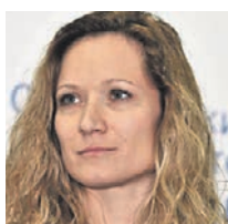
МАРИЯ КИСЕЛЕВА ТРЕХКРАТНАЯ ОЛИМПИЙСКАЯ ЧЕМПИОНКА ПО СИНХРОННОМУ ПЛАВАНИЮ, ТЕЛЕВЕДУЩАЯ, ДЕПУТАТ МОСГОРДУМЫ