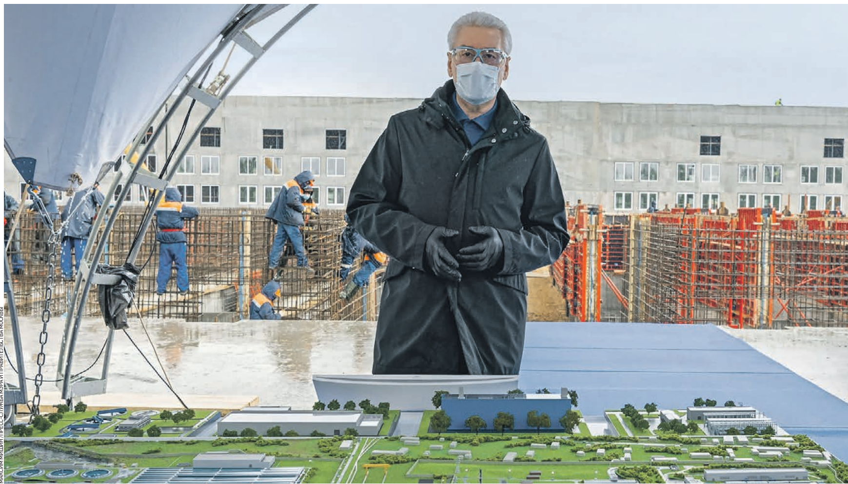
5 июня 15:37 Мэр Москвы Сергей Собянин на территории Люберецких очистных сооружений, где сейчас идет реконструкция. Современный блок механической очистки сточных вод должны запустить уже в этом году, что позволит избавиться от неприятных запахов