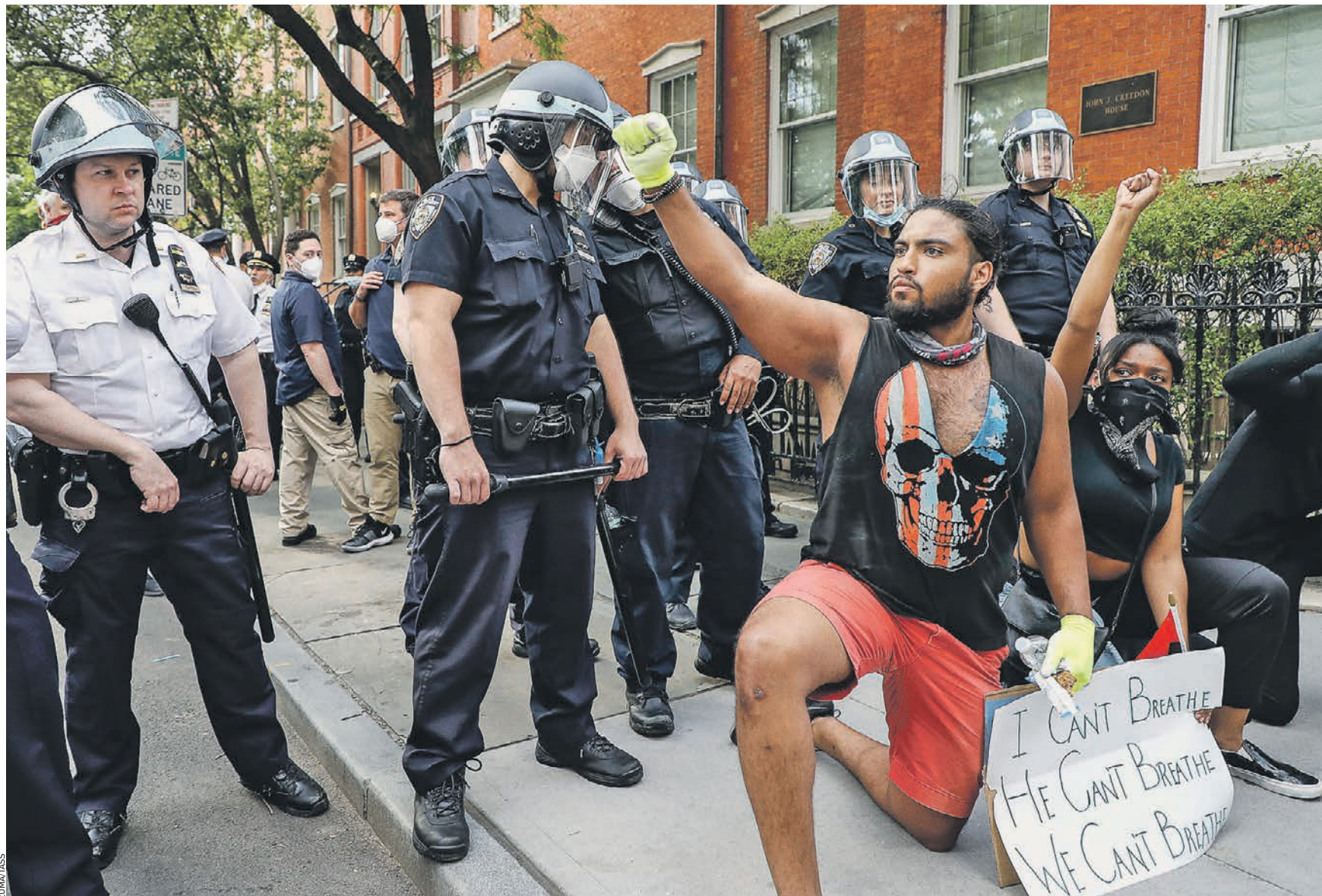
1 июня 2020 года. Америке охватили грабежи магазинов и поджоги, в некоторых городах орудуют мародеры. Массовые протесты в Нью-Йорке, вызванные смертью афроамериканца Джорджа Флойда после его задержания полицией в Миннеаполисе

Все началось с инцидента в Миннеаполисе: во время жестокого задержания местного чернокожего Джорджа Флойда (его подозревали в попытке расплатиться фальшивым чеком при покупке сигарет) тот скончался от сердечного приступа. Видео попало в интернет и спровоцировало сначала мирные, а затем — быстро — буйные протесты с поджогами и грабежами магазинов, распространявшиеся на крупные города востока, юга и запада страны. Средний Запад, традиционная вотчина республиканцев, остался в основном не затронутым беспорядками. В Америке волнения на расовой почве вспыхивают с завидной регулярностью каждые примерно 10 лет, однако после принятия законов о десегрегации (в 60-х годах XX века), как правило, они не выходили за рамки одного-двух мегаполисов и одного штата. А тут заполыхало полстраны, к чему не был готов ни Белый дом, ни силовые структуры. А Белый дом и сам президент все последние дни не смогли сформулировать по отношению к происходящему политику сколь-либо внятную. Трамп ограничивался гневными твитами в адрес