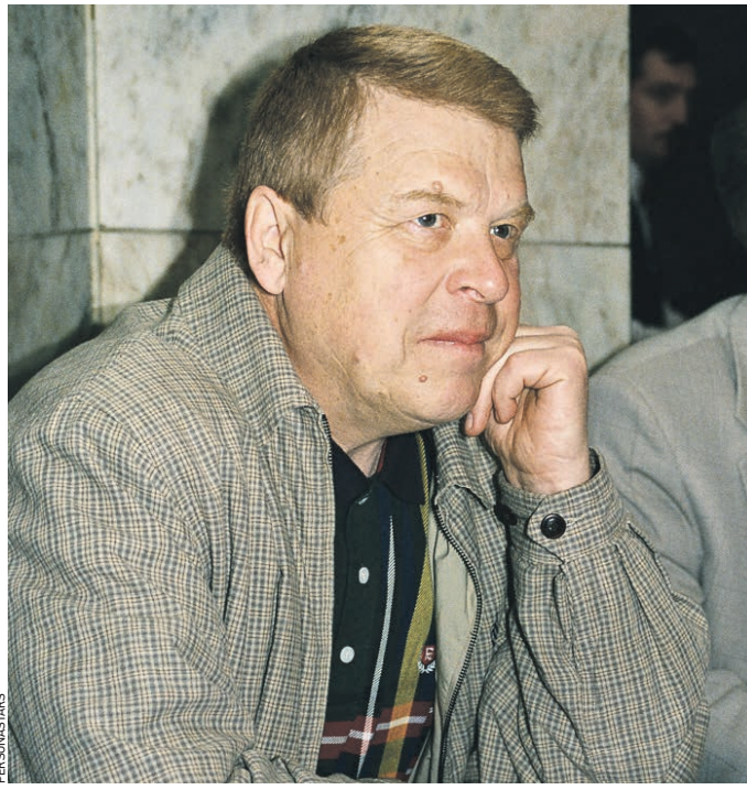
2017 год. Актер Михаил Кокшенов после тяжелой болезни

и ярким. Поразительно, но многие считали Михаила Кокшенова уроженцем деревни. Хотя почему — «поразительно». Он и правда очень органично выглядел на фоне березок и полей. А на самом деле был он по рождению москвичом. Просто природа, будто зная загодя, что предначертано ему судьбой, определила его актерское амплу загодя: умнейший, начитанный и образованный Кокшенов идеально играл простаков, недалеких и туповатых мужичков, оселенных «деревенской простотой» и незамутненностью. Да, попробовал себя в роли героя-романтика ему, может, и хотелось, но куда там! Правда, для Михаила Михайловича это относительно узкое амплу драмой не стало. Напротив даже, он не раз говорил, что в традиции российского драматического театра всегда было четкое разделение на типажи. Отчего не следовать негласным правилам прошлого? Когда мальчик Миша подросток, в столицу как раз привезли так называемое трофейное кино. И он по-настоящему заболел кинематографом. Причем болезнь не была сезонной — это была страсть навсегда. И хотя он честно попытался стать, как отец, «технарем» и даже посту-