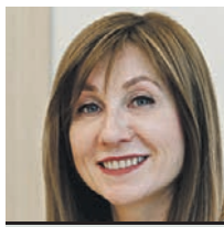
ЛАРИСА КАРТАВЦЕВА ПРЕДСЕДАТЕЛЬ КОМИССИИ МОСКОВСКОЙ ГОРОДСКОЙ ДУМЫ ПО ЗДРАВООХРАНЕНИЮ И ОХРАНЕ ОБЩЕСТВЕННОГО ЗДОРОВЬЯ