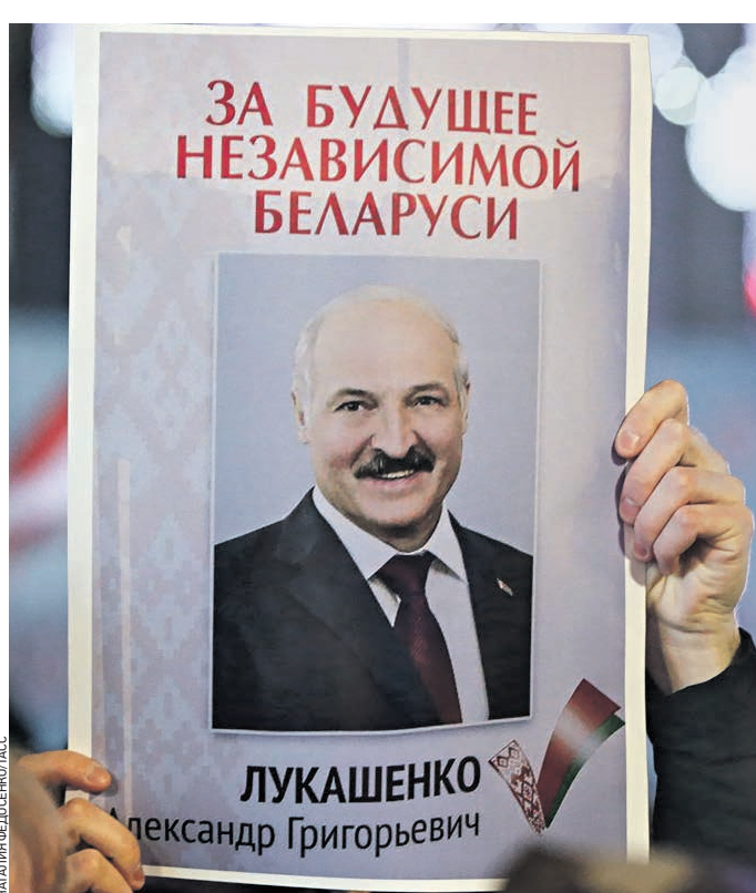
20 декабря 2019 года. Планет в руках сторонника Лукашенко на одном из митингов

Парламент Белоруссии назначил президентские выборы на 9 августа. 21 мая стартовал сбор подписей избирателей для выдвижения кандидатов в президенты. 31 мая тысячи белорусов пришли на предвыборные пикеты по стране, чтобы поставить подписи в поддержку выдвижения Светланы Тихановской кандидатом в президенты. Они также выразили поддержку ее супругу и руководителю инициативной группы, задержанного на пикете в Гродно вместе с соратниками, теперь они находятся в изоляторе временного