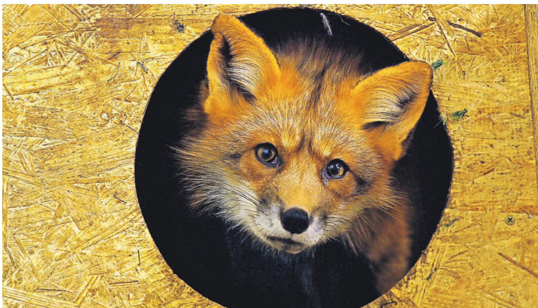
6 февраля 2019 года. Лисица — обитательница контактного зоопарка «Живой уголок» в парке «Сокольники». Сейчас этот контактный зоопарк временно закрыт после сообщений очевидцев о том, что животных выгуливали в дни новогодних праздников. При этом питомцы выглядели запуганными

Михась Мы с семьей каждый год ездим в деревню. Ребята, большего и не надо.