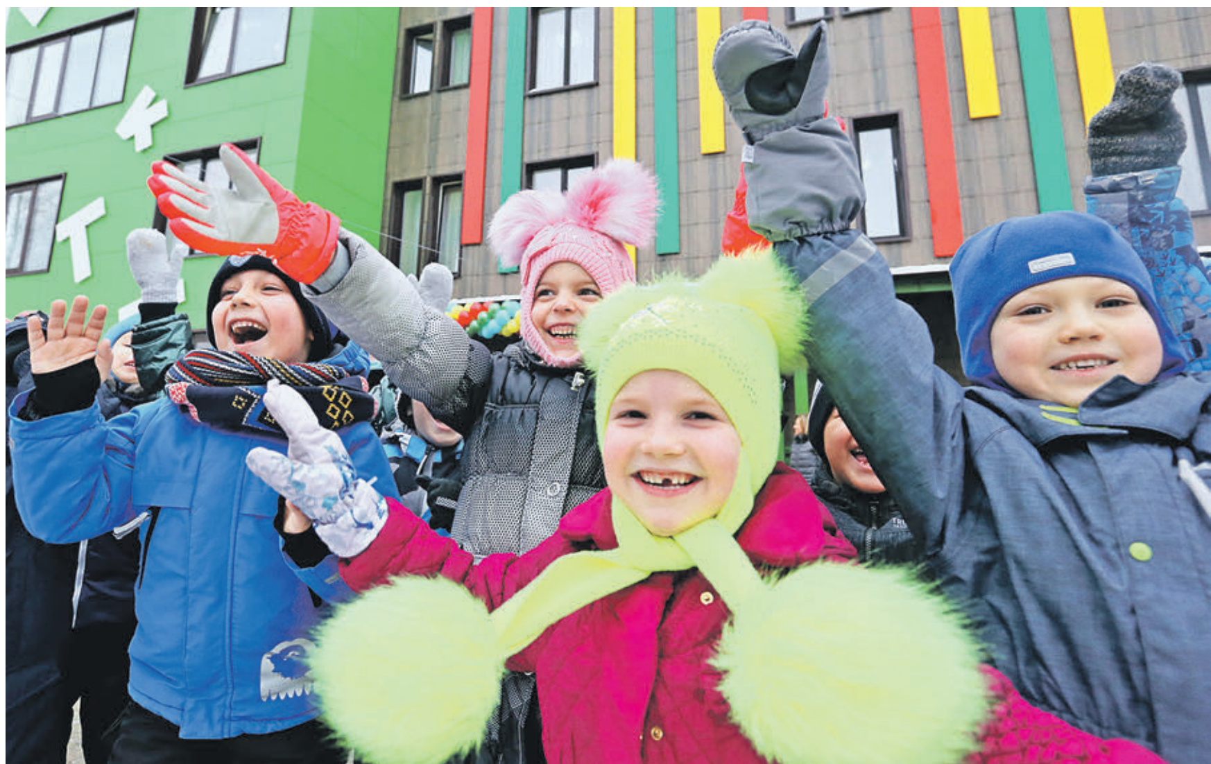
1 февраля 2019 года 11:04 Больше всего открытию еще одного детского сада в поселке Знамя Октября в Троицком и Новомосковском административных округах столицы рада местная детвора. Он был возведен за счет средств компании-застройщика

Всего же за прошедший год в столице появилось 510 новых объектов. Из них 89 введены за счет городского бюджета, а 421 возведен на средства инвесторов. Например, столица открыла 11 детских садов, а инвесторы в новых кварталах построили почти вдвое больше — 20 дошкольных учреждений. Школ — две за бюджетные средства, шесть — за счет инвесторов, спортивных объектов — пять и восемь соответственно. Москва больше вкладывает в учреждения здравоохранения — их за счет средств казны появилось пять, а бизнес принял участие в создании еще двух объектов. В спортив-