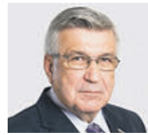
МИХАИЛ ТАРАСЕНКО ДЕПУТАТ ГОСУДАРСТВЕННОЙ ДУМЫ

и материальные лишения. Логическим продолжением инициативы будет прогрессивное налогообложение граждан с более высокими зарплатами, которые относятся к верхним слоям среднего класса и к элитам. Повышать НДФЛ таким людям следует существенно.