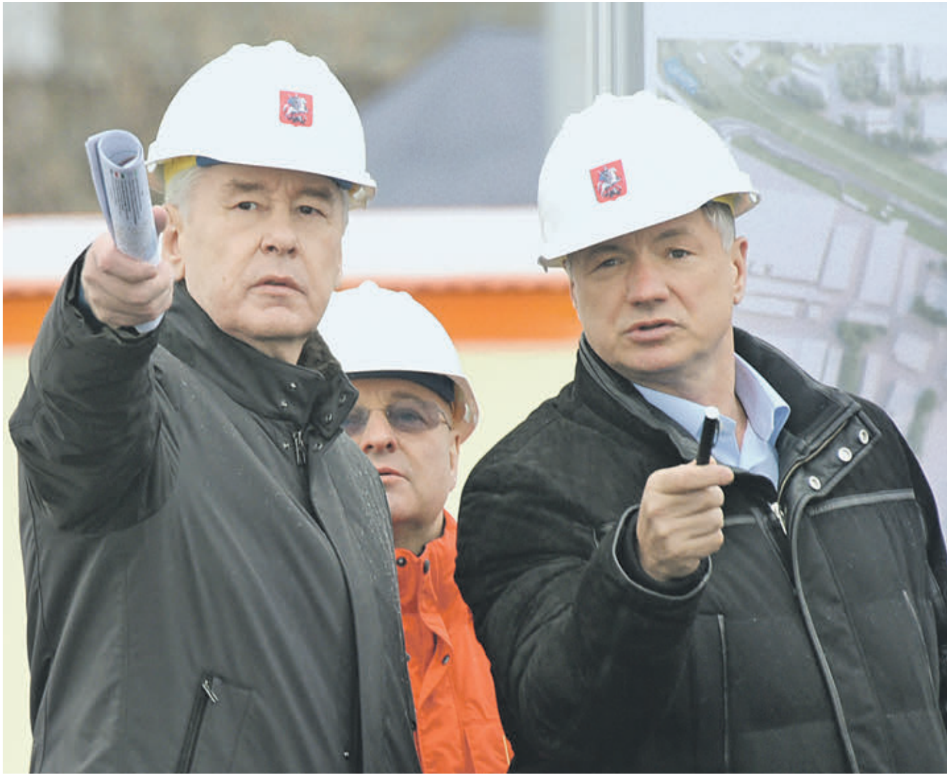
Вчера 13:12 Мэр Москвы Сергей Собянин (слева), префект Юго-Восточного округа Андрей Цыбин (на втором плане) и заммэра столицы по вопросам градостроительной политики и строительства Марат Хуснуллин на строительстве путепровода через МЦК

Вчера мэр Москвы Сергей Собянин осмотрел ход строительства эстакады через Московское центральное кольцо (МЦК) от улицы Пруд Ключики до 1-й Фрезерной улицы.