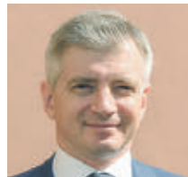
АЛЕКСАНДР КИВОВСКИЙ МИНИСТР ПРАВИТЕЛЬСТВА МОСКВЫ, РУКОВОДИТЕЛЬ ДЕПАРТАМЕНТА КУЛЬТУРЫ МОСКВЫ

В пятницу бесплатным будет вход в усадьбу «Измайлово» и музей-заповедник «Коломенское». А в конце недели горожан приглашают в Музей Москвы, Музей космонавтики и Дом-музей Марины Цветаевой. На этот раз в акции участвуют более 80 площадок культурных учреждений, подведомственных Департаменту культуры города Москвы. Перед визитом рекомендуется уточнить время работы и условия посещения на сайте музея или галереи. Также ознакомиться с расписанием дней бесплатного посещения можно на портале: mos.ru.