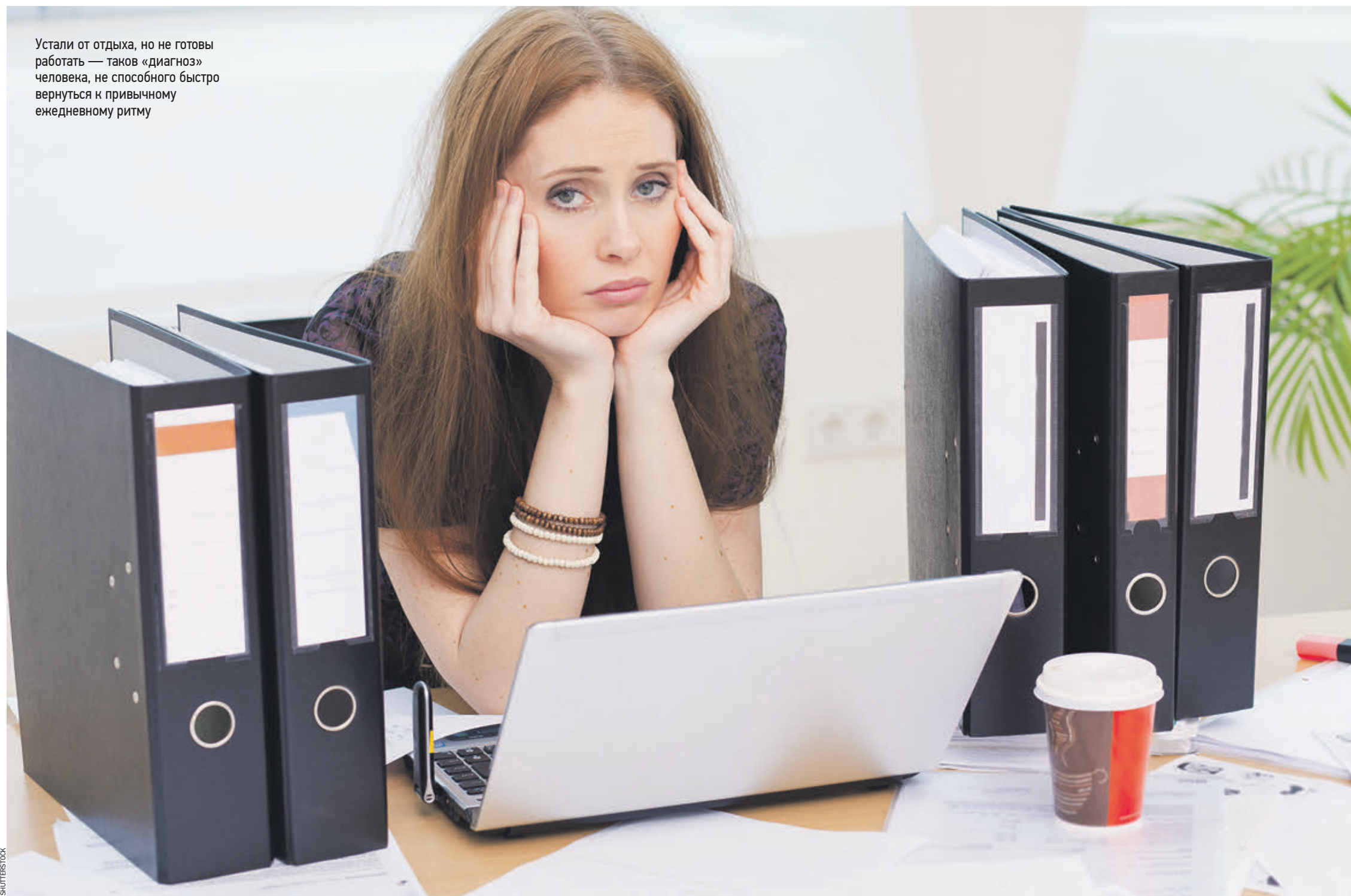
Устали от отдыха, но не готовы работать — таков «диагноз» человека, не способного быстро вернуться к привычному еженедельному ритму

Почему люди устают от собственного отдыха и продолжают «киснуть», выйдя из отпуска