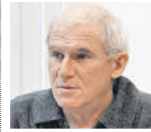
ВИКТОР МАТИЗЕН ПРЕЗИДЕНТ ГИЛЬДИИ КИНОВЕДОВ И КИНОКРИТИКОВ РОССИИ

В том, что им предоставляют льготные условия для производства, но я категорически против льготных условий для кинопроката.