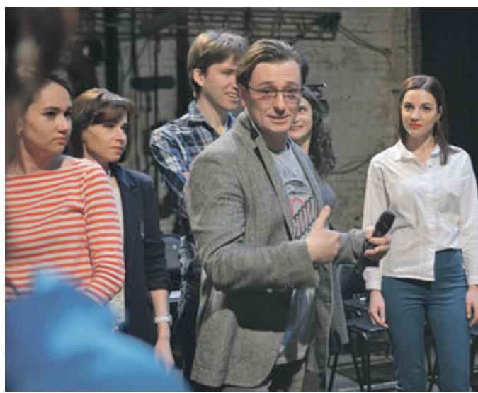
13 марта 2019 года 13:20 Сергей Безруков проводит мастер-класс по актерскому мастерству для журналистов

Народный артист России, художественный руководитель Московского губернского театра Сергей Безруков провел мастер-класс по актерскому мастерству для журналистов.