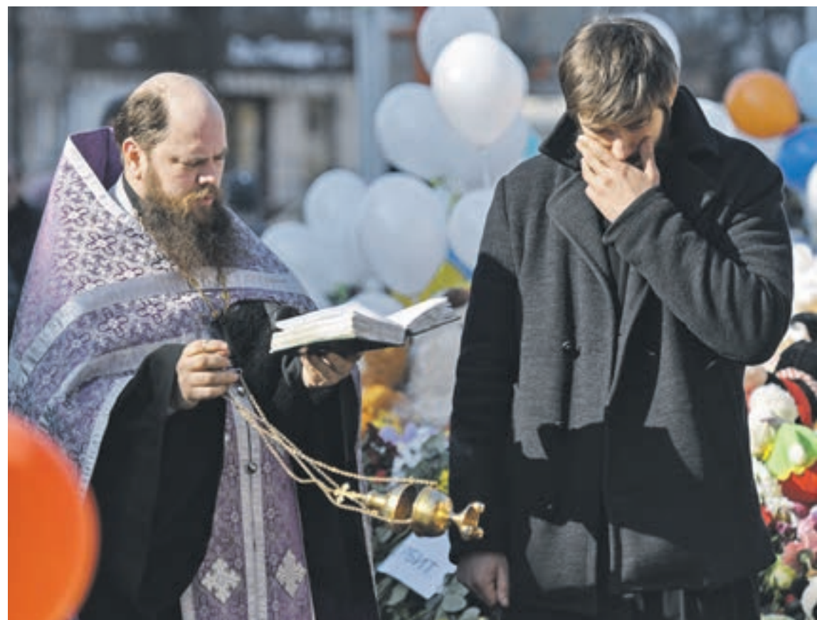
Кемерово. 29 марта 2018. Во время панихиды у торгового центра «Зимняя вишня», где 25 марта при пожаре, по официальным данным, погибли более 60 человек