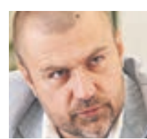
КИРИЛЛ КАБАНОВ ПРЕДСЕДАТЕЛЬ НАЦИОНАЛЬНОГО АНТИКОРРУПЦИОННОГО КОМИТЕТА РОССИИ

То, что вопросом судебной реформы занялся сам глава государства, это гарантирует, что вопрос будет грамотно проработан и решен. Вопрос о судеб-