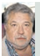
ЮЛИЙ ГУСМАН ТЕАТРАЛЬНЫЙ ДЕЯТЕЛЬ, КИНОРЕЖИССЕР

Остаюсь оптимистом по поводу российского кино и утверждаю, что наше кино находится на небывалом подъеме. Появились хорошие картины для широкого проката. То есть не для узкого круга ценителей, а для всех зрителей. Давно не было таких фильмов, какие снимали Георгий Данелия, Эльдар Рязанов, Леонид Гайдай, и вот сейчас, к счастью, они стали появляться. Причем эти фильмы не проваливаются в прокате, проигрывая конкуренцию американским, и это большая победа. Замечу, что фильмы сняты за не очень большие деньги, как блокбастеры, но зато с добрым сердцем и любовью к кино и к зрителю. В этом году на «Нике» был очень сильный конкурс, большая конкуренция. В итоговую номинацию не вошли такие фильмы, как «Анна Каренина» Карена Шахназарова, «Большой» Валерия Тодоровского. Зато академики остановили свой выбор на фильмах «Аритмия», «Союз 7», «Теснота», «Нелюбовь». В нашей академии 700 академиков, и 15 составов жюри, и у всех свои предпочтения.