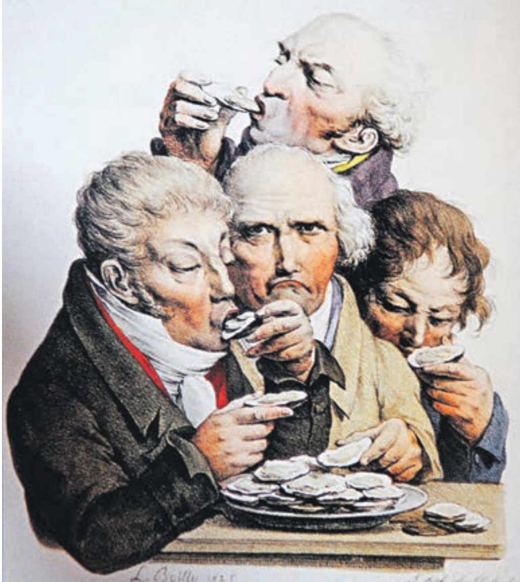
Иллюстрация к книге «Между жарким и бланманже»: А. С. Пушкин и его герои за трапезой. 1825 год. Луи Леопольд Буайи. Пожиратели устриц. Литография с подражкой акварелью