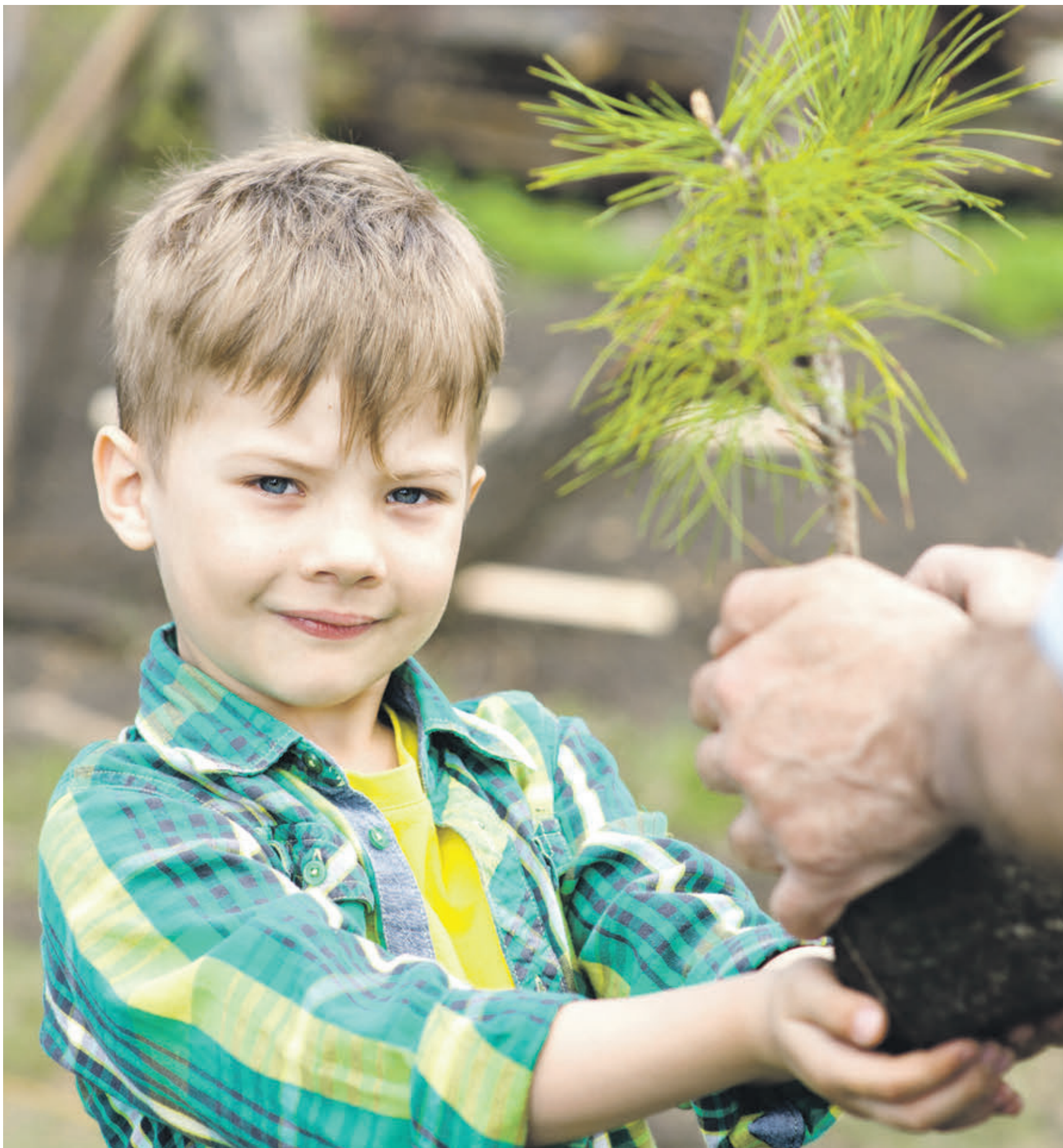
Особенно мастер-классами по высадке кедров интересуются дети. Посаженные ими кедрки начнут плодоносить через 15–20 лет. Конечно, при условии, что за деревьями все это время будут правильно ухаживать

Ликбез по посадке девушки снабжают обильным познавательным материалом. Участникам мастер-класса обязательно рассказывают, что сибирский кедр — дерево, обладающее уникальными свойствами. Его хвоя наполняет воздух фитонцидами, делает его чистым и целебным. Кроме того, всеми любимы вкусные кедровые орешки, которыми, при хорошем уходе, кедр может порадовать уже в 10–15-летнем возрасте. Сейчас в Москве растут кедры: в Александровском саду, у Музея Рерихов, на Новослободской, в парке Победы, на ВДНХ и в парке «Останкино»... Самые старые кедры Москвы — им около 150 лет — растут в Измайловском парке, недалеко от Главной аллеи. Самые молодые — им 7 лет — на берегу Серебряно-Виноградного пруда. Эту кедровую рощу посадили немецкие участники «Автопробега дружбы Берлин — Москва» в августе 2017 года. В завершение занятий всем участникам мастер-класса предлагается поучаствовать в уникальной экскурсии по «Кедровой тропе Москвы», в новых кедровых мастер-классах, а также в международном творческом конкурсе «Мишка.Кедр.Шишка». Желающие могут расширить свои познания о чудо-дереве в детском кедровом питомнике в Измайлово, кедровом клубе «Серебряные кедролобы» на Якиманке, побывать на Дне кедра и на предстоящем «Кедровом балу» в Библиотеке им. А. П. Боголюбова.