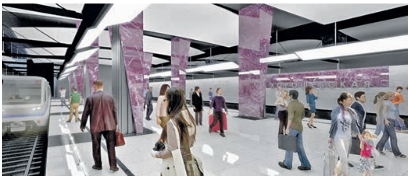
Проект станции «Хорошевская» Большой кольцевой линии метро. Цвет отделки станции — фиолетовый. Именно он подсказывает, что пересечь с нового кольца метро можно на станцию «Полежаевская» Таганско-Краснопресненской ветки

В то же время развернуты работы практически на всех участках новой кольцевой. Ее протяженность составит 68 километров. Восемь проходящих шитов прокладывают тоннели подземелья, еще пять механизированных комплексов лежат на бровке строительной площадки — то есть фактически готовы к стартам. В состав ветки войдут три станции действующей Каховской линии метро — «Каширская», «Варшавская» и «Каховская». Их реконструируют.