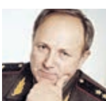
ВЛАДИМИР ТУМИН ЗАСЛУЖЕННЫЙ СОТРУДНИК ОРГАНОВ БЕЗОПАСНОСТИ РФ, ГЕНЕРАЛ-ЛЕЙТЕНАНТ В ОТСТАВКЕ

Закон об оперативно-разыскной деятельности и закон о персональных данных сохранение тайны следствия и оперативно-разыскных мероприятий. Требуется хранить данные на территории России также не ново, оно входит в Закон о персональных данных. Тайна переписки — очень важная вещь. Но закон устанавливает некоторые ограничения этого права. Это прописано в Уголовно-процессуальном кодексе. Так, если гражданину предъявлено обвинение, то органы безопасности имеют право направить запрос на получение данных о нем, в том числе и переписки. Это мировая практика. Если говорить об иностранных компаниях, то у них всегда есть выбор: подчиниться требованиям российских законов или не работать здесь. Большинство популярных мессенджеров управляют из-за рубежа, и будет очень сложно заставить иностранных компании подчиниться требованиям наших законов. Все зависит от того, в какой стране инкорпорирован мессенджер. Но тут вопрос не только внутреннего российского законодательства. Необходимо опираться на международные процедуры обмена этой информацией. Иначе закон не будет работать. Важно, чтобы эти запросы не носили массовый характер. Они должны помогать в расследовании конкретных преступлений.