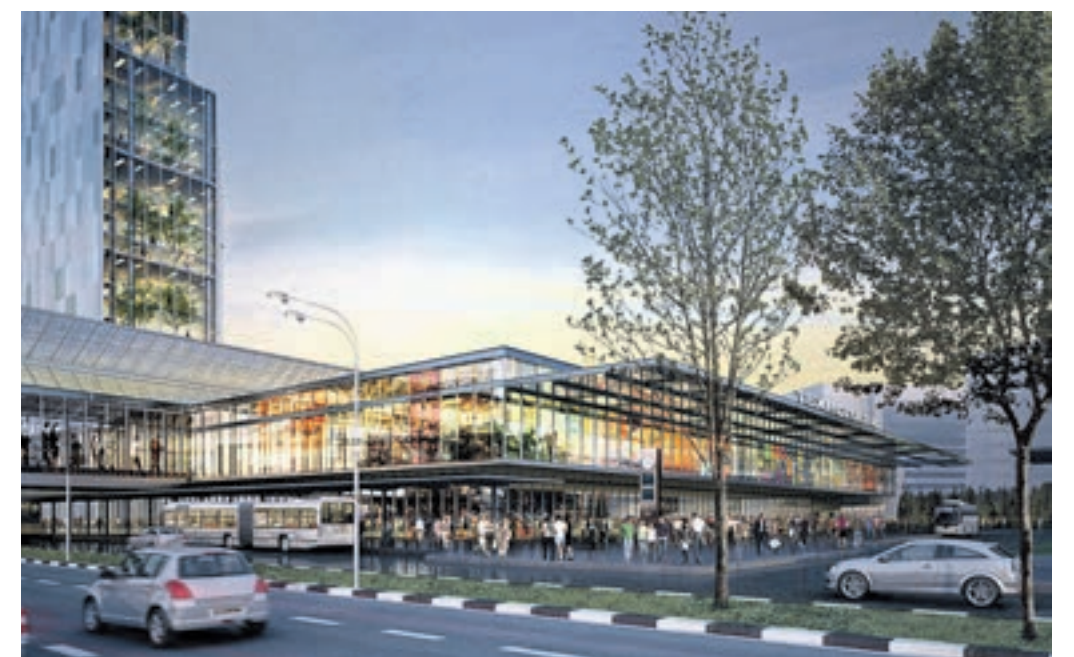
Проект транспортно-пересадочного узла «Ховрино», который будет построен на базе станции метро «Ховрино». Узел планируют открыть летом 2018 года

Параллельно с этим идет проектирование железнодорожной станции Ховрино-2, которую построят в 2019 году. Ее интегрируют с метро в единый транспортно-пересадочный узел.