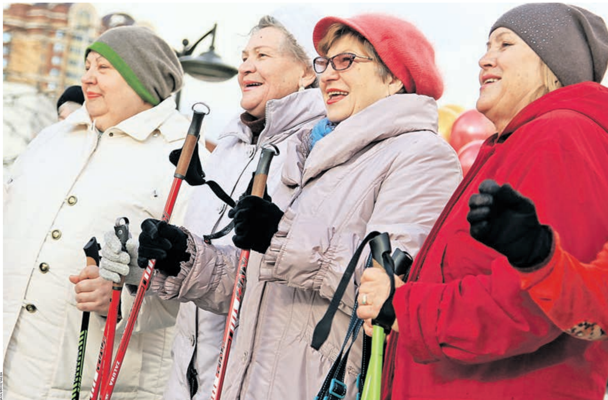
20 октября 14:48 Власти города не только заботятся о поддержке пенсионеров, но и создают все возможности для того, чтобы представители старшего поколения могли интересно и с пользой для себя проводить свободное время. Как, например, участницы клуба скандинавской ходьбы, работающего на базе территориального центра социального обслуживания «Таганский»