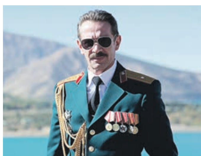
Владимир Машков в образе дирижера военного оркестра на съемках фильма «Юбилейный встречный»