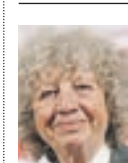
УЛЬРИКЕ ОТТИНГЕР РЕЖИССЕР, ЧЛЕН ЖЮРИ КОНКУРСА ИГРОВОГО КИНО

Москва — очень живой город, который меняется стремительно. Каждый раз, приезжая в столицу России, я вижу перемены. Москва в силу своей внутренней динамики находит все новое и показывает людям. Это относится и к кинематографу. Фильмы, которые участвовали в кинофестивале, представляют новые явления. В рамках фестиваля проходила ретроспектива моих фильмов, после которых я общалась с публикой, и этот диалог был содержательным и полезным для меня.