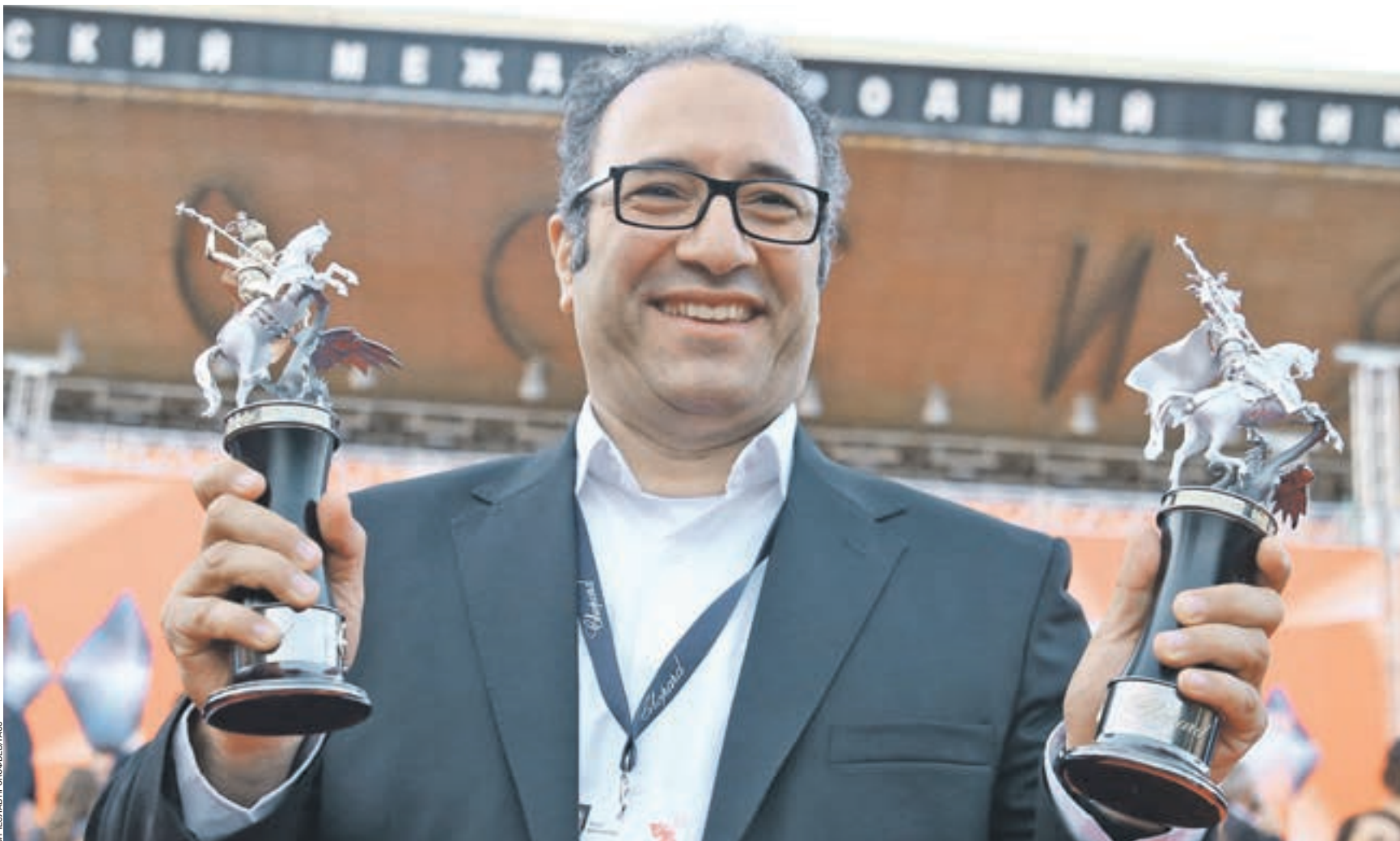
30 июня 2016 года 19:45 Иранский режиссер Реза Миркарими, получивший главный приз 38-го МКФ «Золотой Георгий» после церемонии закрытия у театра «Россия»

На этом фоне вполне закономерно выглядят итоги зрительского голосования: призом зрительских симпатий отмечен «Дневник машиниста». Хорватско-сербская «черная комедия» — ироничная попытка Милоша Радовича исследовать глубины подсознания молодого машиниста, поющего под улетавшую магию статистики пришестьев. Три конкурсные программы (в игровой участвовало 13 фильмов, в конкурсе документального кино — 8, в конкурсе короткометражек — 14 работ) продемонстрировали общее нарастание субъективности авторского взгляда на актуальные процессы современности. Режиссеры все чаще обращаются к сюжетам о проблемах беженцев и мигрантов, об отношениях меж-