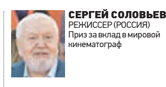
СЕРГЕЙ СОЛОВЬЕВ РЕЖИССЕР (РОССИЯ) Приз за вклад в мировой кинематограф

Я очень приятно удивлена, что моя маленькая история «Полный селфи» получила такую большую и важную награду — «Серебряного Георгия». В Канаде меня отговаривали от поездки в Москву, говорили, что тут страшные люди, страшные порядки. Но я — здесь, Москва — чудесный город! Я очень рада, что побывала в России.