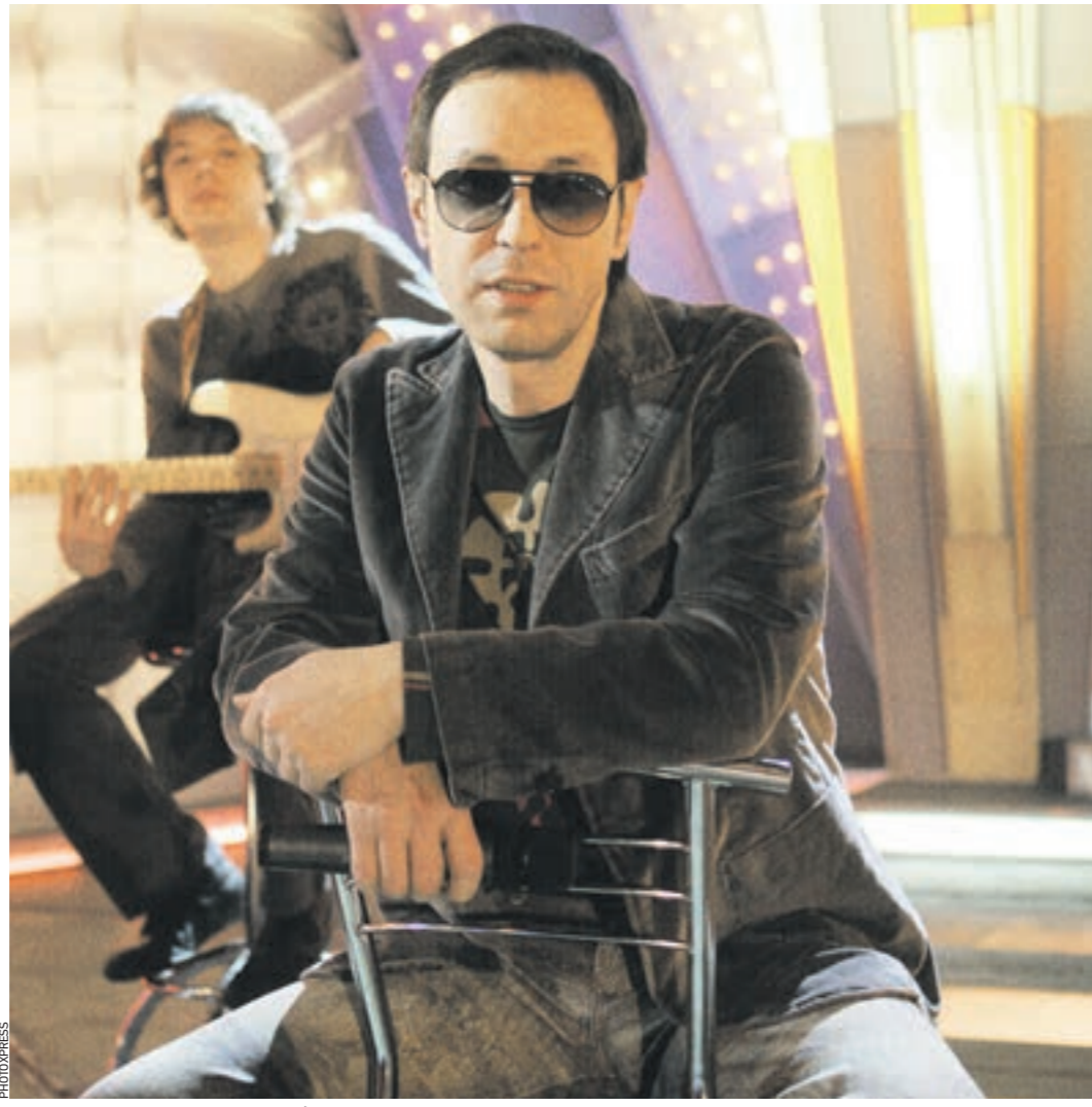
На концерте Николай Носков обещает вспомнить молодость и по-настоящему замечать. Два часа хорошего настроения зрителям обеспечены!

Певец Николай Носков 9 ноября в «Крокус Сити Холле» представит записанный в Германии «промежуточный» альбом «Без названия».