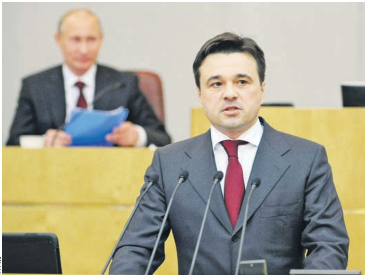
11 апреля 2012 года. Зампредседателя Госдумы и глава фракции «Единая Россия» Андрей Воробьев, назначенный вчера исполняющим обязанности губернатора Московской области, выступает в зале заседаний российского парламента

Вчера президент России Владимир Путин предложил Воробьеву возглавить столичный регион, и один из лидеров «Единой России» ответил согласием. «Для каждого человека работа в парламенте страны, тем более в главе крупнейшей фракции, очень важна, но я хотел бы предложить вам другую работу, связанную с исполнительной деятельностью», — обратился к Воробьеву глава государства. — Я имею в виду пост исполняющего обязанности губернатора Московской области». Воробьев принял решение сразу: «Регион большой, непростой, но я готов работать», — ответил он президенту, добавив, что намерен следовать курсом прежнего губернатора области Сергея Шойгу. Следовать придется как минимум до сентября 2013 года, когда в Подмосковье состоятся губернаторские выборы.