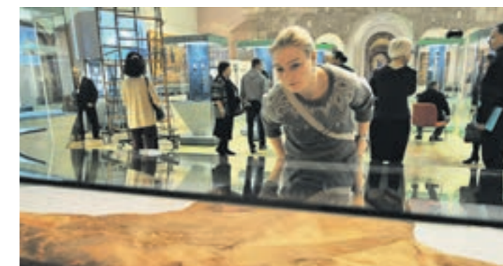
На выставке представлены одежда древних славян и оружие

Исторический музей вспомнил о важной для нашей страны дате: в этом году исполняется 1150 лет с момента основания Древнерусского государства.