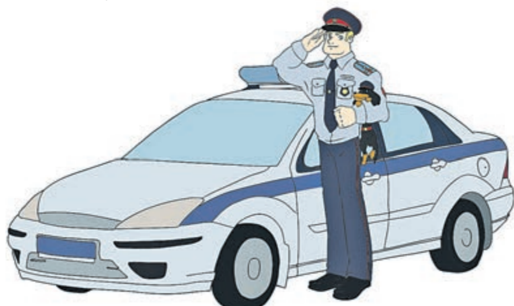
Иллюстрация к поэме «Дядя Леша — полицейский-богатырь»

Фрагмент из поэмы: А теперь мы все привыкли, Что московский Алексей К нам спешит на мотоцикле В двести сорок лошадей! А на крышке бензобака Расположена притом Очень длинная собака Сочень маленьким хвостом.