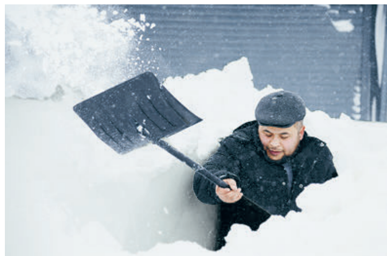
Москва и Южно-Сахалинск. И везде погода нынче удивляет.