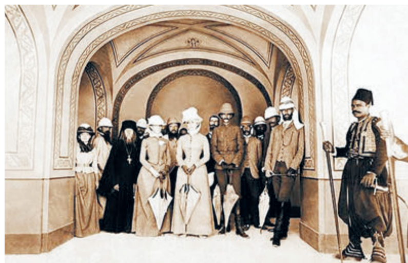
Великий князь Сергей Александрович и великая княгиня Елизавета Федоровна в храме Марии Магдалины в Иерусалиме. 1888 год.

было создано Императорское православное палестинское общество. 21 мая (3 июня по новому стилю) в Санкт-Петербурге состоялось торжественное собрание членов-учредителей