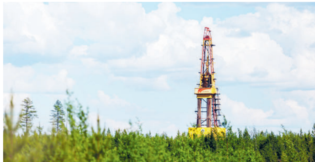
Центры геологического сопровождения бурения «Роснефти» обеспечивают стопроцентный контроль над процессами.

В 2021 году доля запасов месторождений, открытых «Роснефтью», составила 75% от всех открытий в Российской Федерации. Успешность поисково-разведочного бурения составила 90%. Специалисты нефтяной компании открыли 256 залежей и два месторождения, в результате чего на государственный баланс поставлено более 490 млн тонн нефти. На суше «Роснефть» выполнила более 1,1 тысячи км сейсмических работ методом 2D и около 5,7 тысячи км 2 сейсмических работ методом 3D, что почти на треть превышает объем работ за аналогичный период 2020 года. Проходка в эксплуатационном