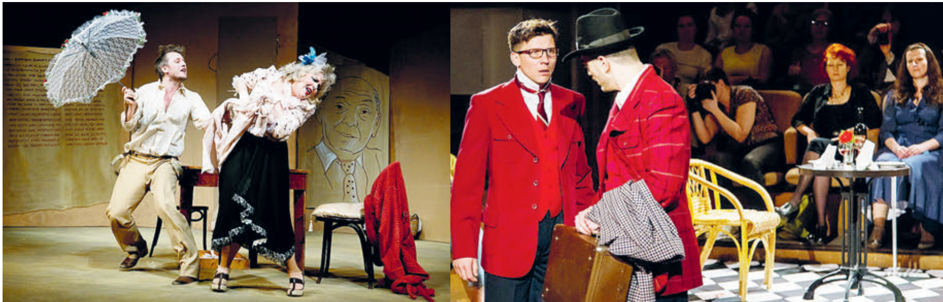
Вот и попробуй объединить такие разные театры, как «Эрмитаж» и «Сфера».

«Мостсовет», «Сферитаж», кто следующий? Объединение московских театров набирает обороты