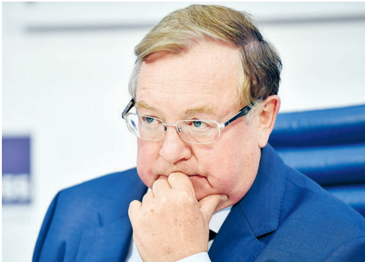
Сергей Степашиным не чужды истории, книги и футболу.

– Только на первый взгляд. Начинал я свою службу с должности замполита роты, год жил в казарме безвылазно, в лучшем случае один выходной в месяц. В роте было много солдат из